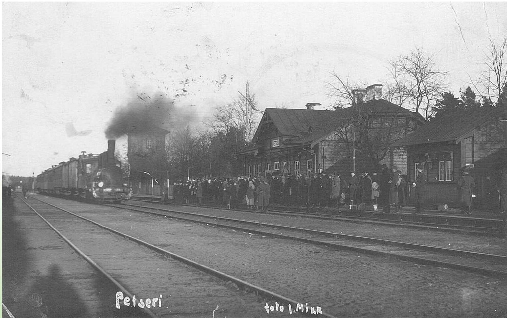
Petseri raudteejaam 1927. a. Foto: J. Mikk

Karilatsi Vabaõhumuuseumi kogust PTM F 125:44/F17-279