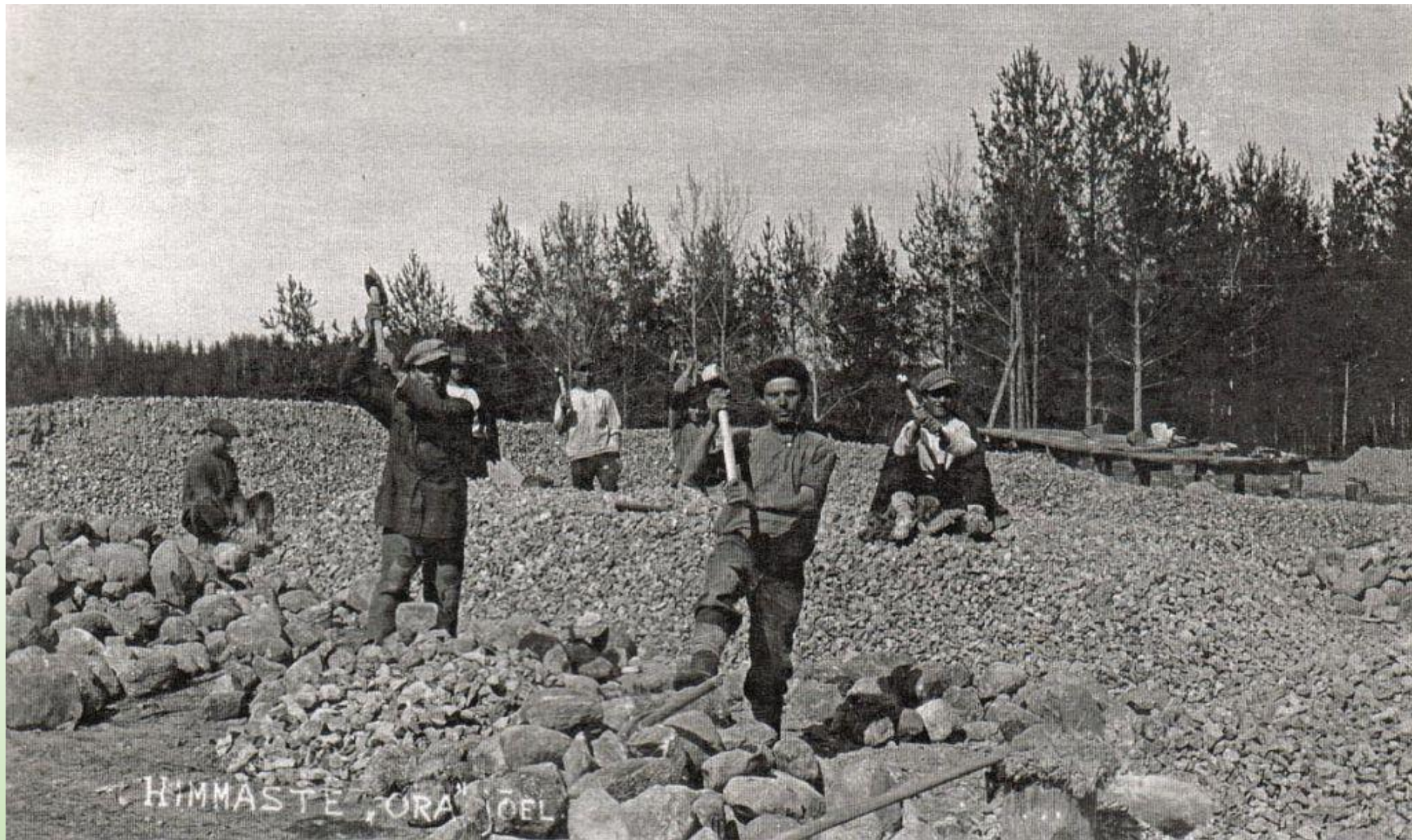
Tartu-Petseri raudtee ehitus, Himmaste. Foto: Ivask Karilatsi Vabaõhumuuseumi kogust PTM F 110:17/F4-62