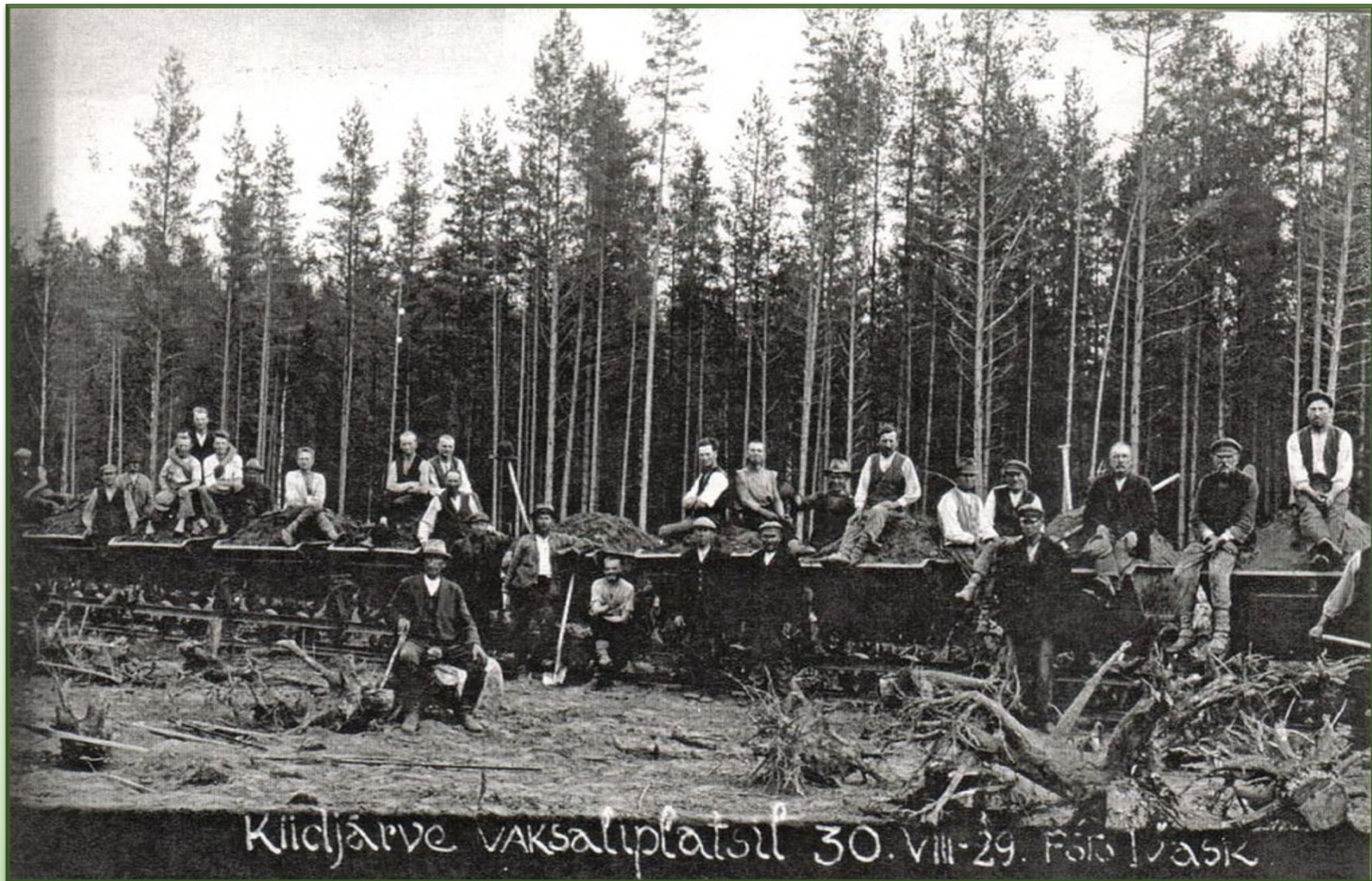
Tartu Petseri raudtee ehitus Kiidjärve lõigul.