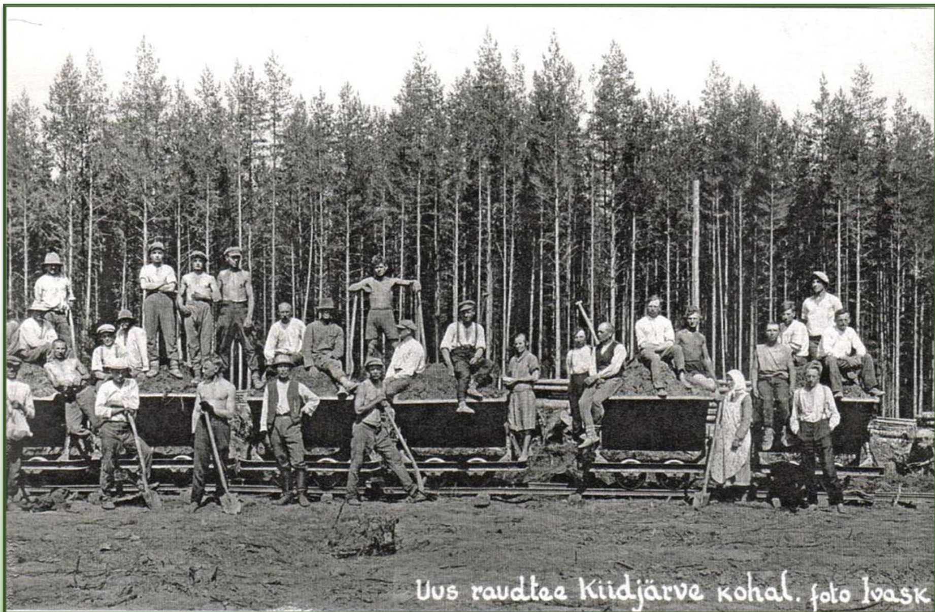
Uus raudtee Kiidjärve kohal.

Tartu Petseri raudtee töölised Kiidjärve lõigul.