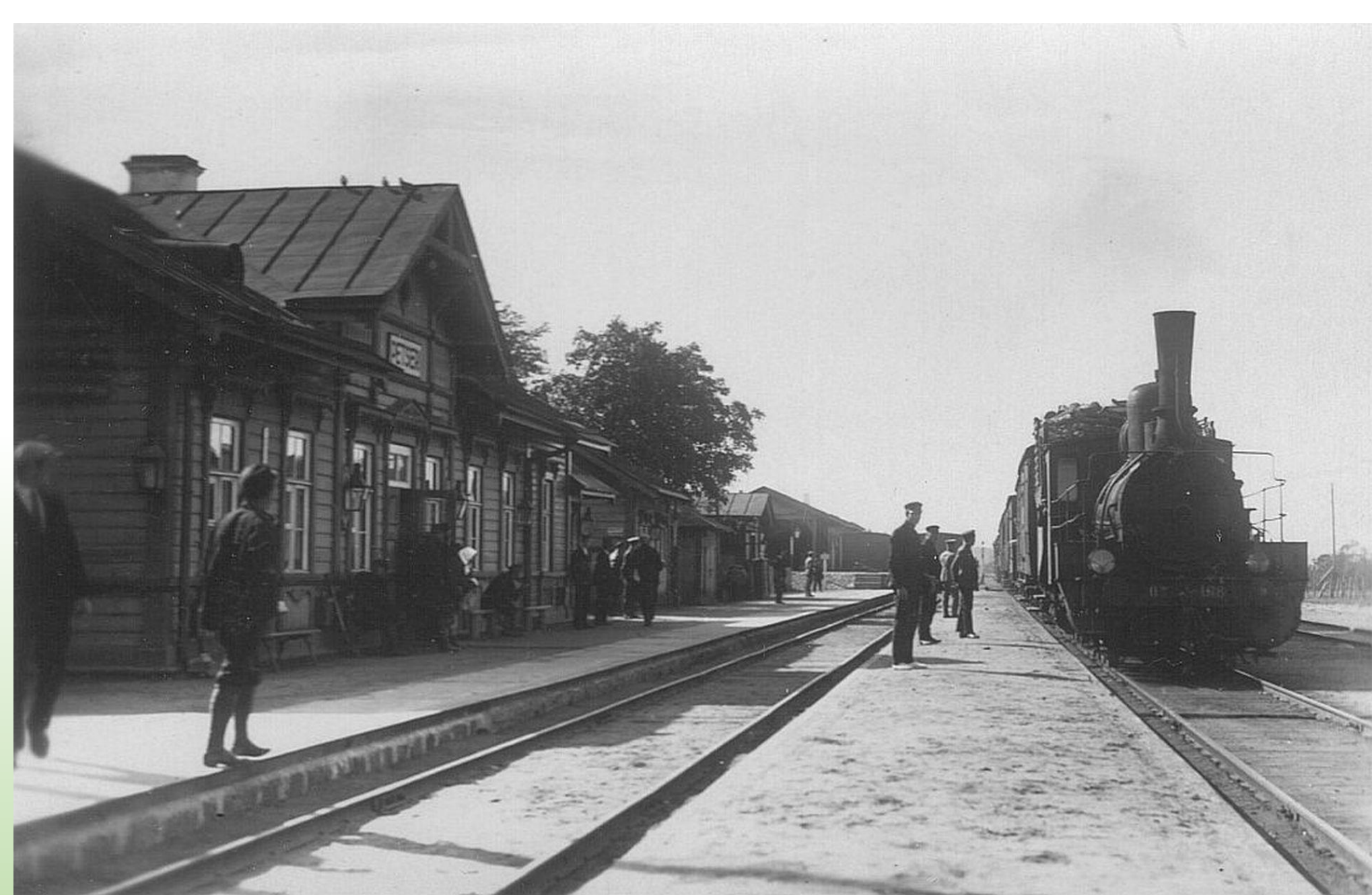
Petseri raudteejaam 1930-ndatel