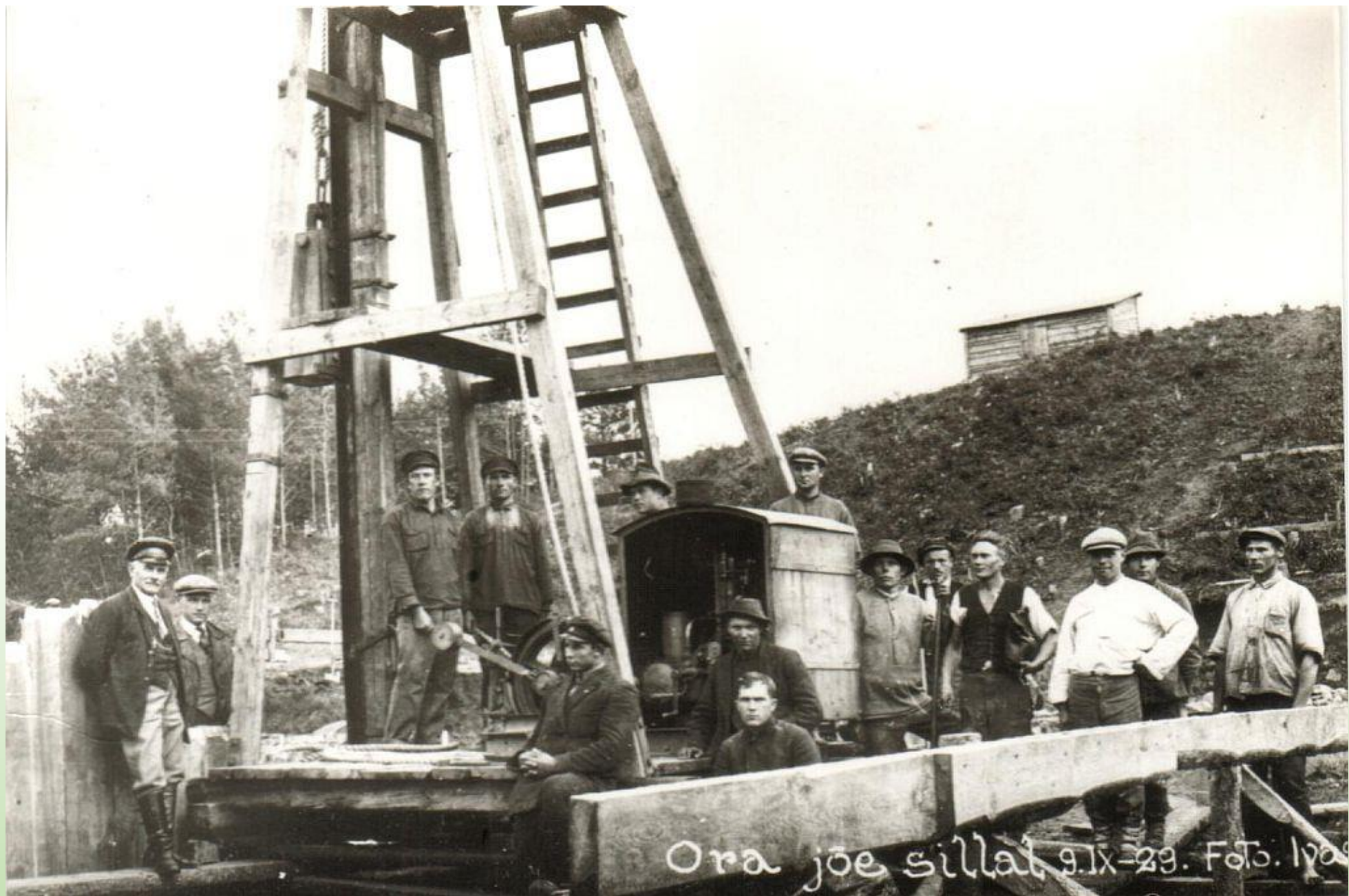
Tartu Petseri raudtee ehitus, jõutud on Orajõe silla ehituseni. Töölised rammimismasina juures 9.09. 1929. a.