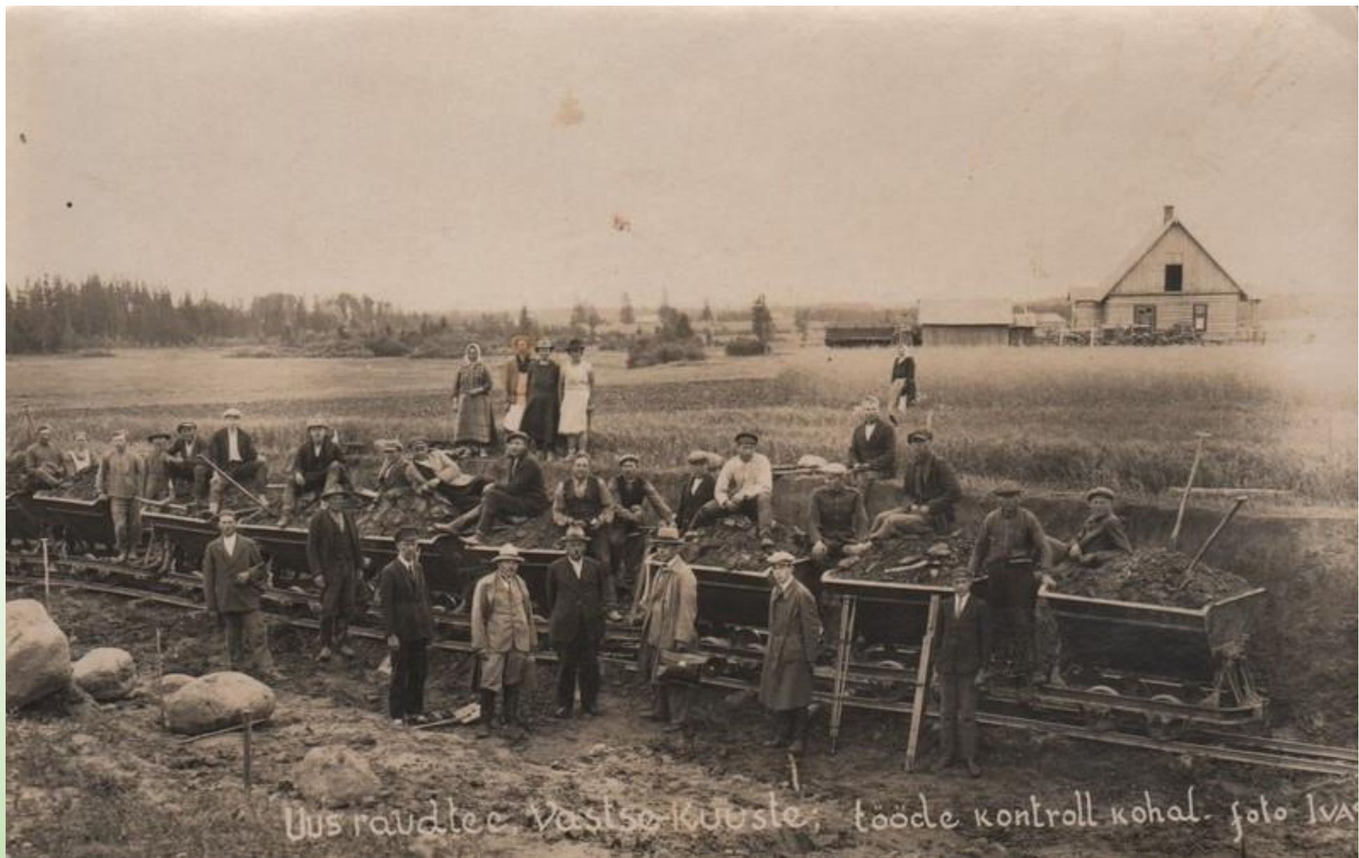
Uus raudtee Vastse-Kuuste, tööde kontroll kohal.

Tartu Petseri raudtee ehitus, objektile on saabunud tööde kontroll.