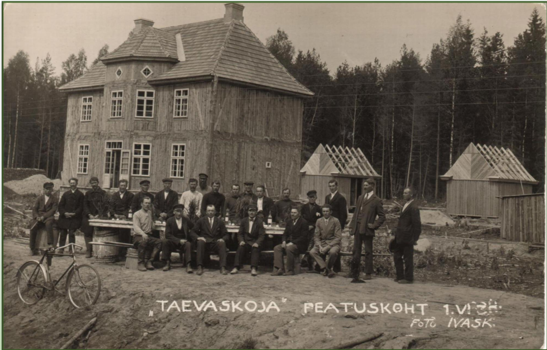
Taevaskoja peatuskoht, kahekordne puitehitis ja ehitusjärgus kõrvalhooned 1938. a. Esiplaanil ehitajad laua juures.