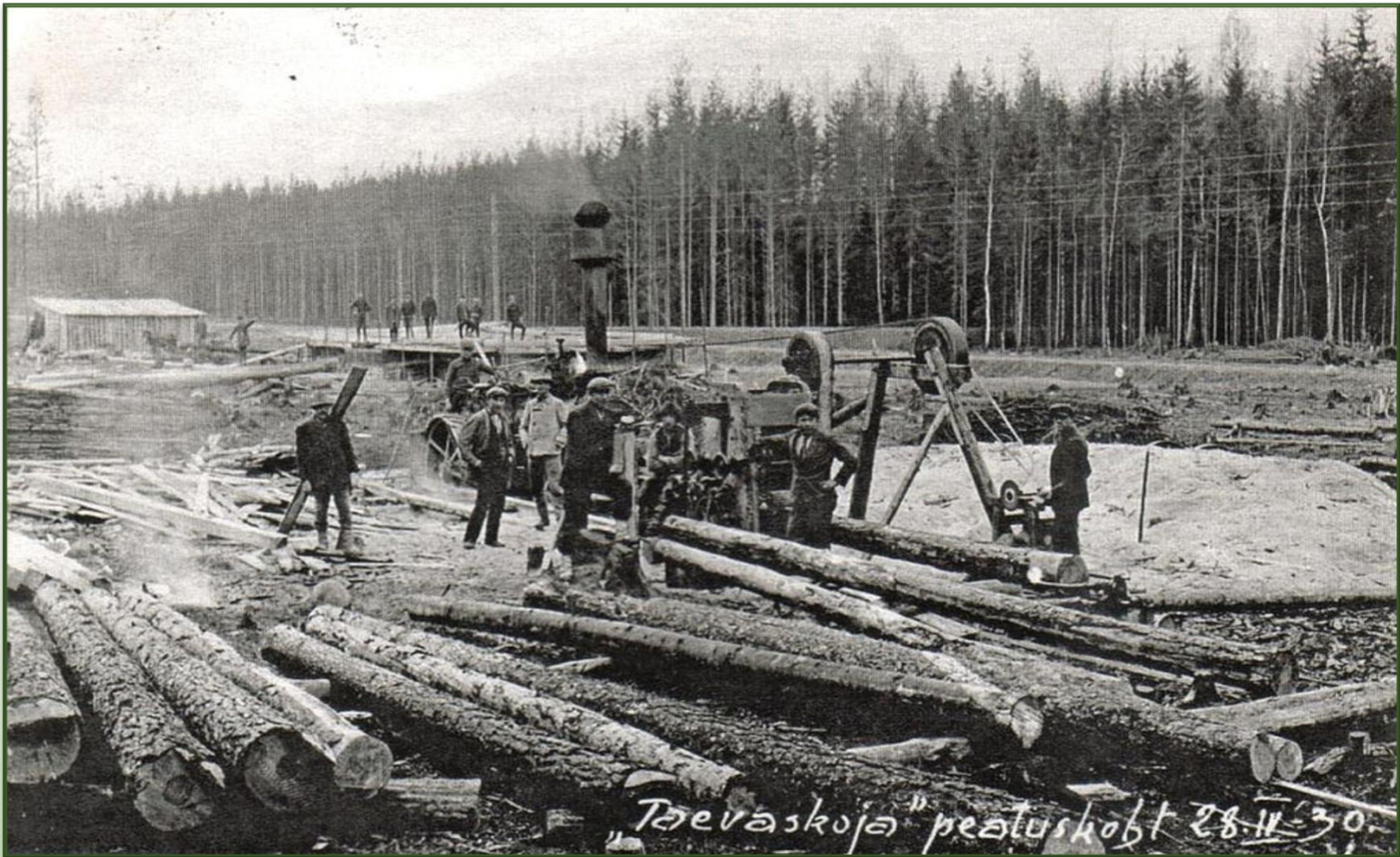
Taevaskoja peatuskoht. Esiplaanil palgid ja saeraam, taamal aurumasin.