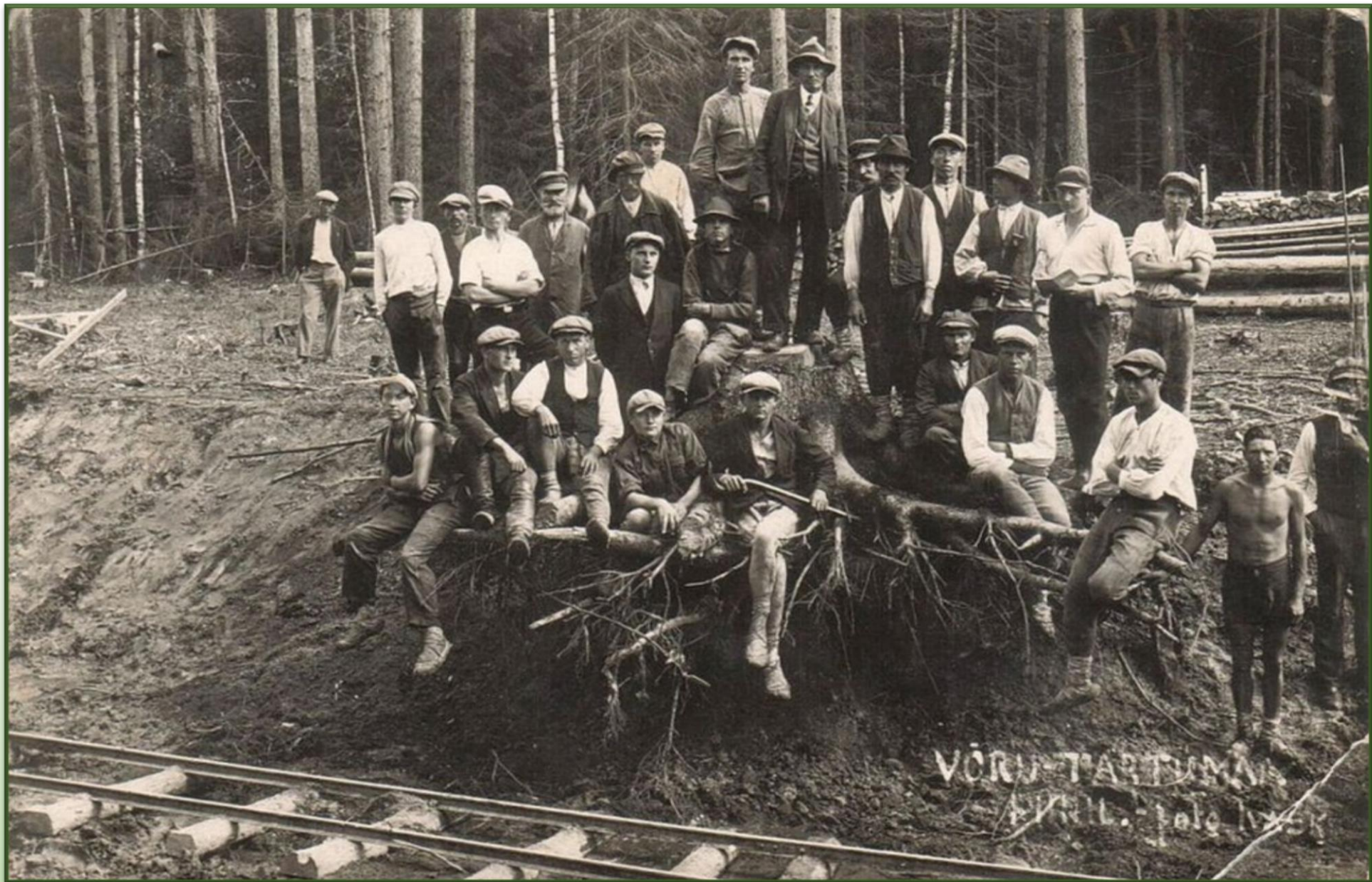
Võrumaa-Tartumaa piiril.