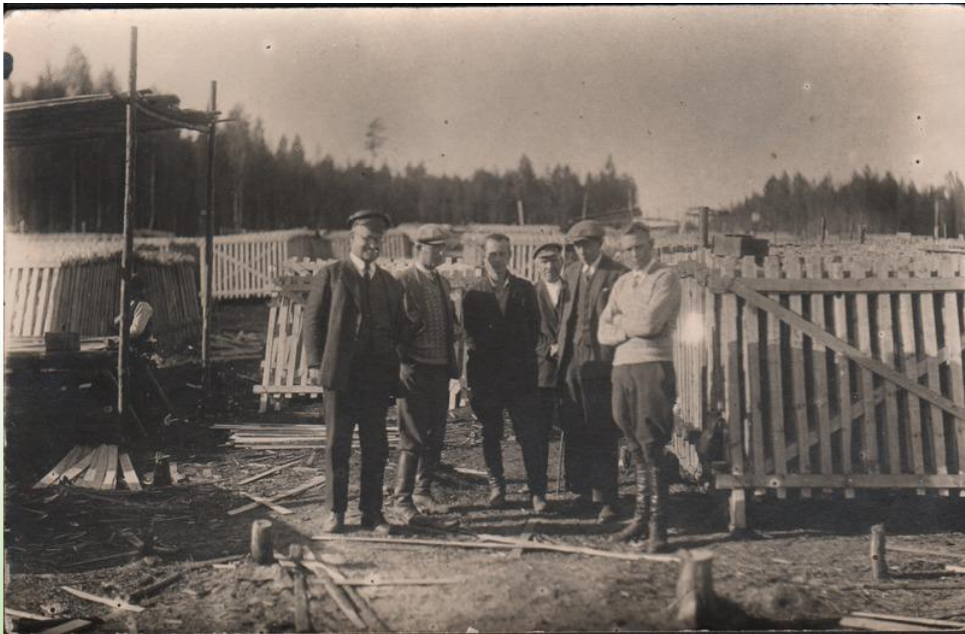
Tartu Petseri raudtee ehitus Himmastes. Autor: Ivask Karilatsi Vabaõhumuuseumi kogust PTM F 110:10/F4-55