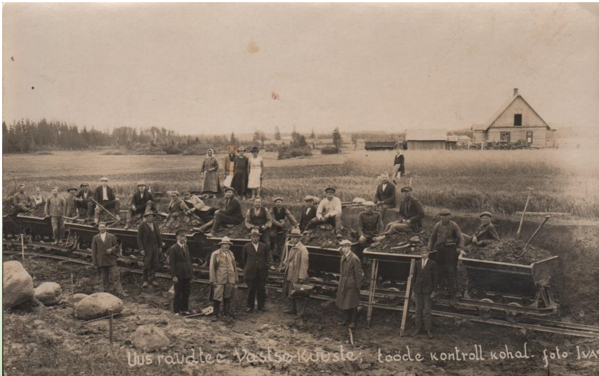
Tartu Petseri raudtee ehitus. Uus raudtee Vastse Kuuste kohal. PTM F 110:9/F4-54