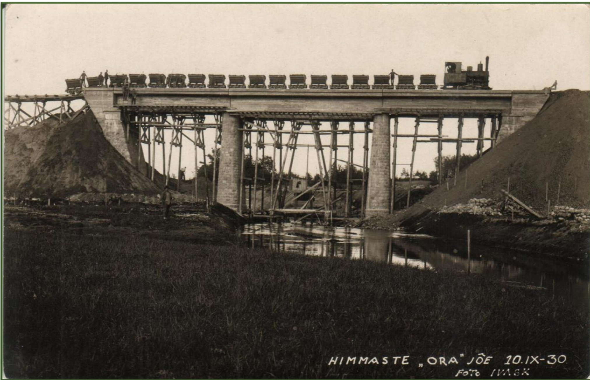
Himmaste, Orajõe sild.