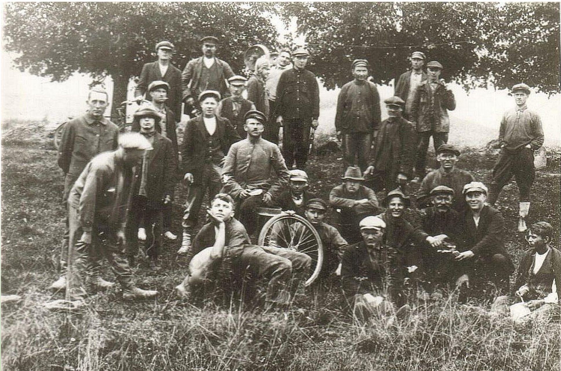
Tartu Petseri raudtee ehitajad. Foto: Ivask. Karilatsi Vabaõhumuuseumi kogust PTM F 70:7/F4-26