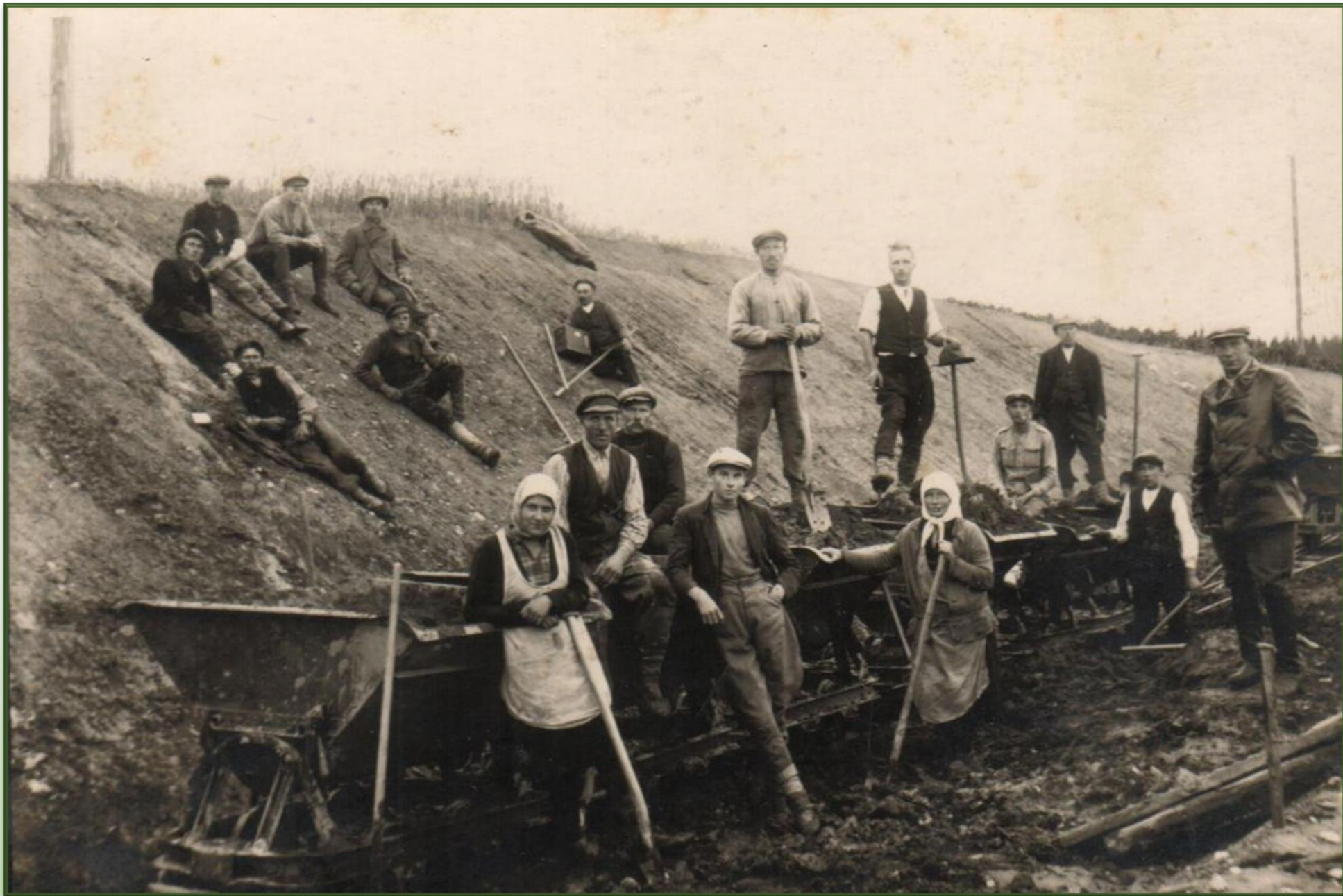
Tartu Petseri raudtee töölised ja vagonetid raudteetammi juures.