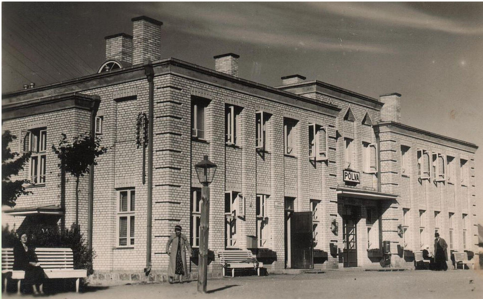
Tüüp kavandi järgi 1931. a. valminud Põlva jaamahoone.