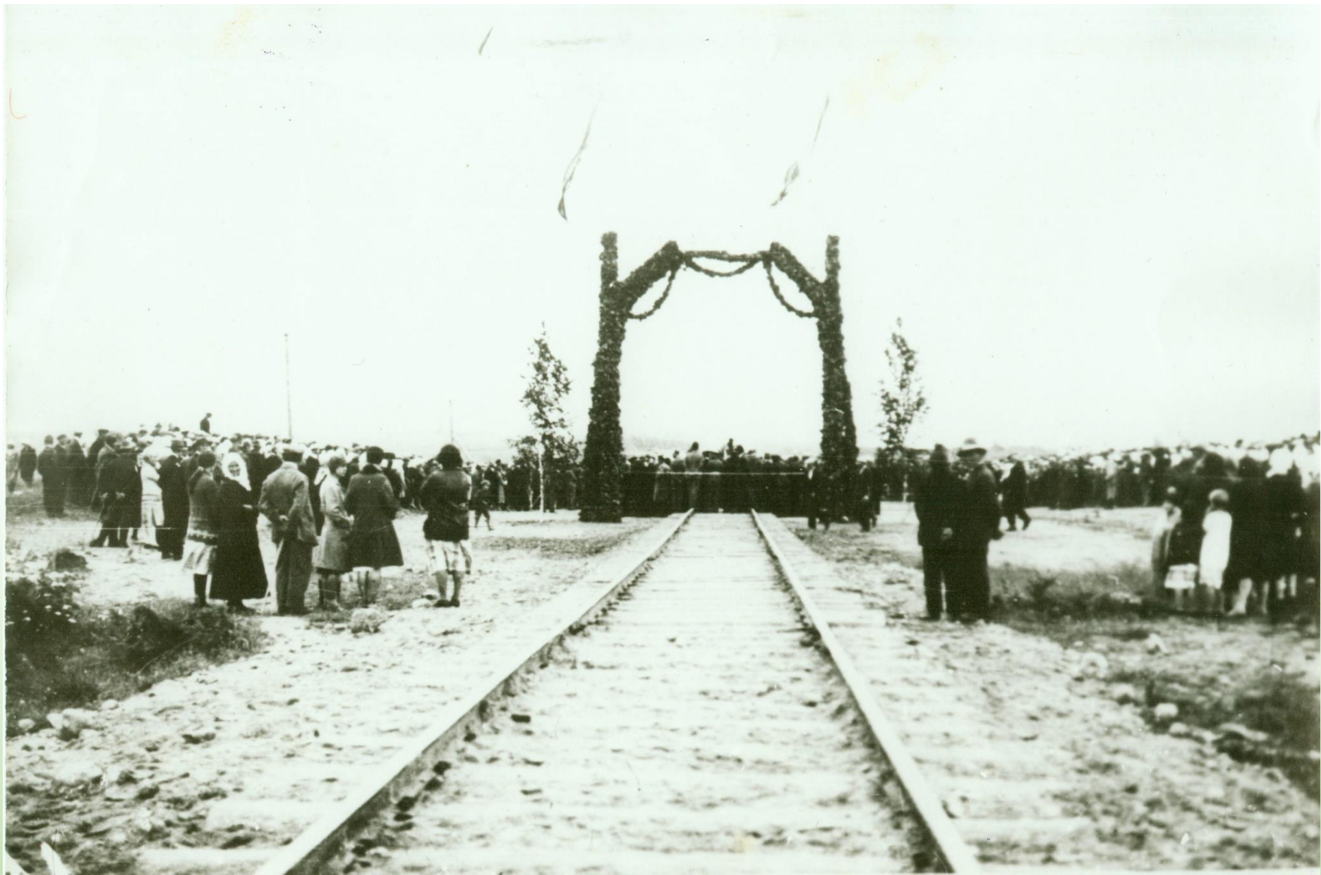
Tartu-Petseri raudtee avamine Veriora jaamas. Foto: K. H. Akel

Karilatsi Vabaõhumuuseumi kogust PTM F 213:24/F4-114