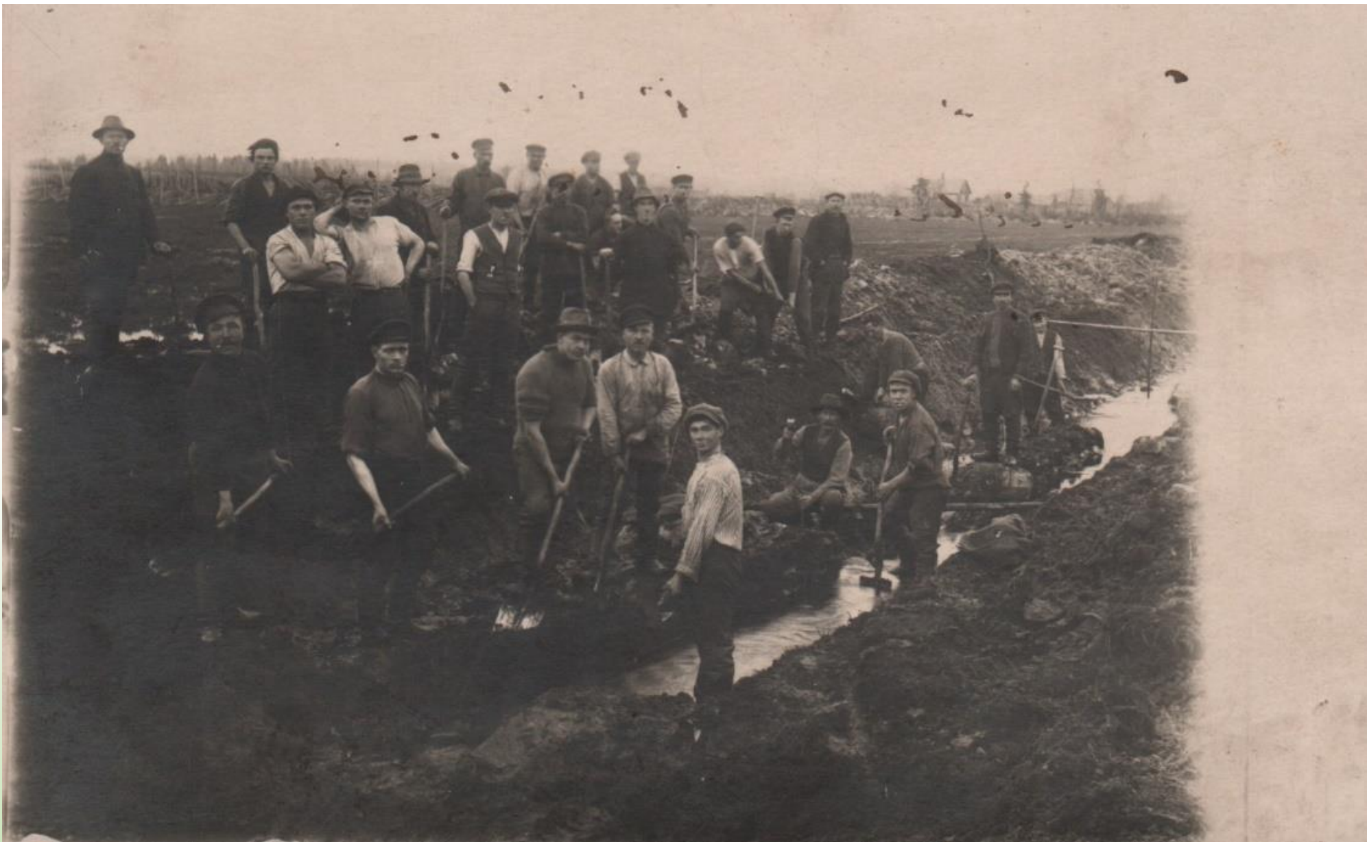
Mullatööd Tartu Petseri raudtee ehitusel. PTMF0110_006F4-51