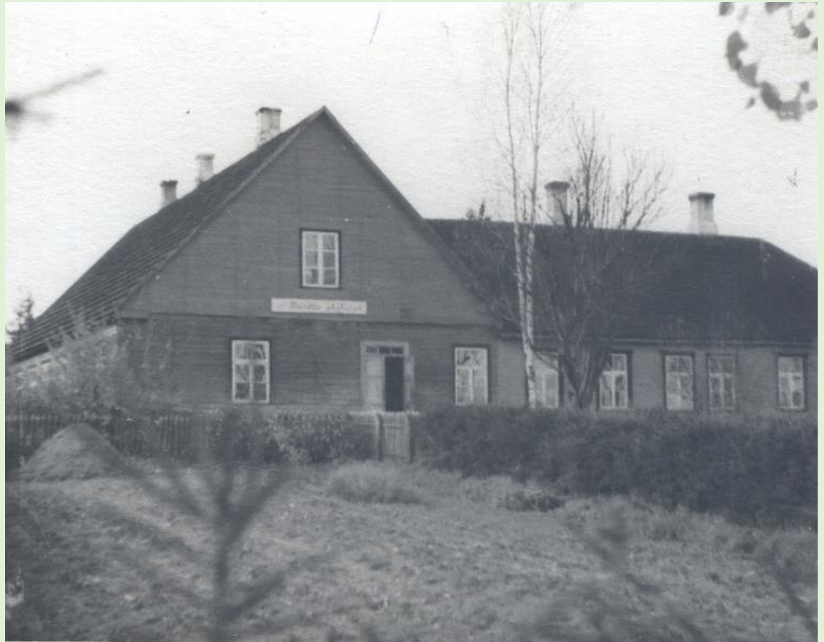
Reidle Algkooli hoone 1948. a.

Aastatel 1922-1923 ehitati koolimaja ümber. Kool suletud.