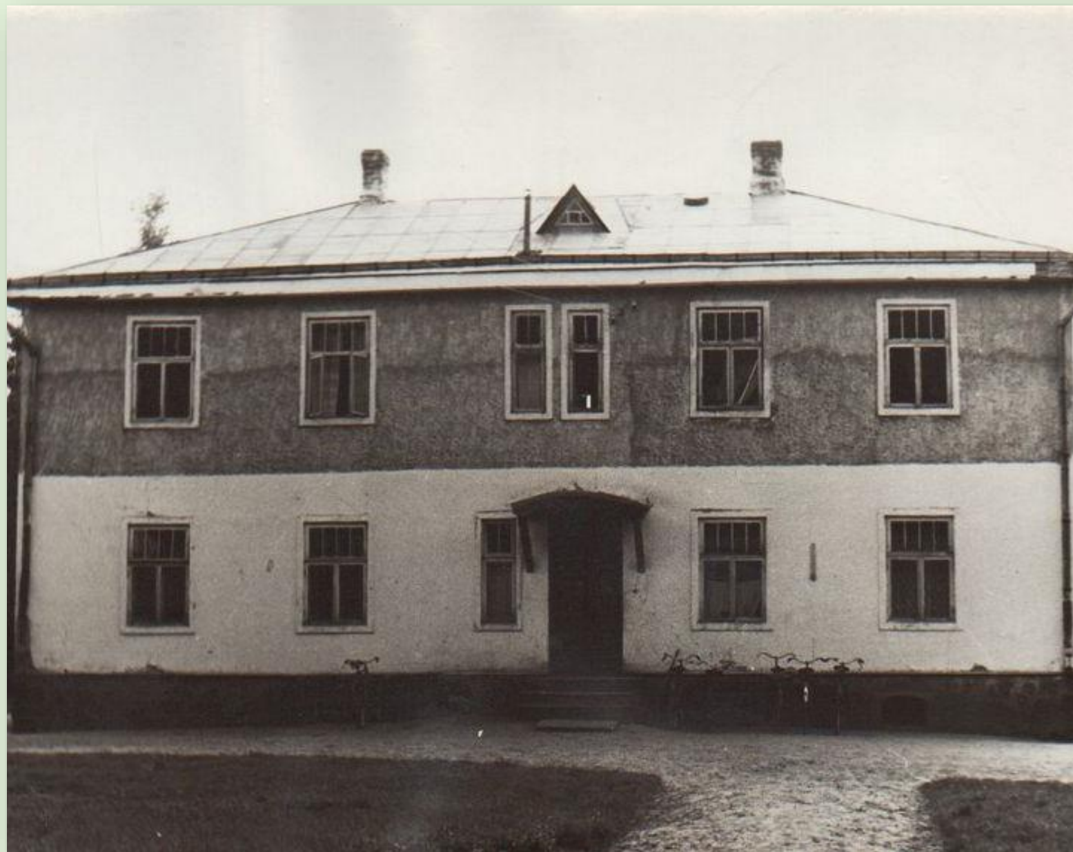
Ruusa 8-klassilise kooli maja 1966. a.

Räpina kihelkonnas Veriora vallas Ruusa raudteejaamas jätkas 1948. a. tööd Ruusa kooli nime all endine Toolamaa valla Võuküla külakool (asutatud 1774. a.). 165 aastat oli kool töötanud Võukülas. 1939.a. Toolamaa vald kaotati. Võuküla kool viidi üle Veriora valla alla ja kooli uueks asukohaks sai Tartu-Petseri raudtee rajamise järel rahvarohkeks kohaks muutunud Ruusa raudteejaam. 1940.a. nimetas Veriora vallavalitsus ka kooli ümber Ruusa kooliks ja kool muudeti seejärel 7-kl. kooliks. Kui raudteejaam kaotas endise tähtsuse ja elu koondus Ruusa sovhoosi keskusesse, viidi Võuküla-Ruusa kool sellest majast Ruusa sovhoosi keskusesse. Kool töötab tänaseni.