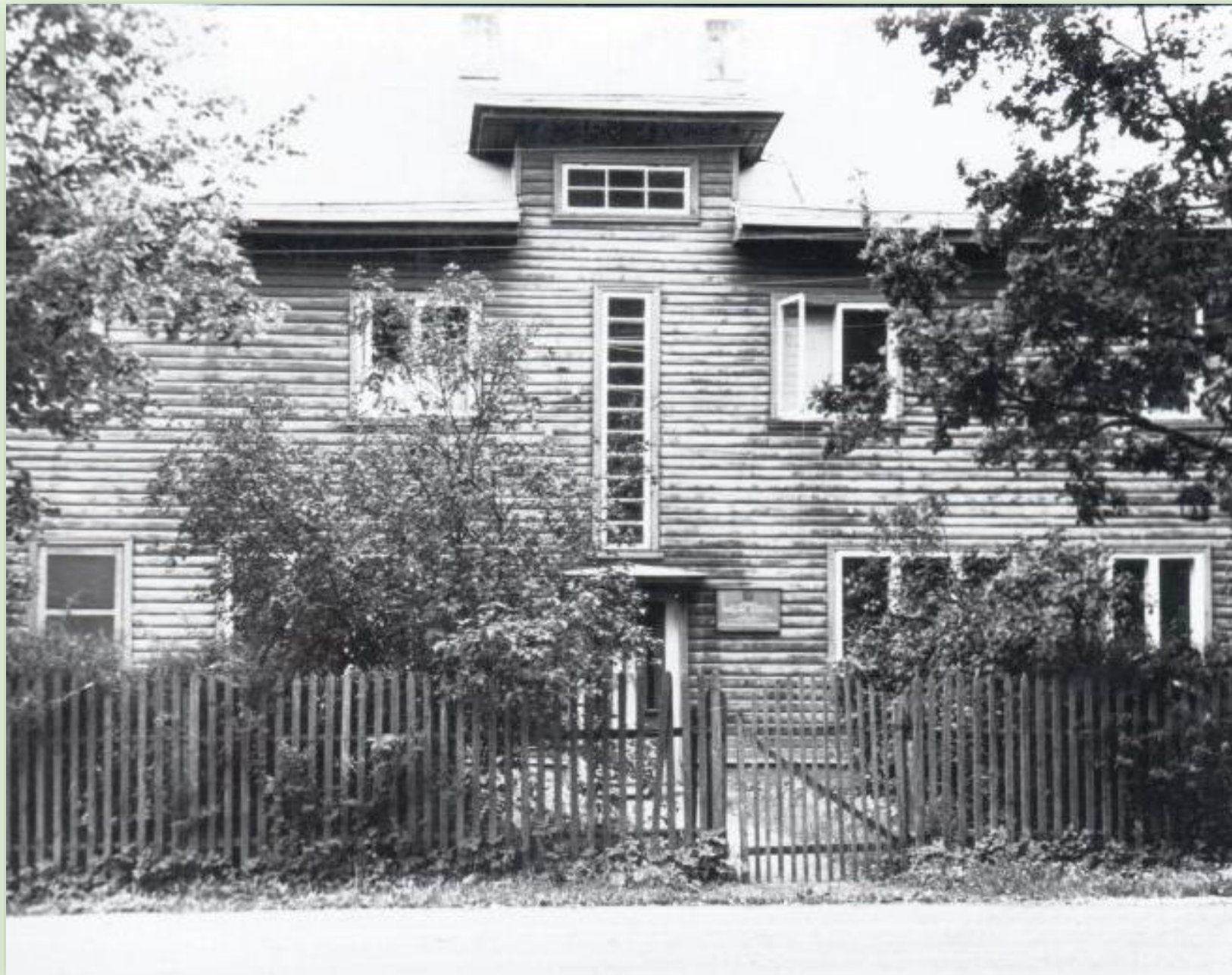
Taevaskoja koolimaja 1966. a.

Koolihooneks oli elumaja, mille teisel korrusel olid endiselt korterid. Kooli kasutuses oli alumine korrus kahe klassiruumi ja jalutussaaliga. Kool suleti 1972. aastal.