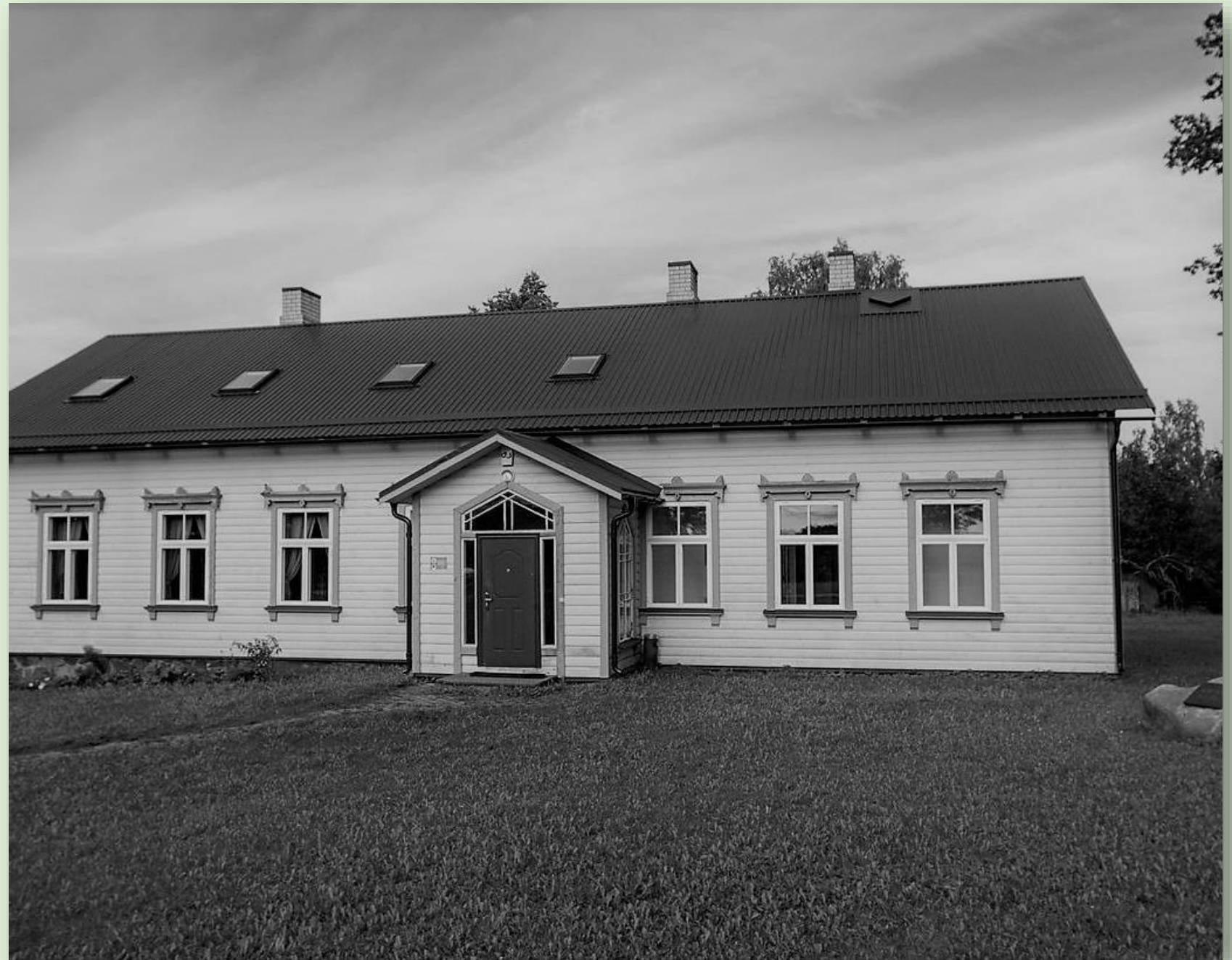
Endine Kaika algkooli hoone, täna seltsimaja

Kool asus Antsla vallas Võrumaal. Kool rajati Kaikale algselt venekeelse kihelkonnakoolina üheaegselt kiriku ehitamisega, hiljem muudeti eesti-keelseks. Suleti 1999. aastal ning hoone on praegu kasutusel seltsimajana.