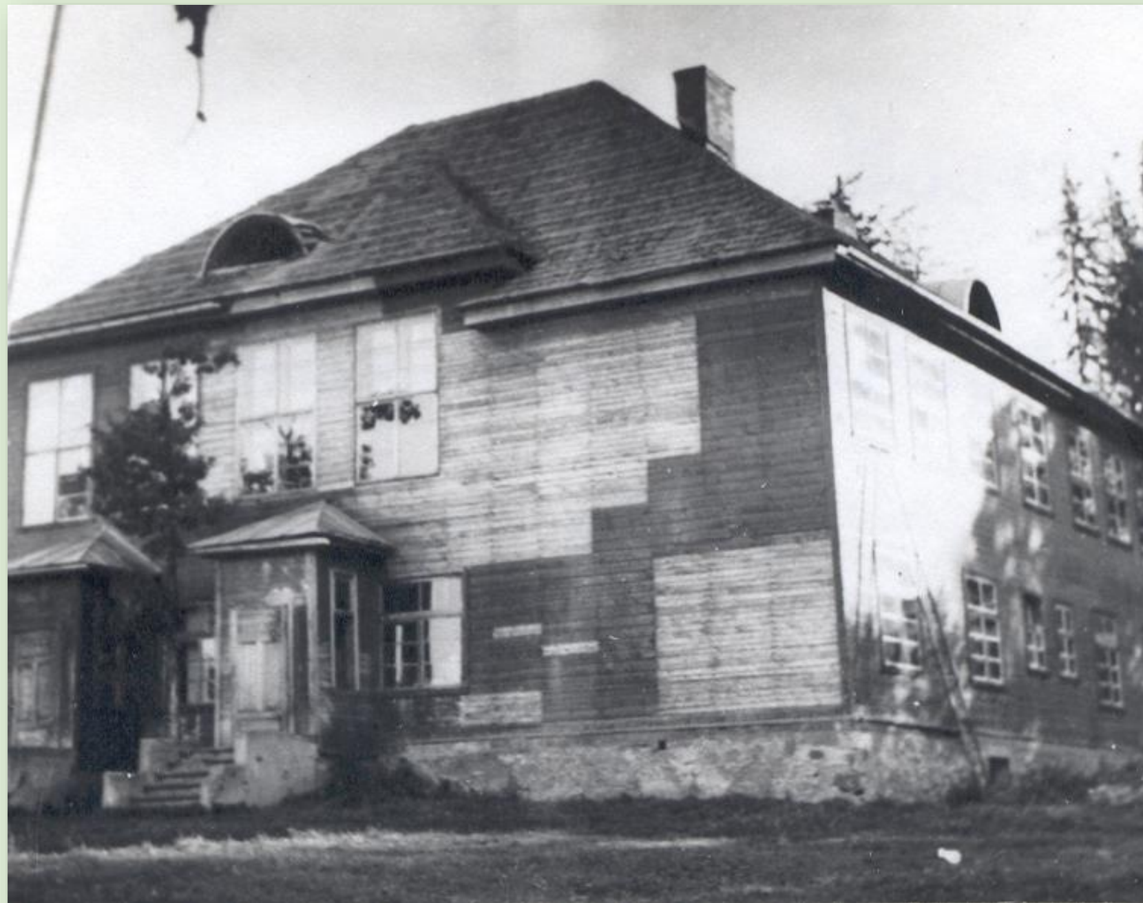
Vastse-Roosa koolimaja 1948. a.

Kool asus Vastse-Roosa külas Varstu vallas. Uus koolimaja valmis 1935. aastal ja pühitseti sama aasta 12. detsembril. Kool suleti 1972. aastal.