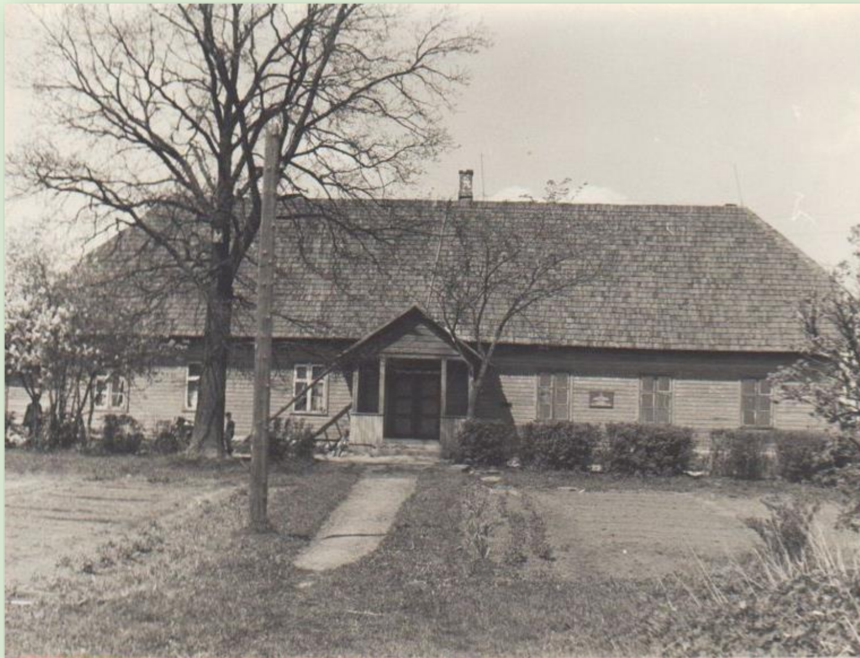
Kärša koolimaja 1966. a.

Kärša kool alustas tööd juba 1786. aastal. Varasem koolimaja põles maha 1889, samal aastal ehitati vallavolikogu otsuse põhjal uus koolihoone. 1929/30. õppeaastal sai kool ruume juurde Ahja endises härrastemajas. Kuna kõik klassid härrastemajja ära ei mahtunud, jäi kooli kasutusse ka Kärša koolimaja. Kool suleti 1971. aastal. Koolimaja on säilinud.