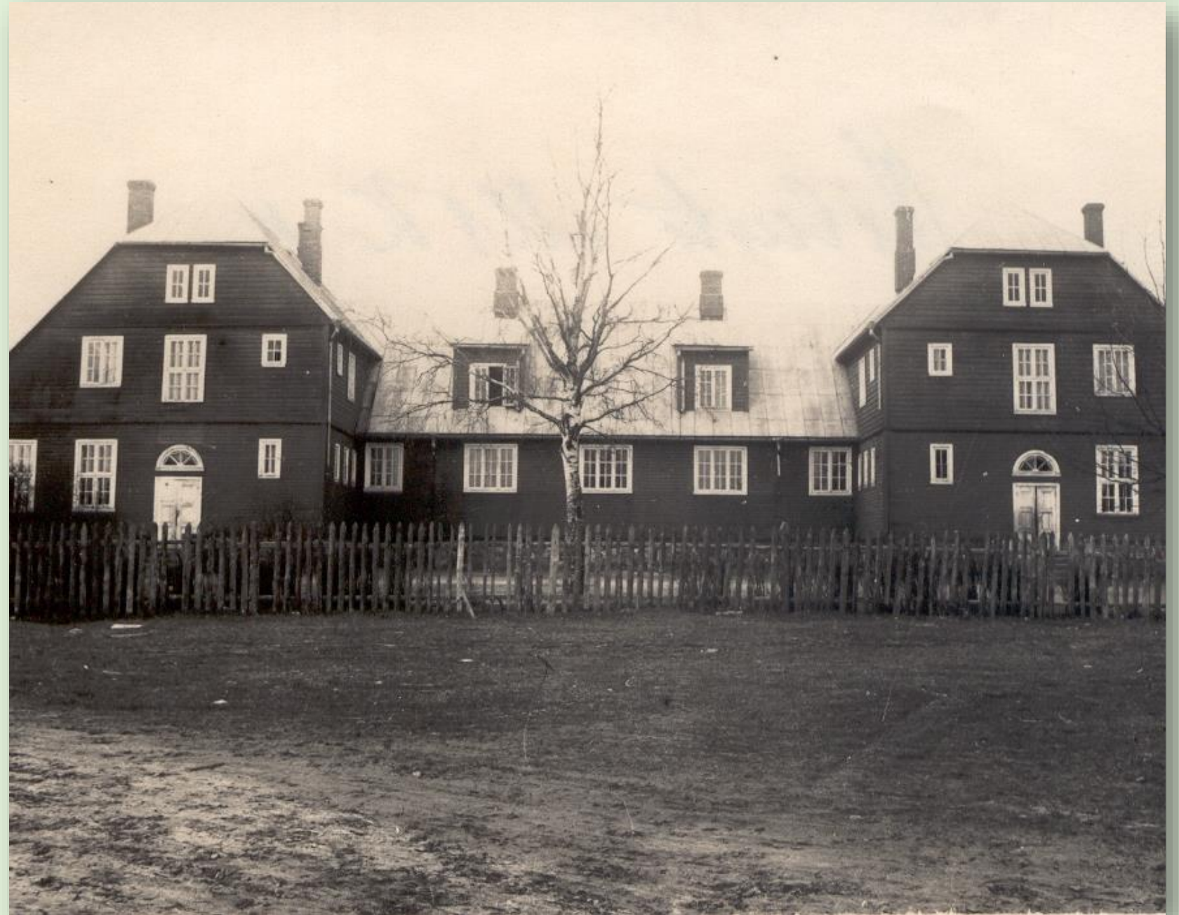
Viluste algkool 1949. a.

Praegu töötab kool uues 2001. aastal valminud majas ja kannab nime Viluste Põhikool.