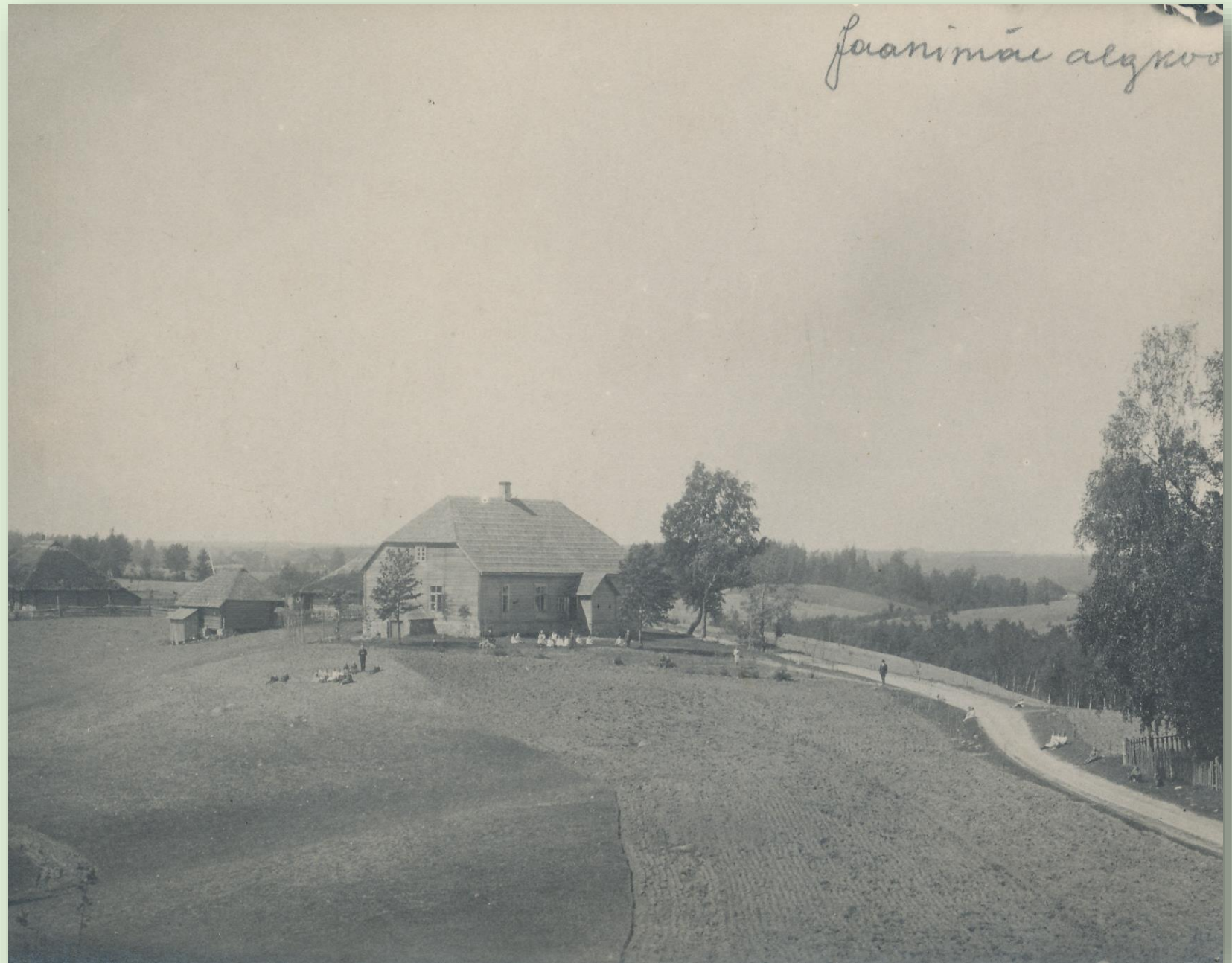
Jaanimäe koolimaja 1922-1940. a.

Jaanimäe Algkool Haanja vallas Võrumaal. Hoone on ehitatud 1881. aastal. Kool suleti 1969.