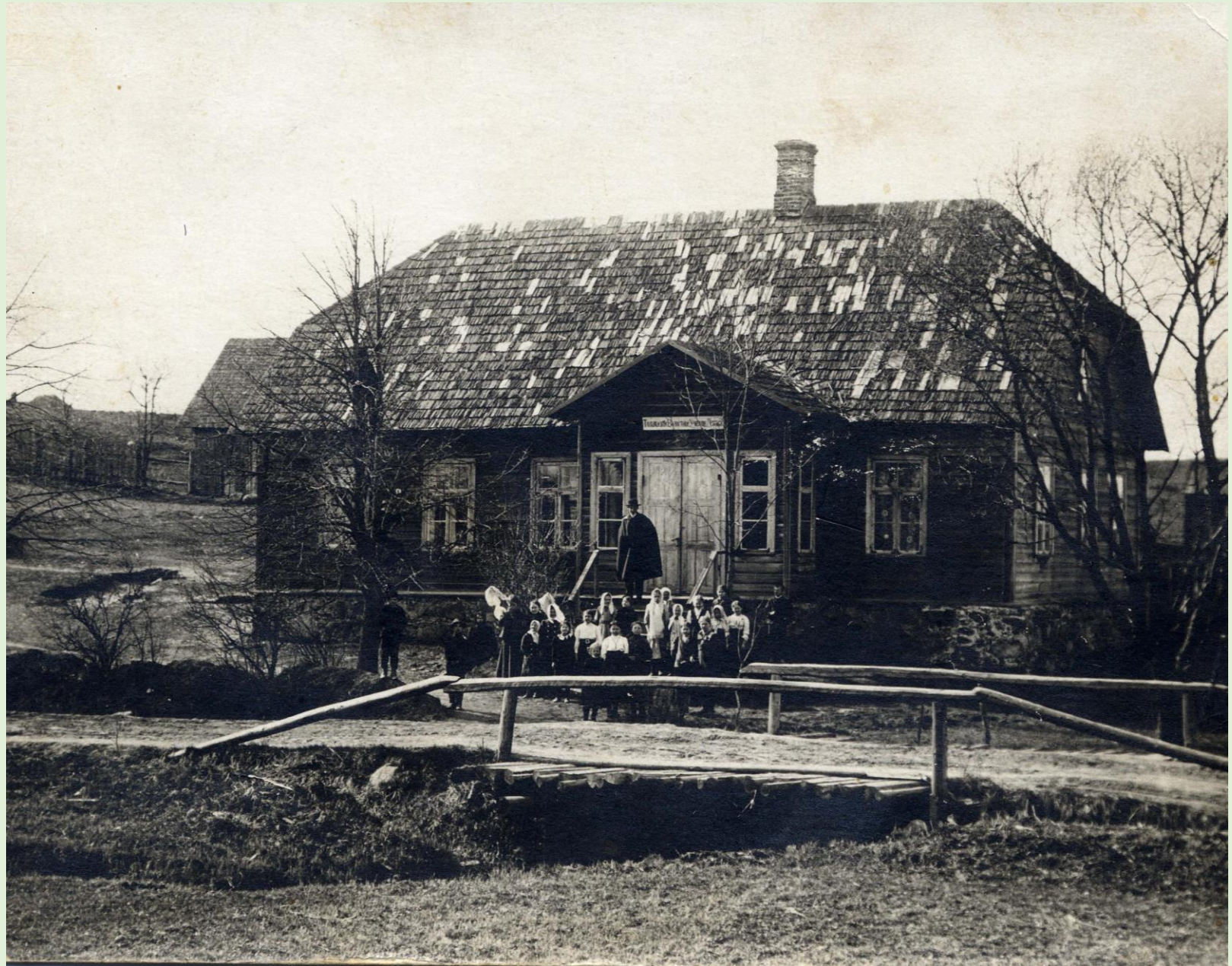
Leevaku vallakool enne 1917. a.

Kool asus Räpina vallas. Töötas Leevaku Põhikoolina kuni 1993. a. Seejärel algkoolina. Kool suleti 2001. a.