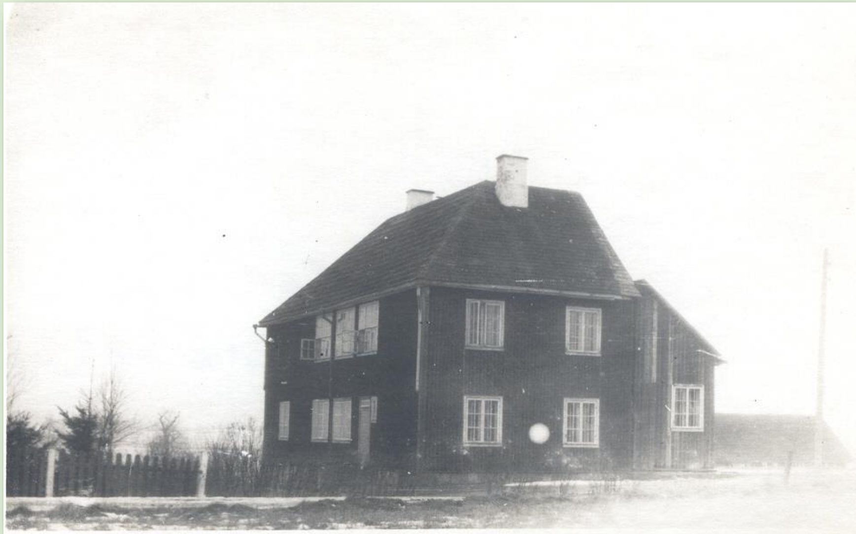
Lasva Algekooli hoone

1934. aastal otsustas Lasva valla volikogu poolelioleva seltsimaja ära osta ja kohandada see moodaks koolimajaks. Maja valmis 1936 ning kool avati pidulikult 28. novembril 1937. Koolimaja uue osa alumisel korrusel olid juhataja korter ja poiste internaat, ülemisel 2 klassiruumi ja õpetajate tuba. Endisesse seltsimaja ossa tehti alla vestibüül, riietehoid, tüdrukute internaat, õppeköök, teenija ja teise õpetaja korter. Teises maailmasõjas enamuse hoone kunagisest seltsimaja tiivast hävis. Lasva kool suleti 1988. aastal.