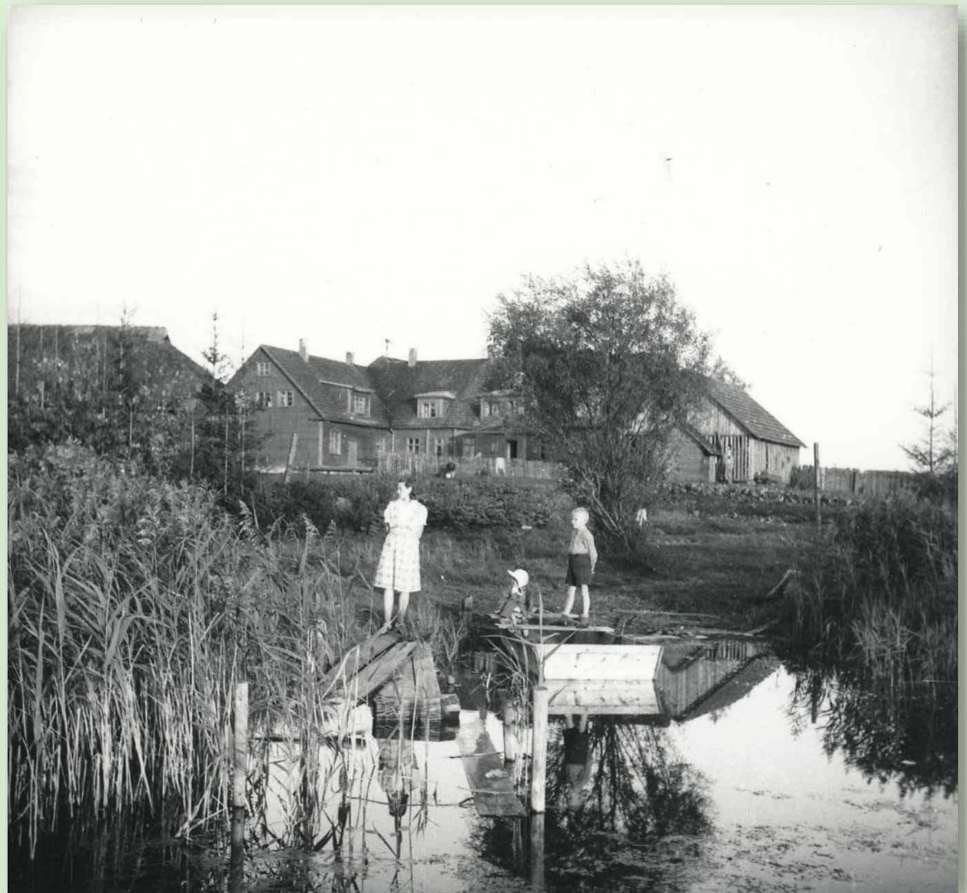
Misso kool. Autor: Alfred Hollo

Peale II maailmasõda muutus Pugola 6-klassiline kool Misso 8-klassiliseks kooliks ning aastal 1957 sai Misso koolist keskkool. 2008 valmis uus koolimaja. Alates 2011. aastast tänaseni tegutseb Misso Kool taas põhikoolina.