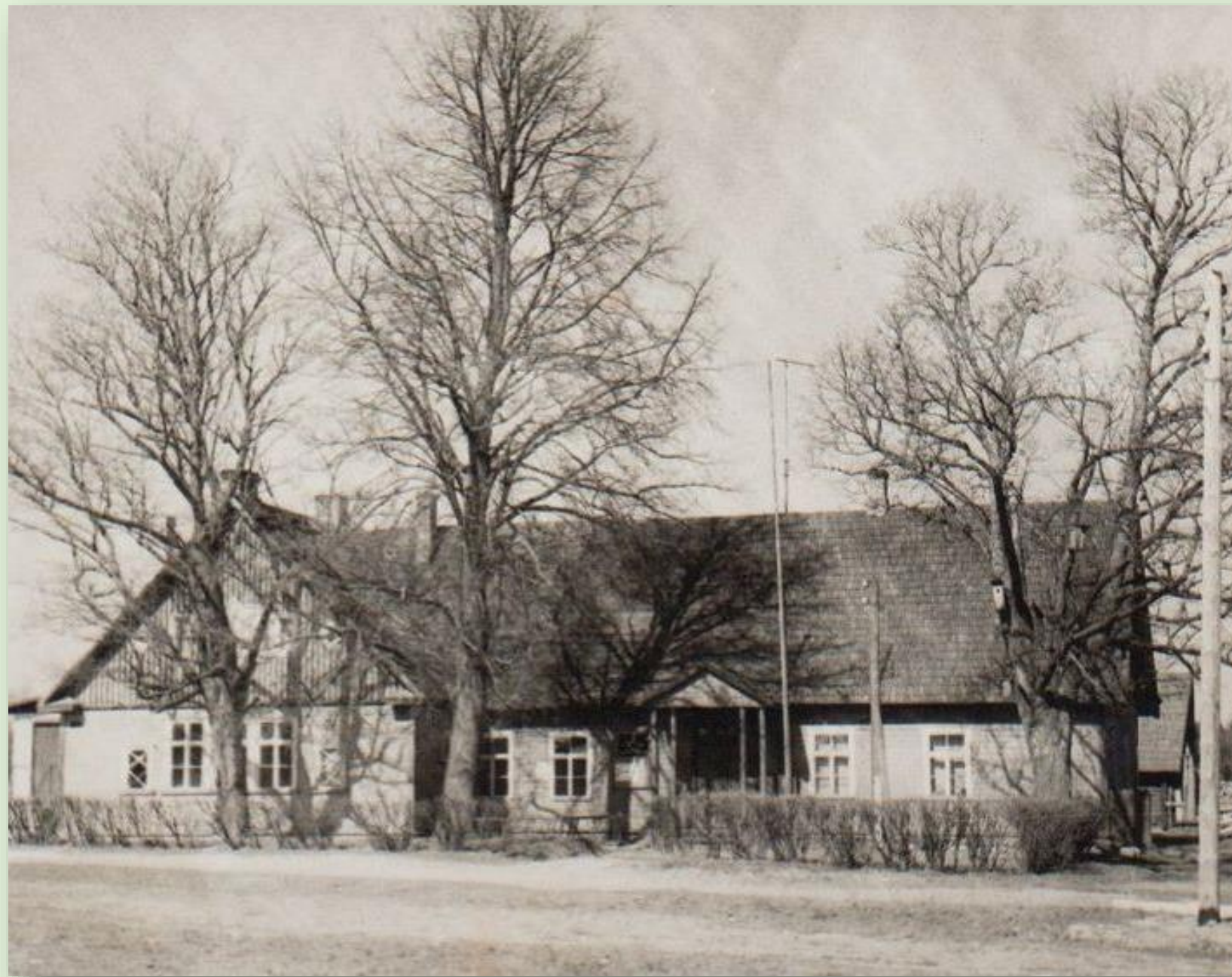
Jaanimõisa koolimaja 1966. a.

Jaanimõisa (end. Mooste vald Põlvamaa) algkool alustas tööd 1869. aastal. Algul oli see 4-, hiljem 6-klassiline algkool. Aastatel 1937/38 sai kool juurdeehituse. Kool suleti 1969. aastal.