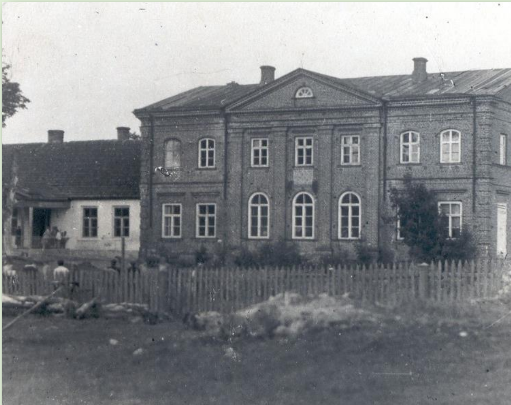
Luutsniku koolimaja 1948

Kool töötas hoones 6-, 8- ja 3-klassilise koolina. Suleti aastal 1971.