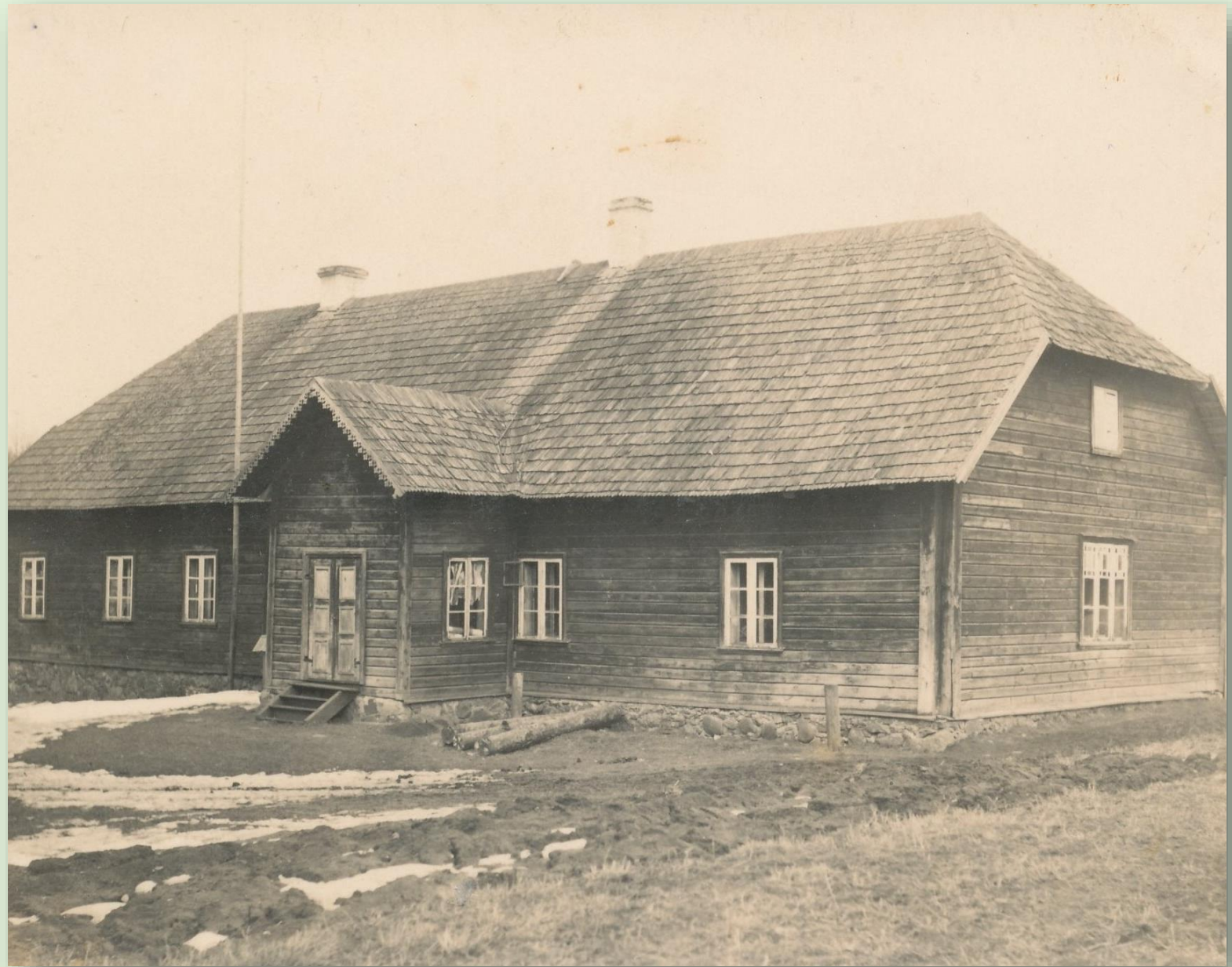
Linnamäe algkool 1940. a.