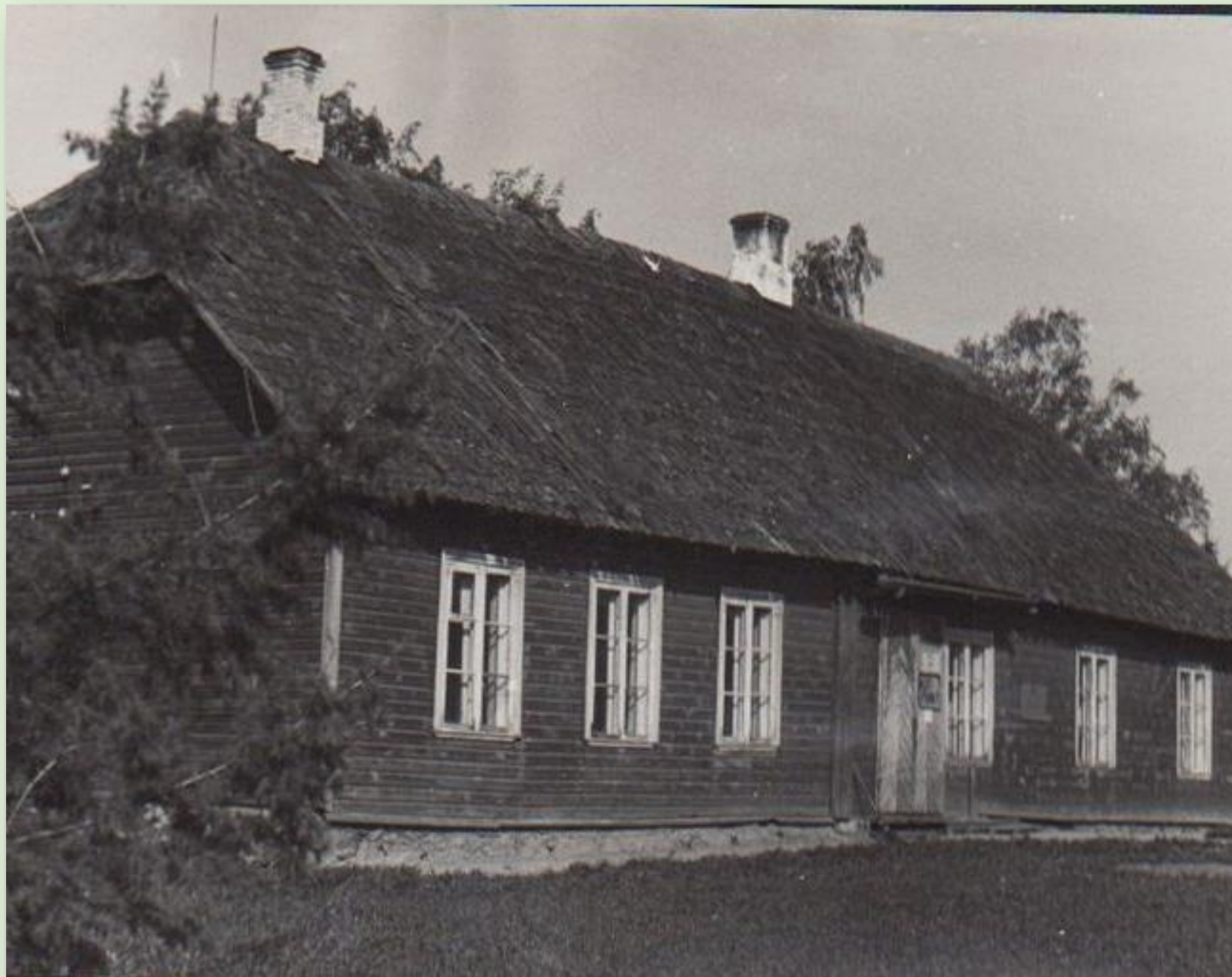
Kiuma koolimaja 1966. a.

Kiuma koolihoone ehitati aastal 1861. Varem töötas kool madalas õlgkatusega talutares. Kool oli alguses 3-klassiline, hiljem 6-klassiline algkool. 1936/37. õppeaastal töötas kool kahes hoones - koolimajas ja endises vallamajas. Kool suleti 1972. aastal. Koolimaja ei ole säilinud.