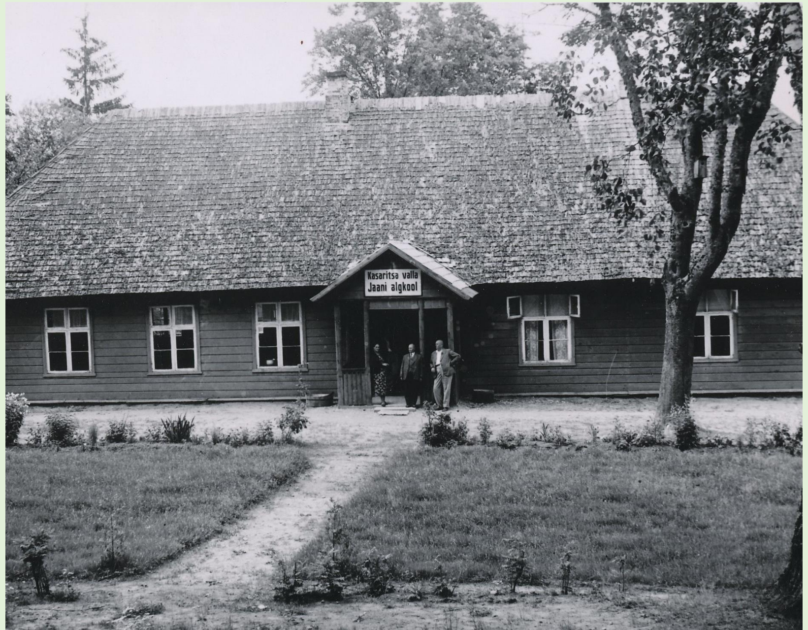
Jaani Algkool 1937. a. Võrumaa muuseumi kogust VKF_606_3