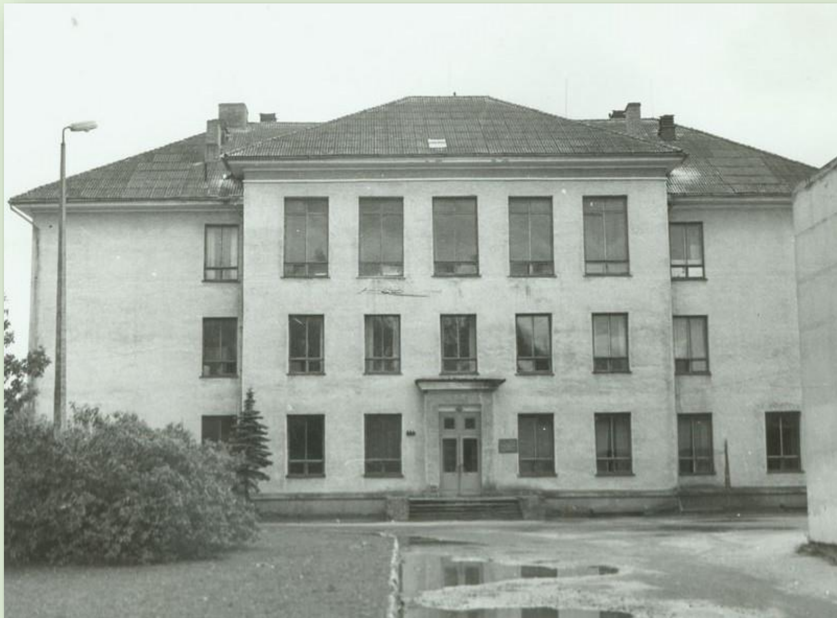
Põlva Keskkooli koolimaja 1987. a.

Põlva Keskkool asutati 1950. aastal. Aastast 1988. kandis kool Johannes Käisi nime. 1997 nimetati keskkool ümber Põlva Ühisgümnaasiumiks. 2017 lõpetas kool oma tegevuse. Põhikooli osast moodustati Põlva Kool ja linnas alustas tööd uus riigigümnaasium.