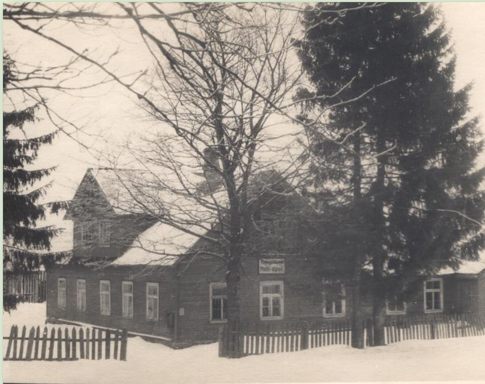
Plaani koolimaja 1949. a.

Plaani kool asutati 1872 ning suleti 1969. aastal.