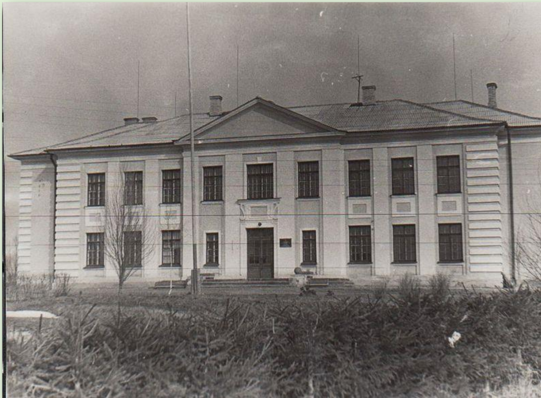
Mikitamäe koolimaja 1966

Kooli eelkäija, Usinitsa algkool, asutati 1890. aastal. Eesti Vabariigi ajal töötas see 4-klassilise algkoolina. Aastal 1912 avati uus koolimaja Mikitamäe külas ning sai nimeks Mikitamäe kool. Alates 1941. aastast töötas kool neljas eraldi asuvas hoones, kuni 1954 valmis uus koolimaja. 1989. aastal sai koolist Mikitamäe Põhikool. 2007. aastal taas Mikitamäe kooliks nimetatud kool töötab tänaseni.