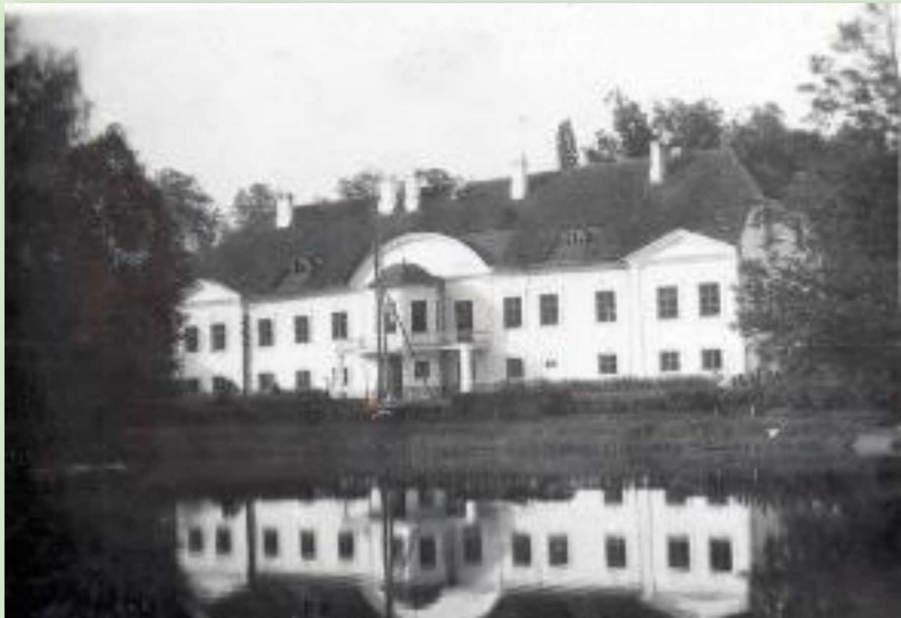
Ahja Keskkooli hoone 1966. a.

Friedebert Tuglase nimeline Ahja kool töötab tänaseni, ent uues majas. Endises mõishoones õppetööd ei toimu.