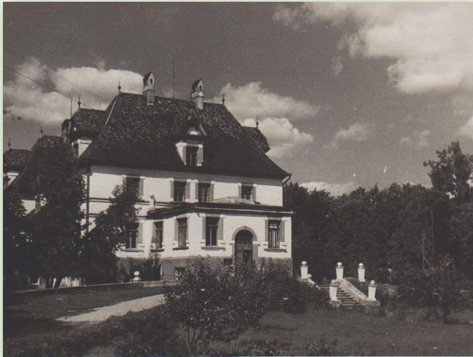
Mooste koolimaja 1966. a.