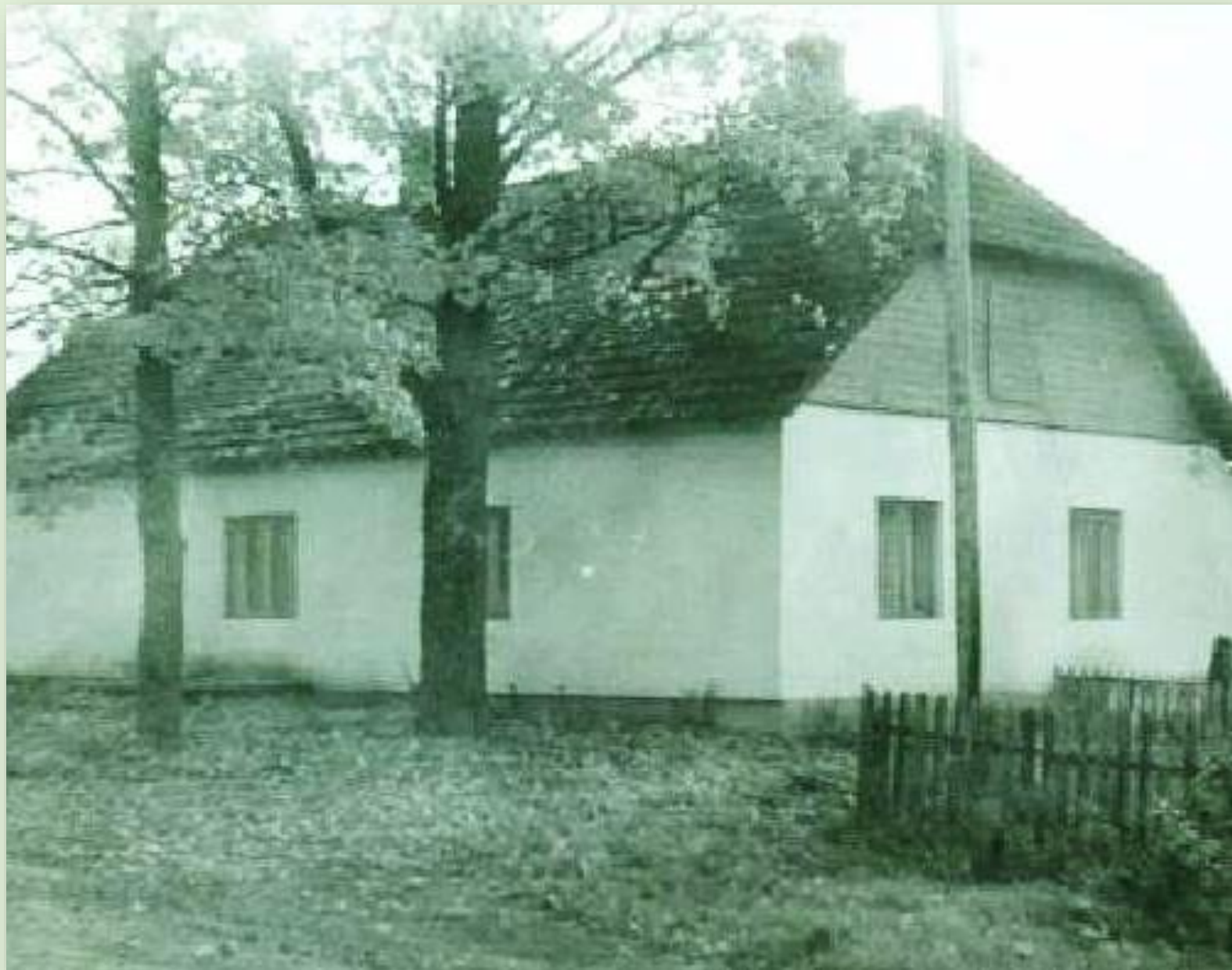
Tamme koolimaja 2010. a.

Kool asutati umbes 1851. aastal. Esimesed koolimajad olivat asunud Kiltre talus praeguse Valgjärve vallamaja läheduses. Sama Kiltre talu maa peale olivat ehitatud ka üks õige väikene koolimaja. Uus koolimaja on ehitatud 1893. aastal. Peale 1920. aastat Tamme kool suleti ja avati uuesti alles 1929. aastal. Hiljem ühendati Tamme kool Piigaste kooliga. Kool on suletud.