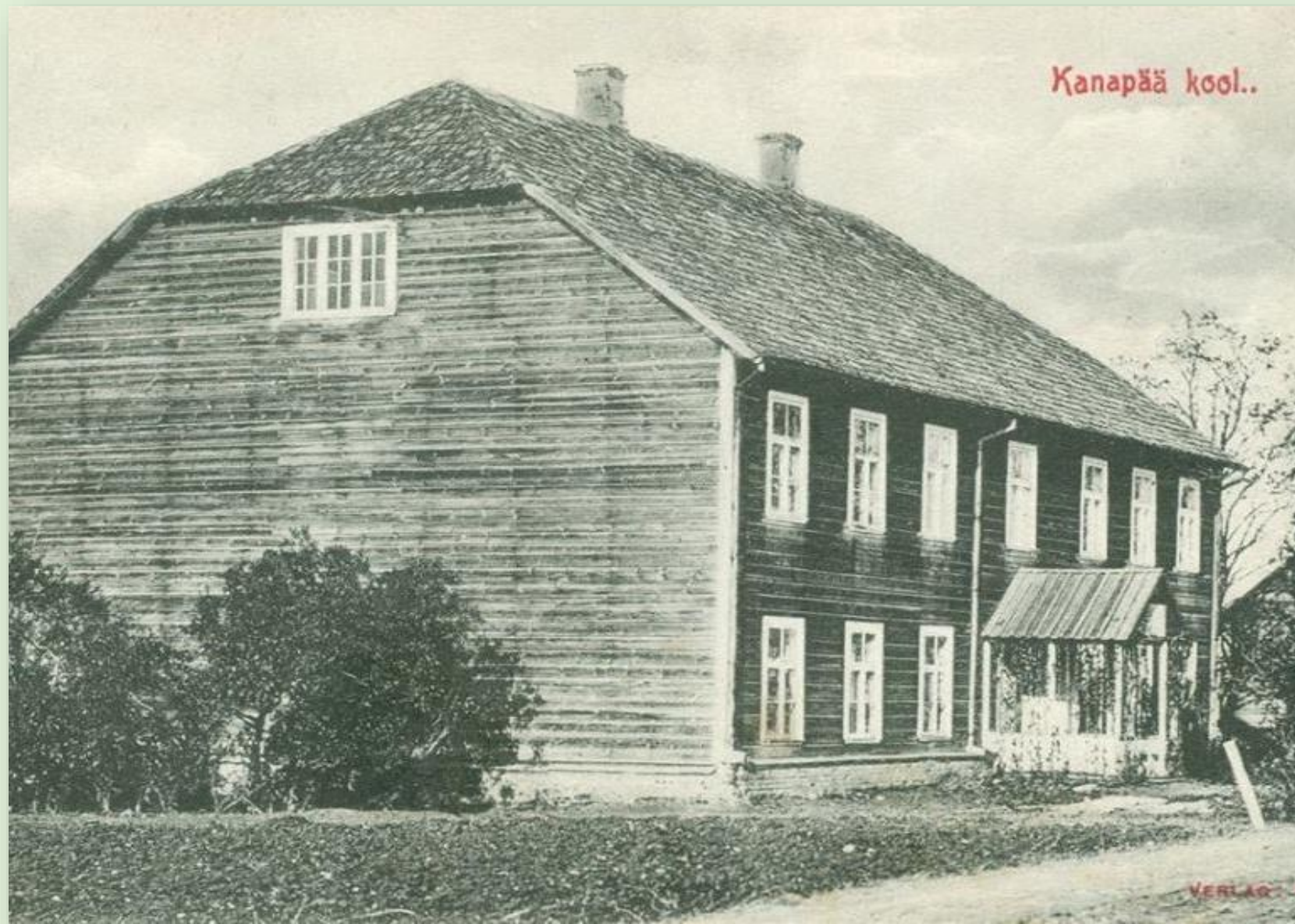
Kanepi koolimaja 1927. a. Karilatsi Vabaõhumuuseumi kogust PTM F 33:1/F17-1

Koolimaja hävis tulekahjus 27. aprillil 1928.