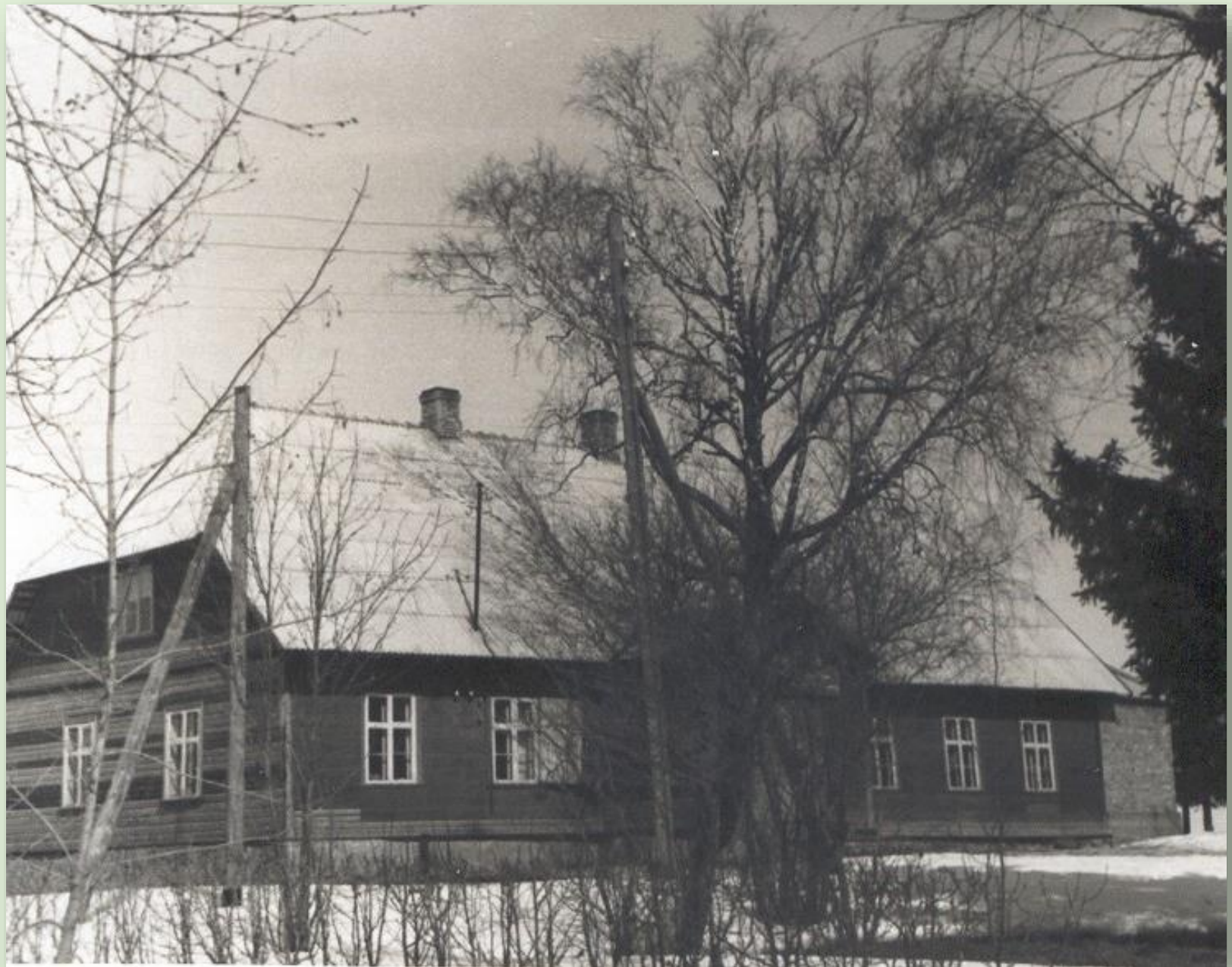
Navi koolimaja 1948. a.

Uuendatud koolimaja õnnistati 2. novembril 1889. Kool suleti 1969. aastal.