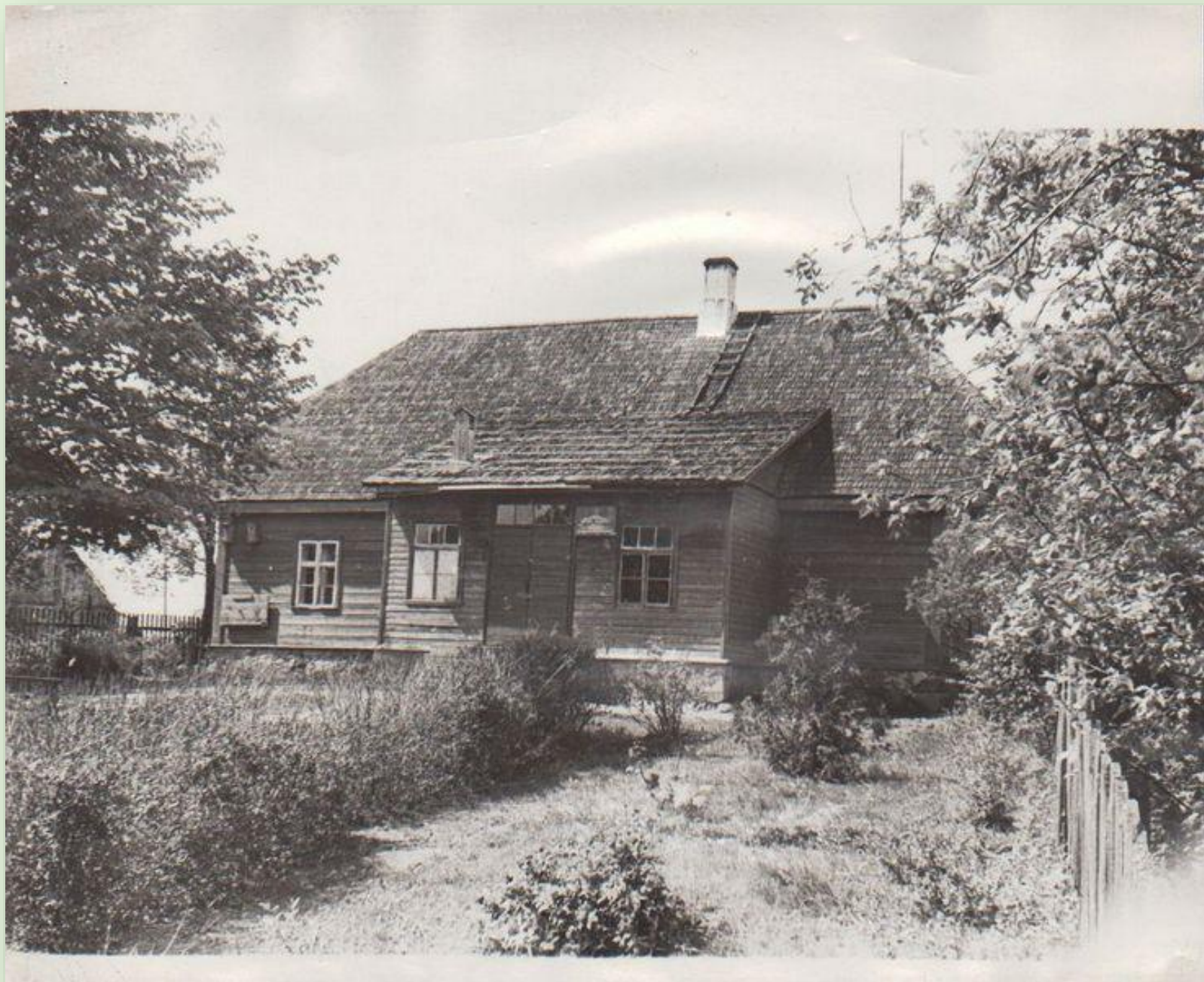
Rõsna koolimaja 1966. a.