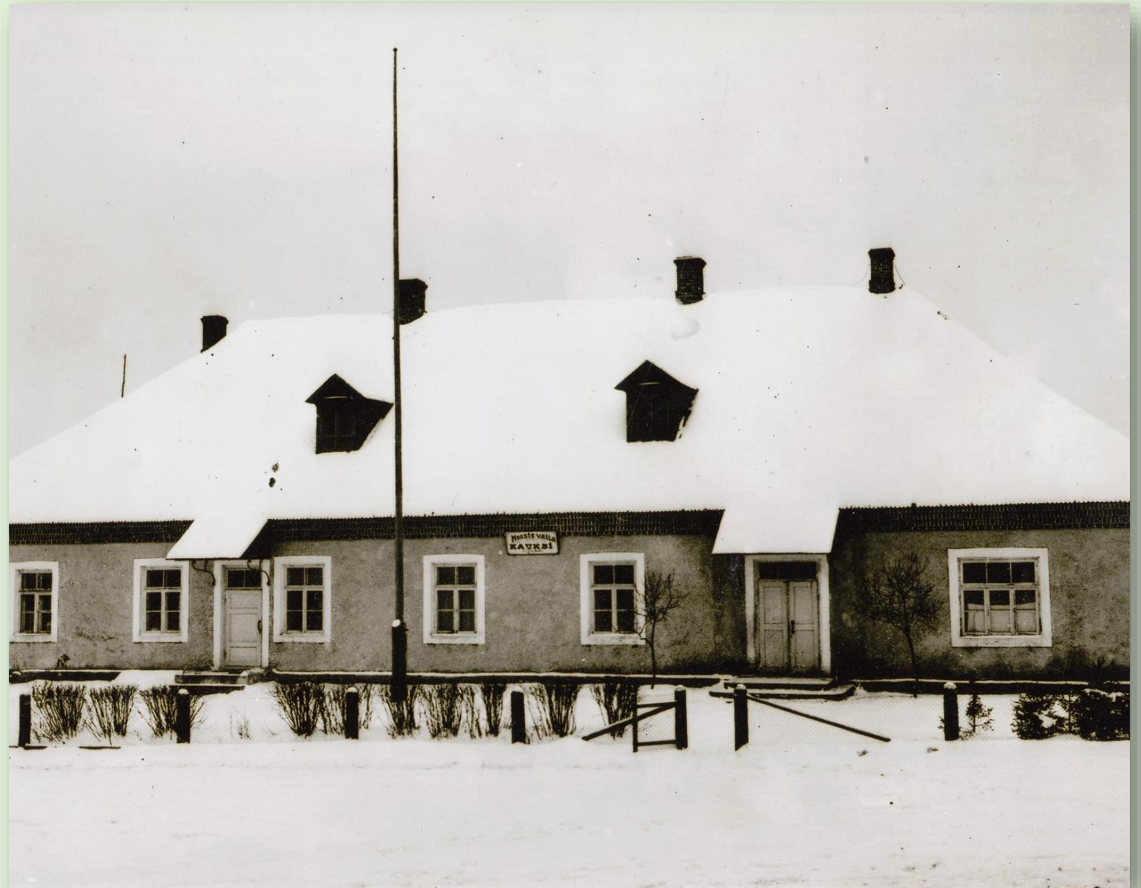
Kauksi koolimaja 1938. aastal.

Kauksi kool töötab tänaseni endise Orava talu ümberehitatud elumajas.