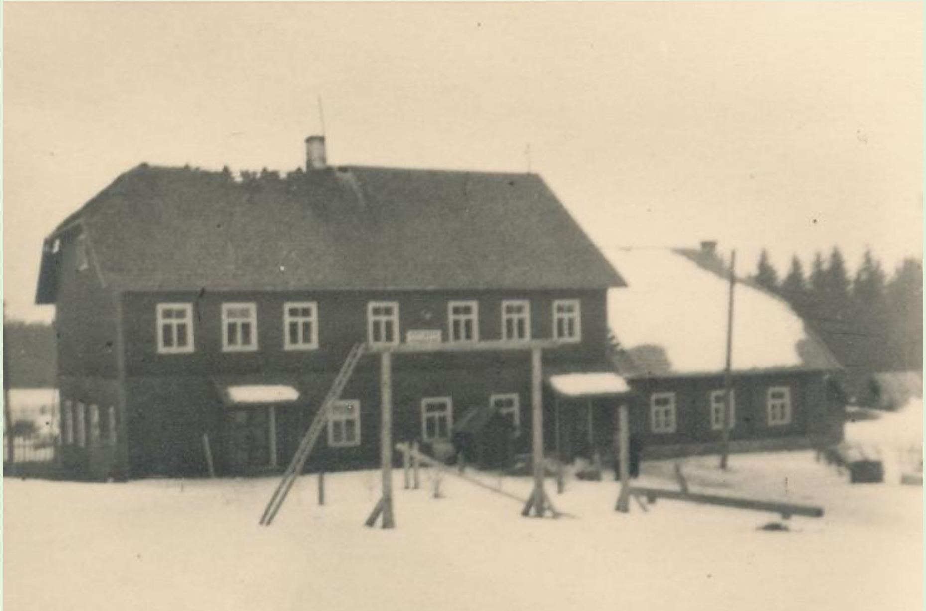
Kärgula algkooli hoone 1944. a. Võrumaa muuseumi kogust VK F 646:3 F

Kärgula kool asus Kärgula vallas, hiljem Sõmerpalu vallas. Koolimaja hävis 1944. aastal. 1960. aastatel ehitati uus koolimaja Sulbile, kuid kandis endiselt Kärgula kooli nime. Kool suletud.