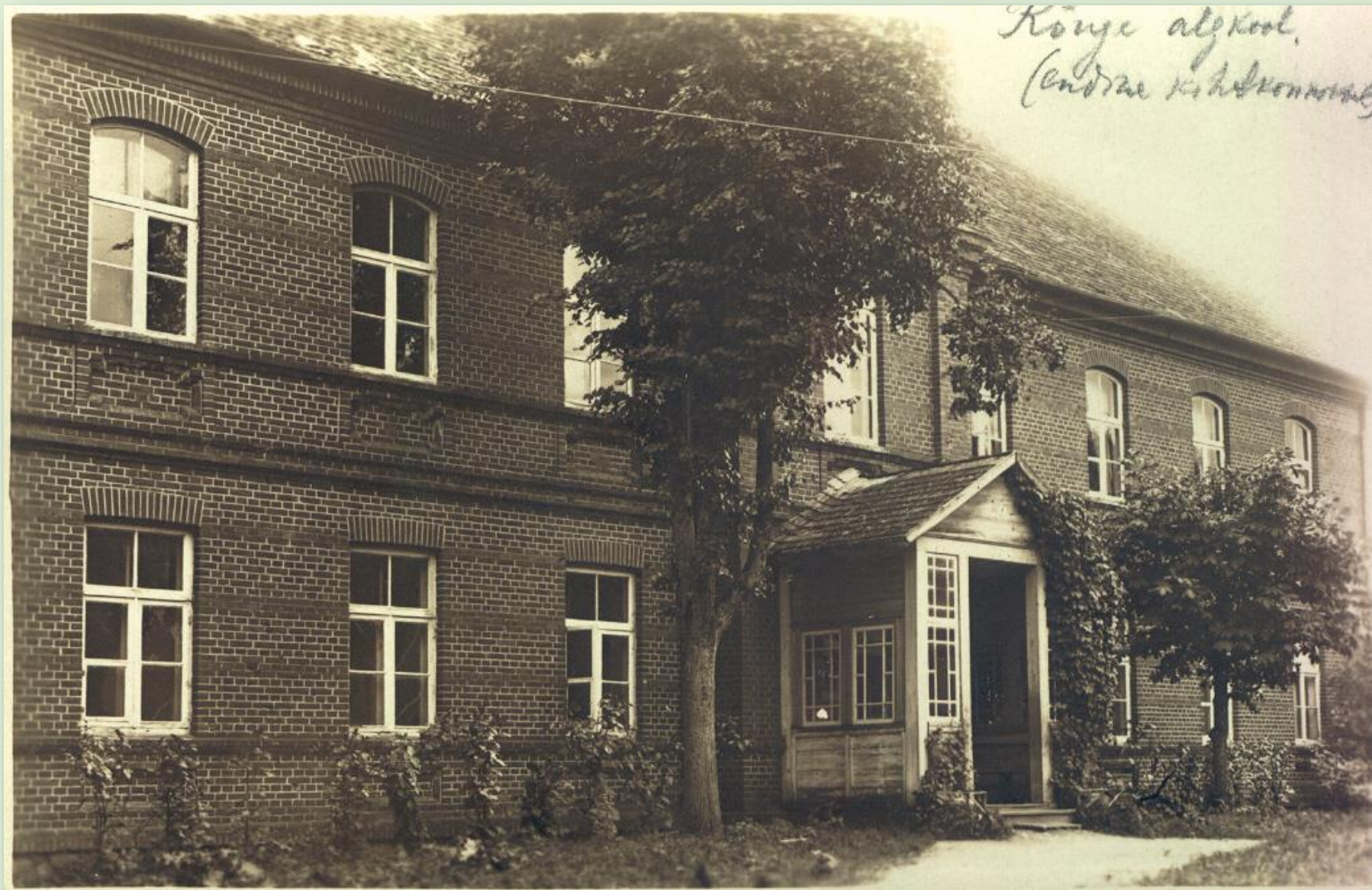
Rõuge Algkooli hoone Võrumaa muuseumi kogust VK F 31:1 F

1870. aastal ehitas Rõuge vald Jaanipeebule uue koolimaja. 1879. aastal tegi vald koolimajale juurdeehituse. Kui kool viidi üle endise kihelkonnakooli punastest tellistest majja, kasutati Jaanipeebu koolimaja koolmeistrite kortermajana. Eesti Vabariigi ajal liideti Jaanipeebu kool Rõuge kõrgema algkooliga. Kooli nimeks sai Rõuge valla 6-klassiline algkool. Praeguseks renoveeritud punastest telliskividest koolimaja sai 1966. aastal juurdeehituse. Kool töötab tänaseni kandes nime Rõuge Põhikool.