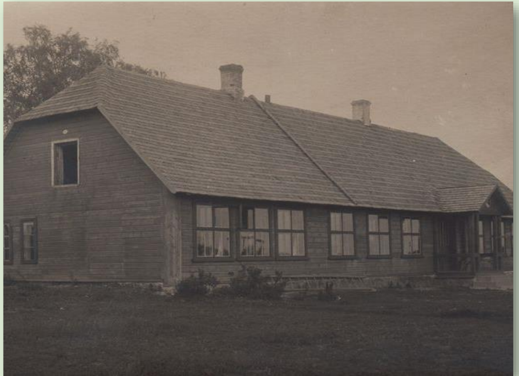
Karilatsi koolimaja 1926. a. PTM F 79:5/F13-70

Karilatsi algkool suleti 1972. aastal, koolimaja on praegu Karilatsi Vabaõhumuuseumi peahoone.