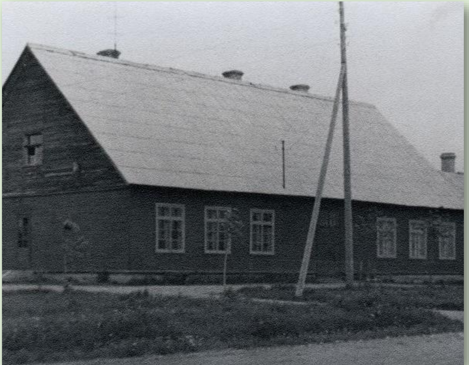
Lepassaare koolimaja 1966. a.

Koolina alustas tööd 1960. aasta jaanuaris.