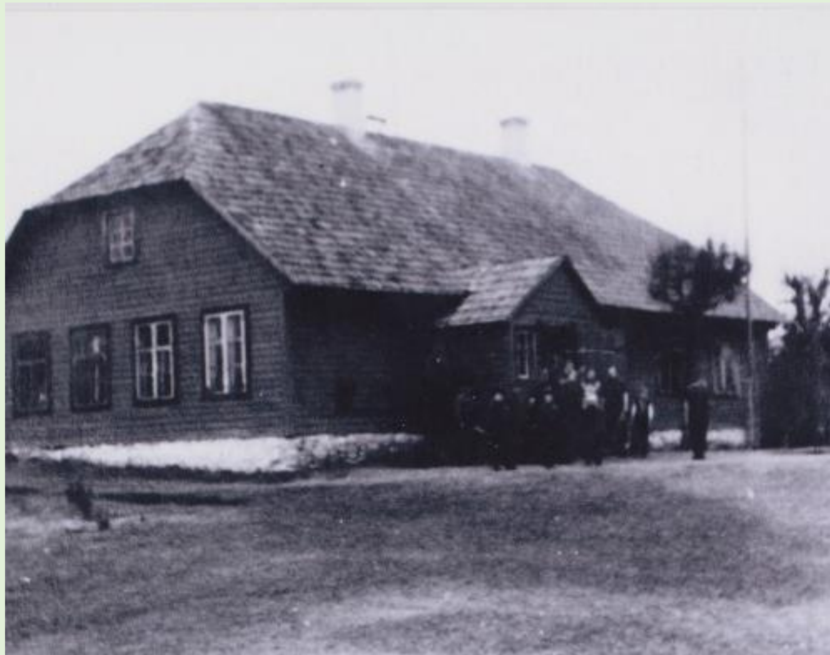
Vana-Piigaste algkool 1954. a.

1956 valmis Savernas uus koolihoone, kuhu koliti ka Vana-Piigaste kool.