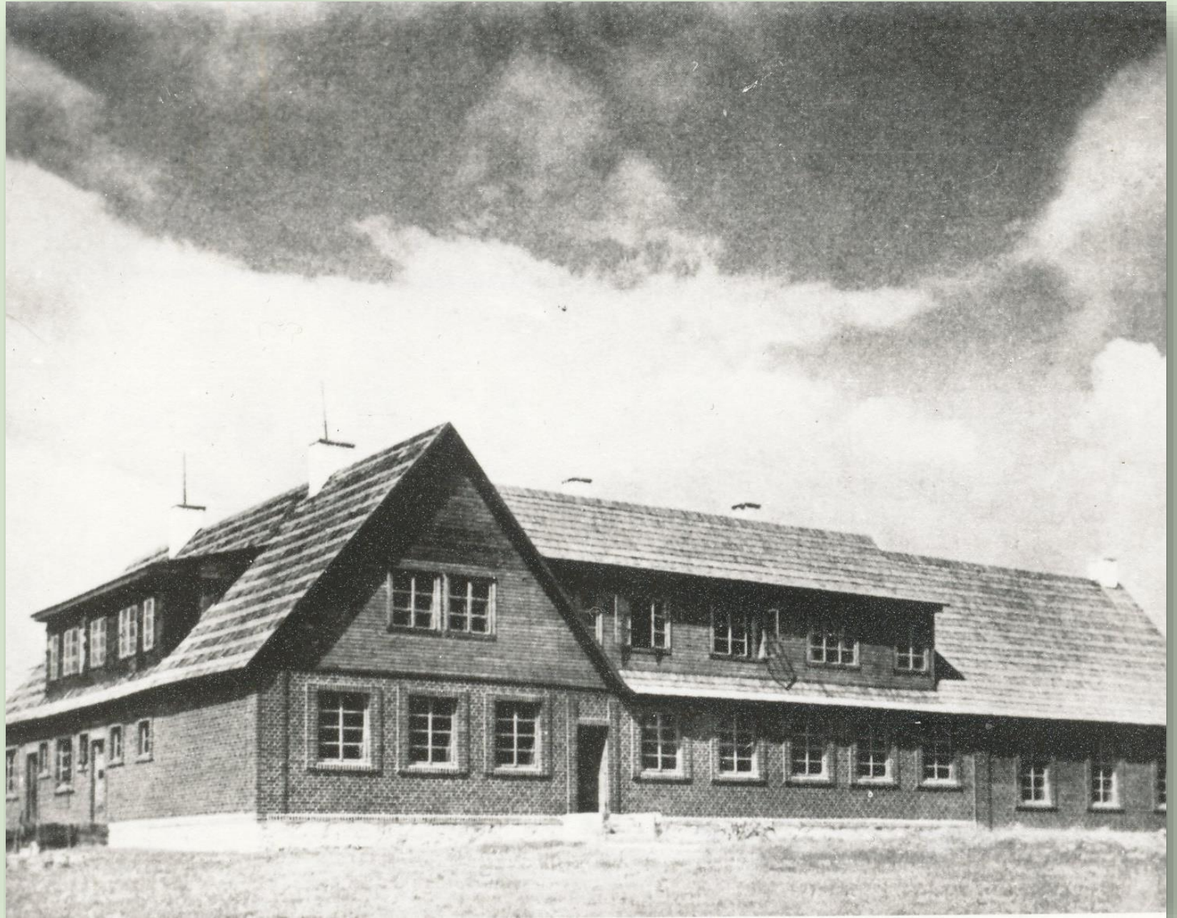
Ristemäe algkool 1937. a.