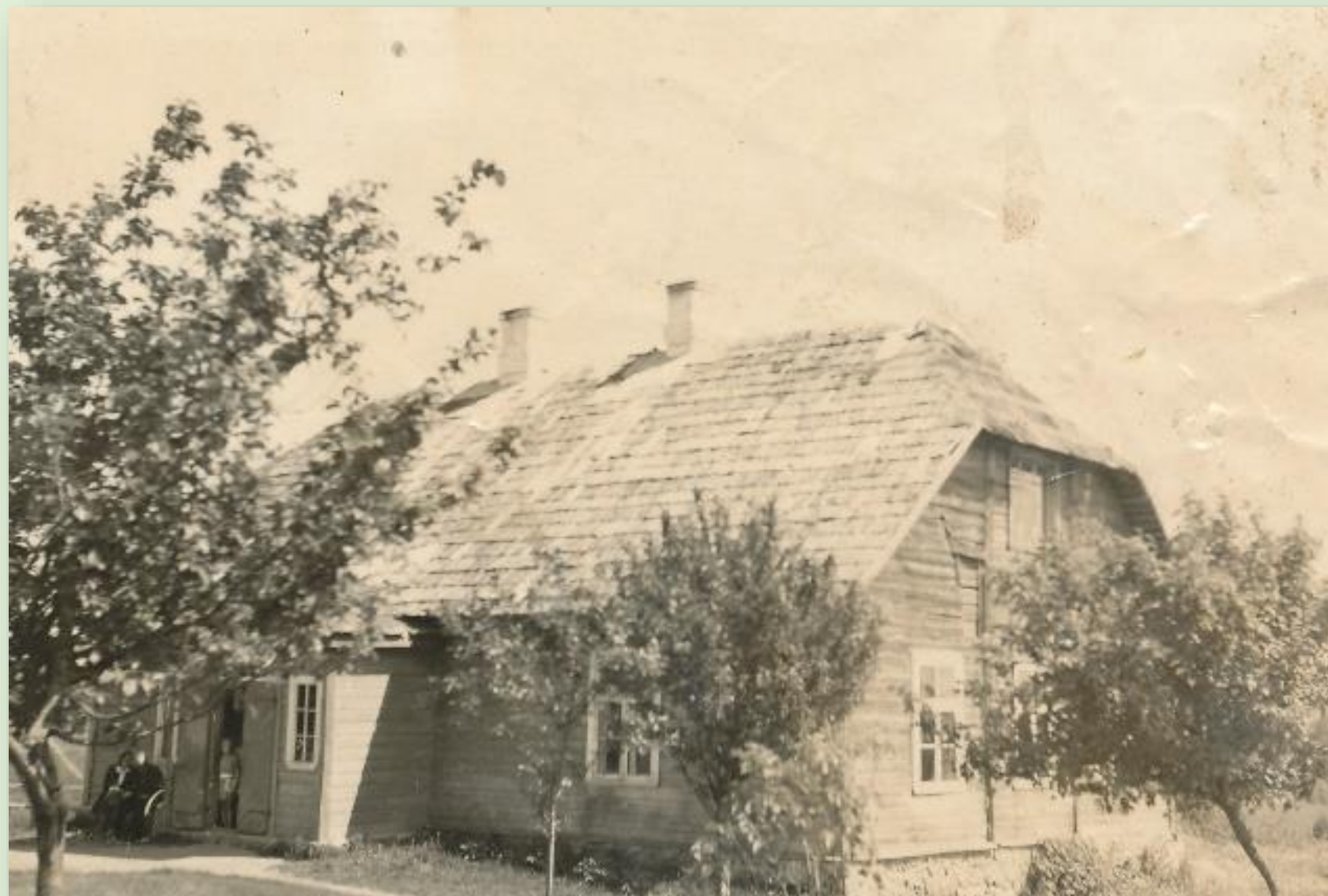
Siksali koolimaja 1940-1960. a.