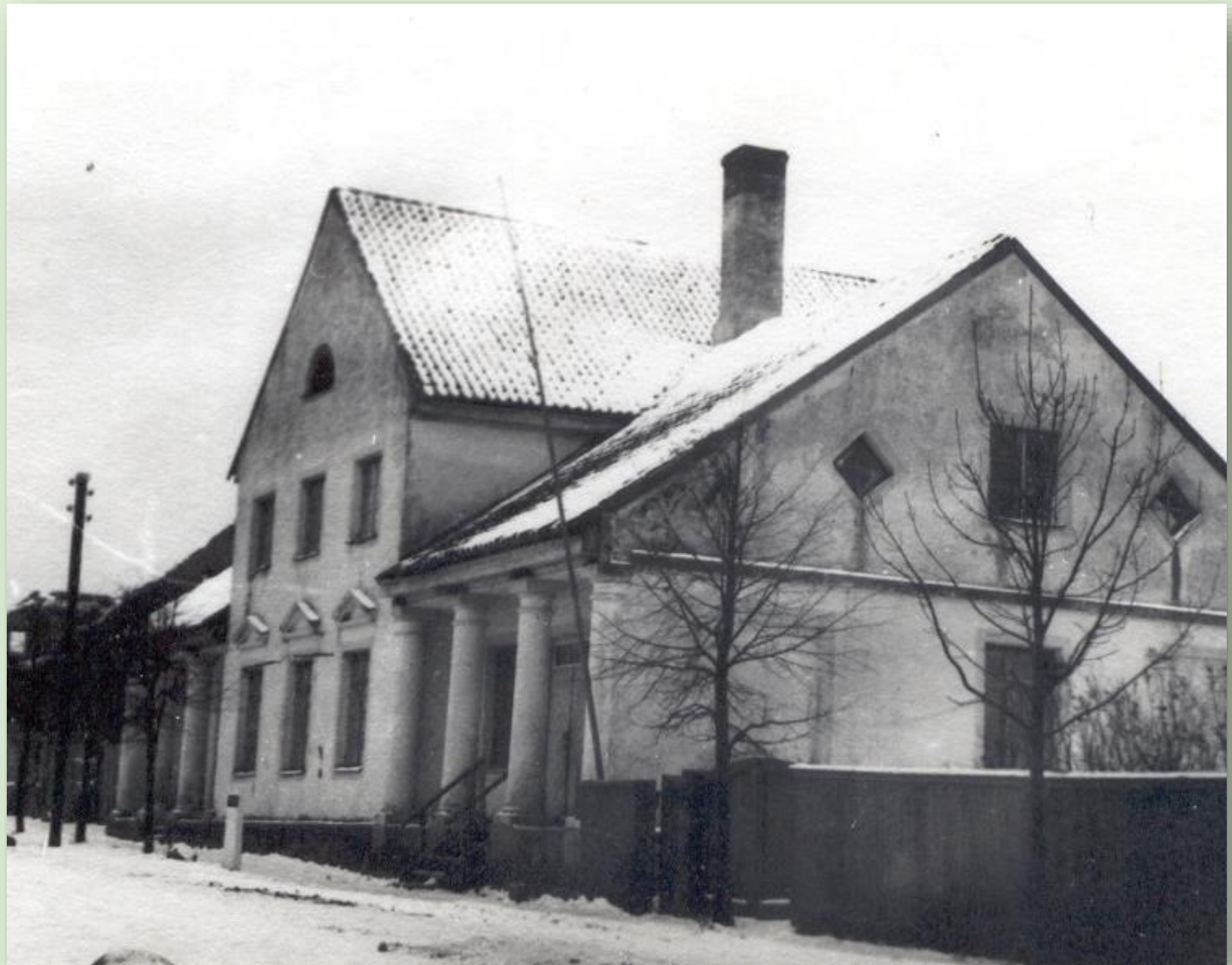
Võõpsu Algkool 1948. a.