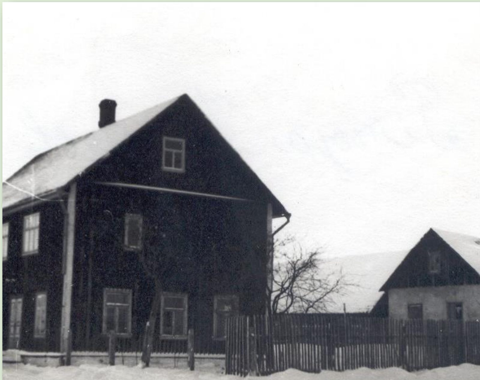
Piiroja koolimaja 1949. a.

Pildilolevas hoones töötas Piiroja 7-klassiline kool.