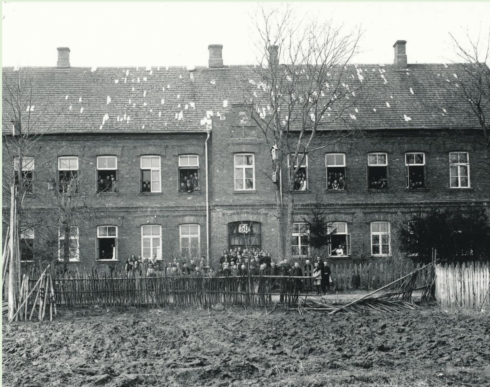
Lepistu algkool 1935. a.

1881. Asutatud Lepistu vallakool suleti 2008. aastal.