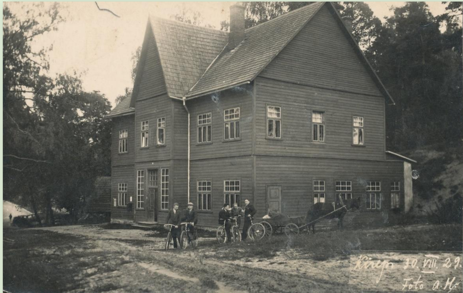
Kirepi koolimaja 1929. a. Autor: O. Haidak Võrumaa muuseumi kogust VKF237_1F1_71_1

Selles hoones Verijärve kaldal asus Kasaritsa valla Kirepi algkool, millest pärast ületoomist sai Võru III 7-klassiline kool.