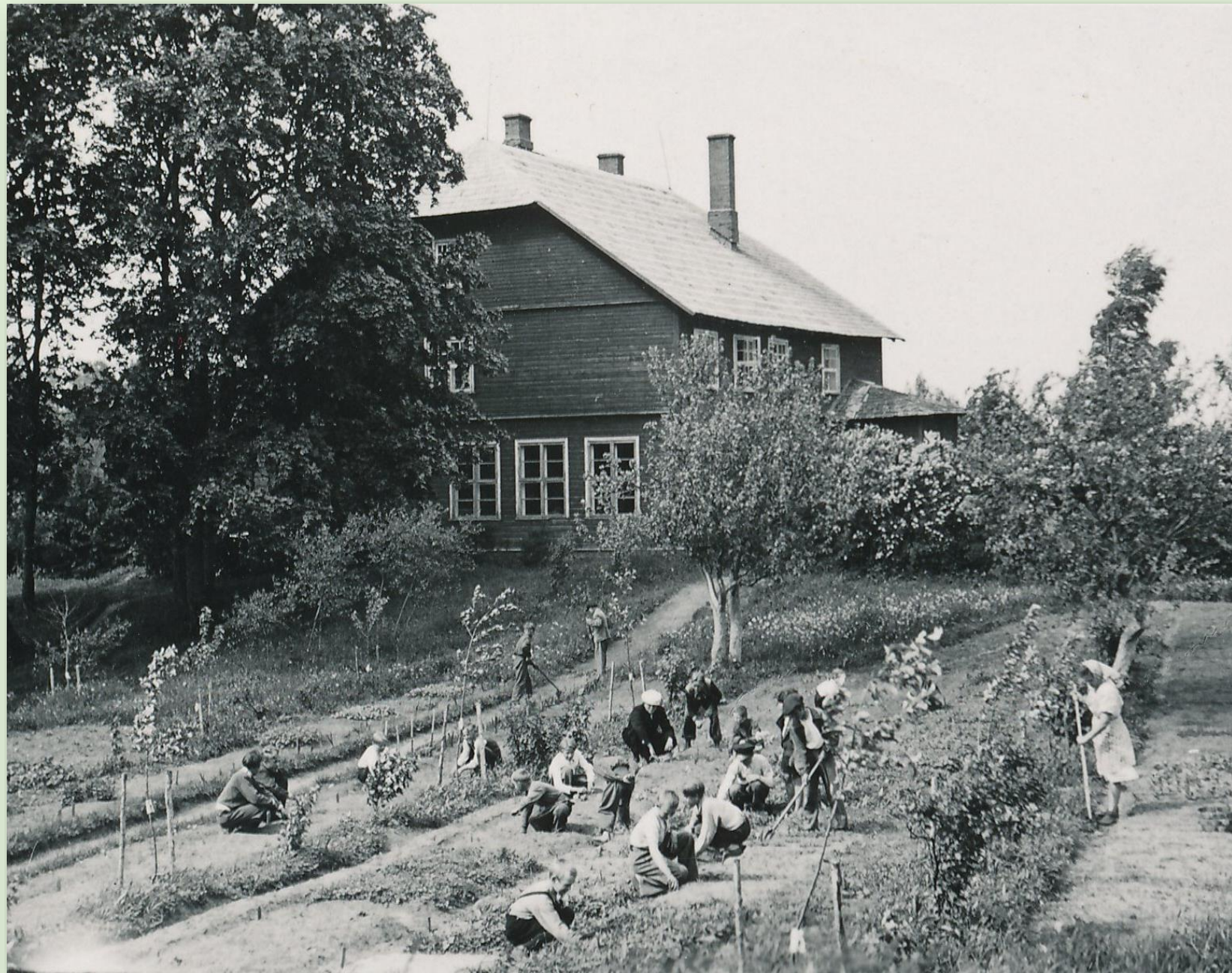
Kolepi koolimaja 1951