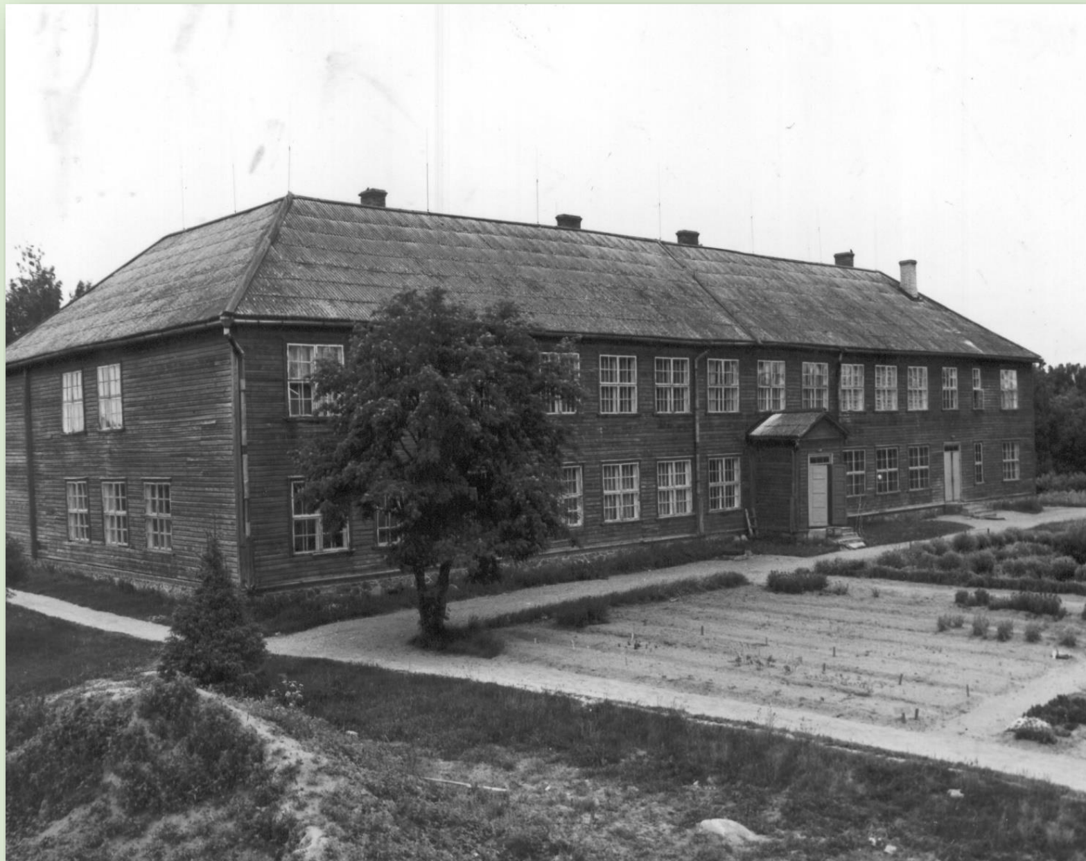
Osula koolimaja 1984. a.

Kui 1760. aastatel alustati siin laste õpetamist, oli Osula ja selle ümbrus jagatud mitme mõisavalla vahel. Lilli vald asutas oma kooli Reinomäel ja Mustja vald Kivi talus. 1866 hakkasid Sõmerpalu, Lilli ja Peetrimõisa lapsed õppima Prassi koolis ning 1877 Mustja ja Järvere lapsed Vaskaare koolimajas. 1890. aastatel ühendati need vallad Sõmerpalu vallaks (vallamajaga Osulas). Aastateks 1919-1921 koolid ühendati ja viidi Sõmerpalu härrastemajja, kuid toodi sealt 1922. aastal tagasi vanadesse koolimajadesse. 1925 valmis Kalmetmäel uus koolihoone ning 1994 koliti omakorda uude majja. Osula kool töötab tänaseni.