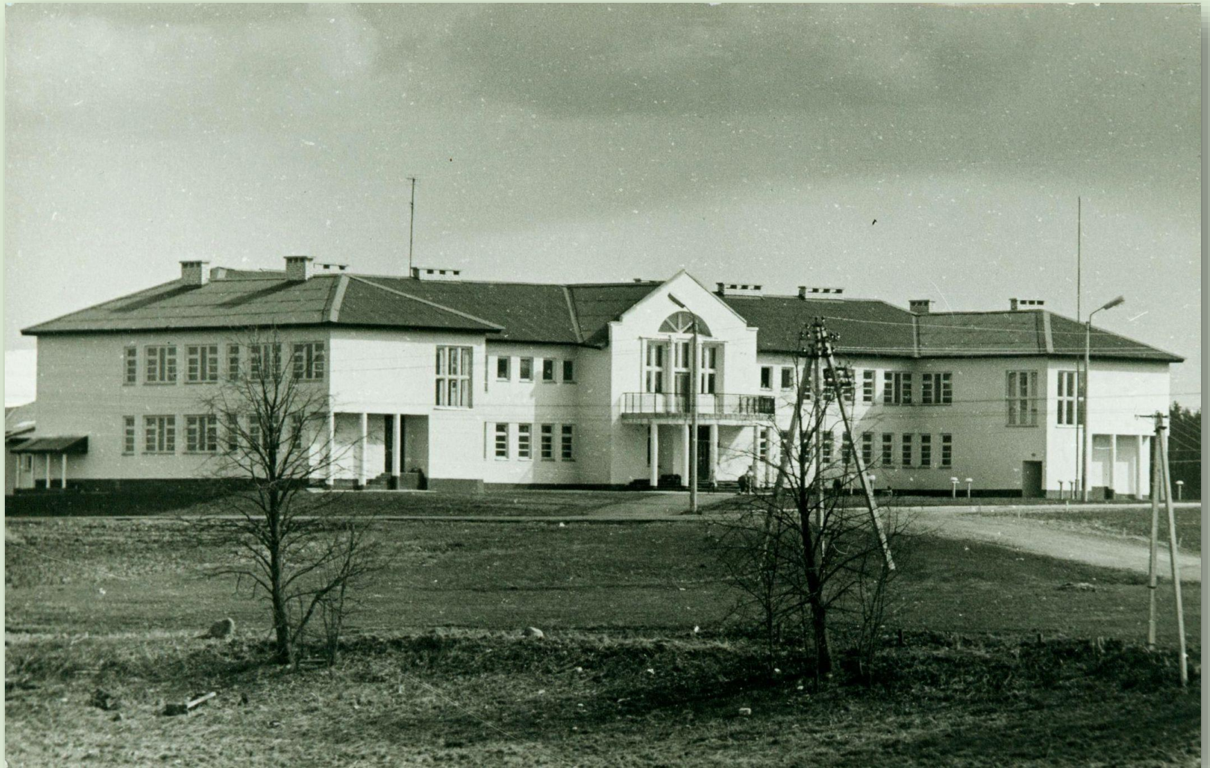
Krootuse koolimaja 1989. a.

Karaski kool tegutses aastani 1989, mil Krootusel valmis uus koolimaja. Asulasse uude koolihoonesse kolimisega seoses sai kool nimeks Krootuse Põhikool. Kool töötab tänaseni.