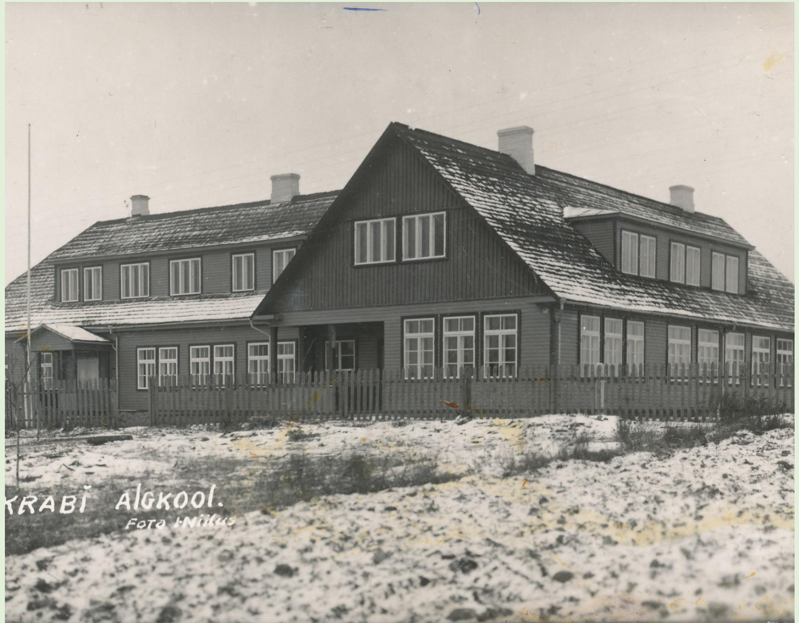
Krabi algkool.

Suleti 2014. aastal, kui kooli oli jäänud 4 õpilast. Samal aastal alustas ruumides tööd erivajadustega laste erakool.