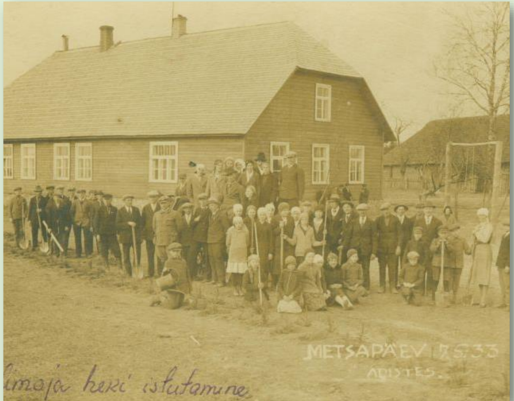
Adiste koolimaja 1933. a. Autor: A. Ivask

Adiste kool oli olemas juba 18. sajandi alguses. 1900 ehitati uus koolimaja, ehitusmeistriks oli Karl Kals. Hoone lõunapoolses osas oli klassiruum, muus osas koolmeistri eluruumid ja abiruumid. 1920. aastal muudeti seni 3-klassiline kool 4-klassiliseks. 1929 rajati kooliaed. Aastal 1930 muudeti kool 6-klassiliseks ning 1944 mittetäielikuks keskkooliks, kus 3 klassikomplektis õppis 73 last. 1965. aastal kool suleti, sest õpilasi oli vaid 7.