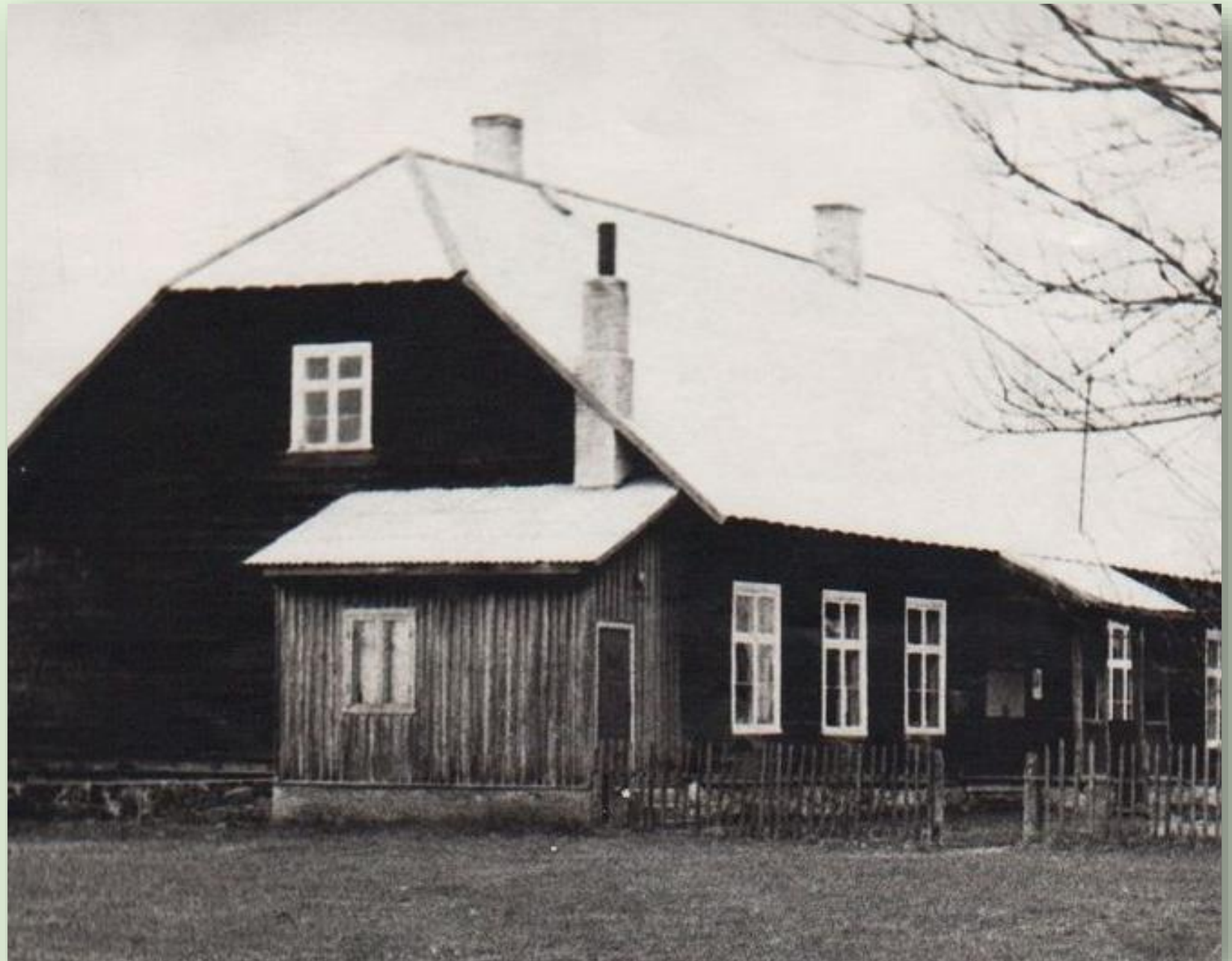
Kooraste algkool 1966. a.

1880. aastal ehitati Koorastesse uus koolimaja, mis on tänaseni säilinud.