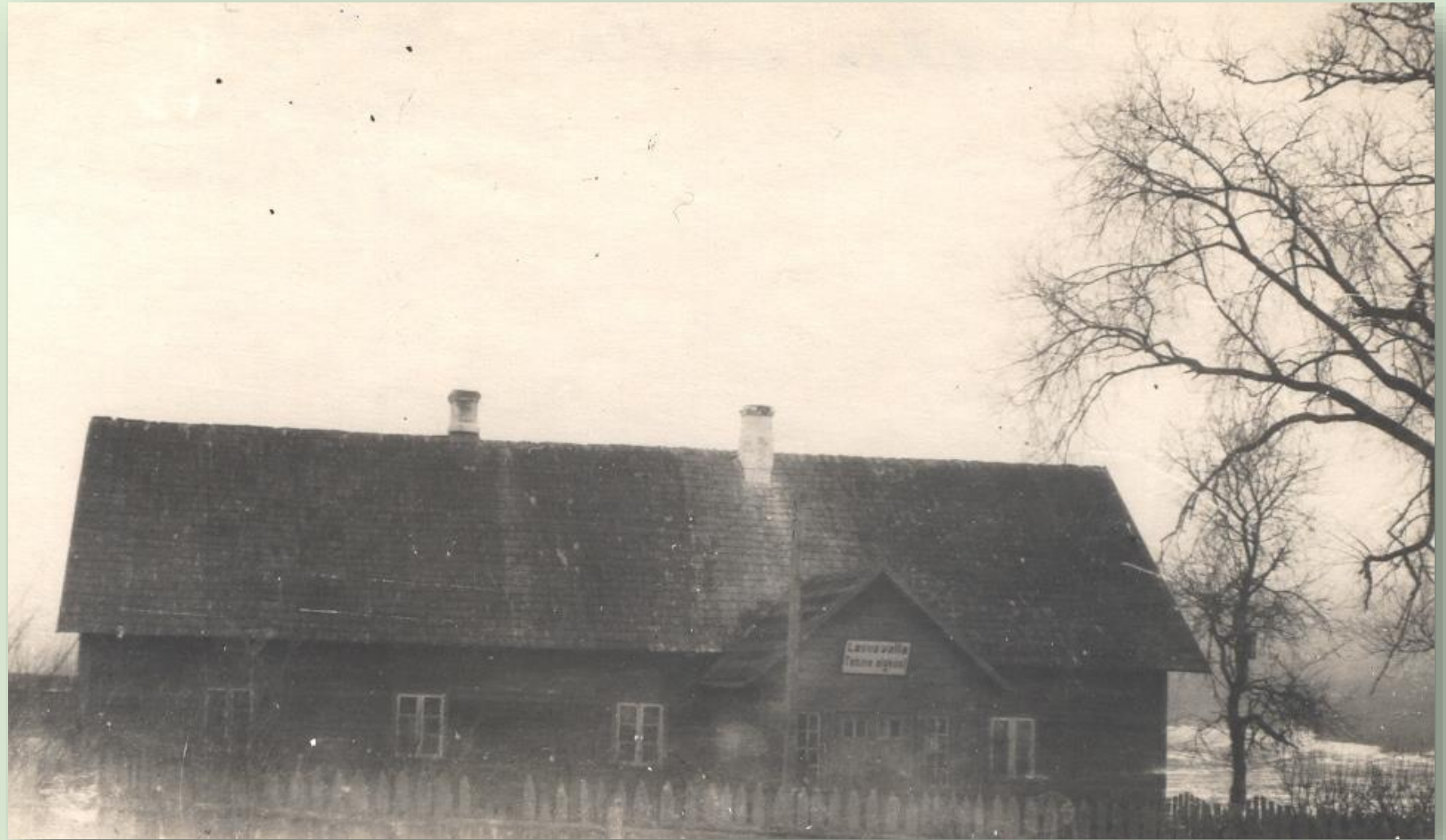
Tabina algkool 1948. a.

Tabina algkool asus Lasva vallas Võrumaal. Kooli asutamise aeg on teadmata, kuid on teada, et tänaseni säilinud vana koolimaja kohal oli omal ajal väike onnike, kus lapsi õpetati. 1860. aastal ehitatud koolimajas toimus õppetöö kuni 1902. aastani, mil ehitati uus koolimaja. Kool on suletud.