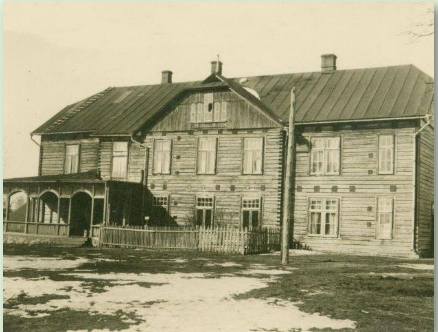
Leevi koolimaja 1929. a.