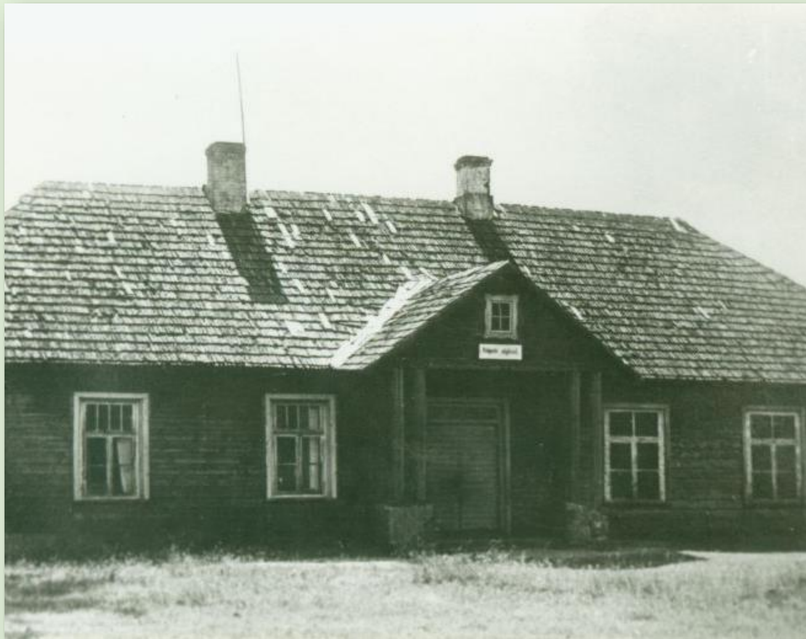
Põlgaste vana koolimaja 1940. a.

Põlgaste algkool asutati 1879. aastal. Enne uue koolimaja valmimist aastatel 1920-30 töötas Põlgaste algkool 1873. aastal ehitatud vallakooli hoones ning osa klasse paiknesid Põlgaste vallamajas. Uus koolimaja valmis 1937. aastal.