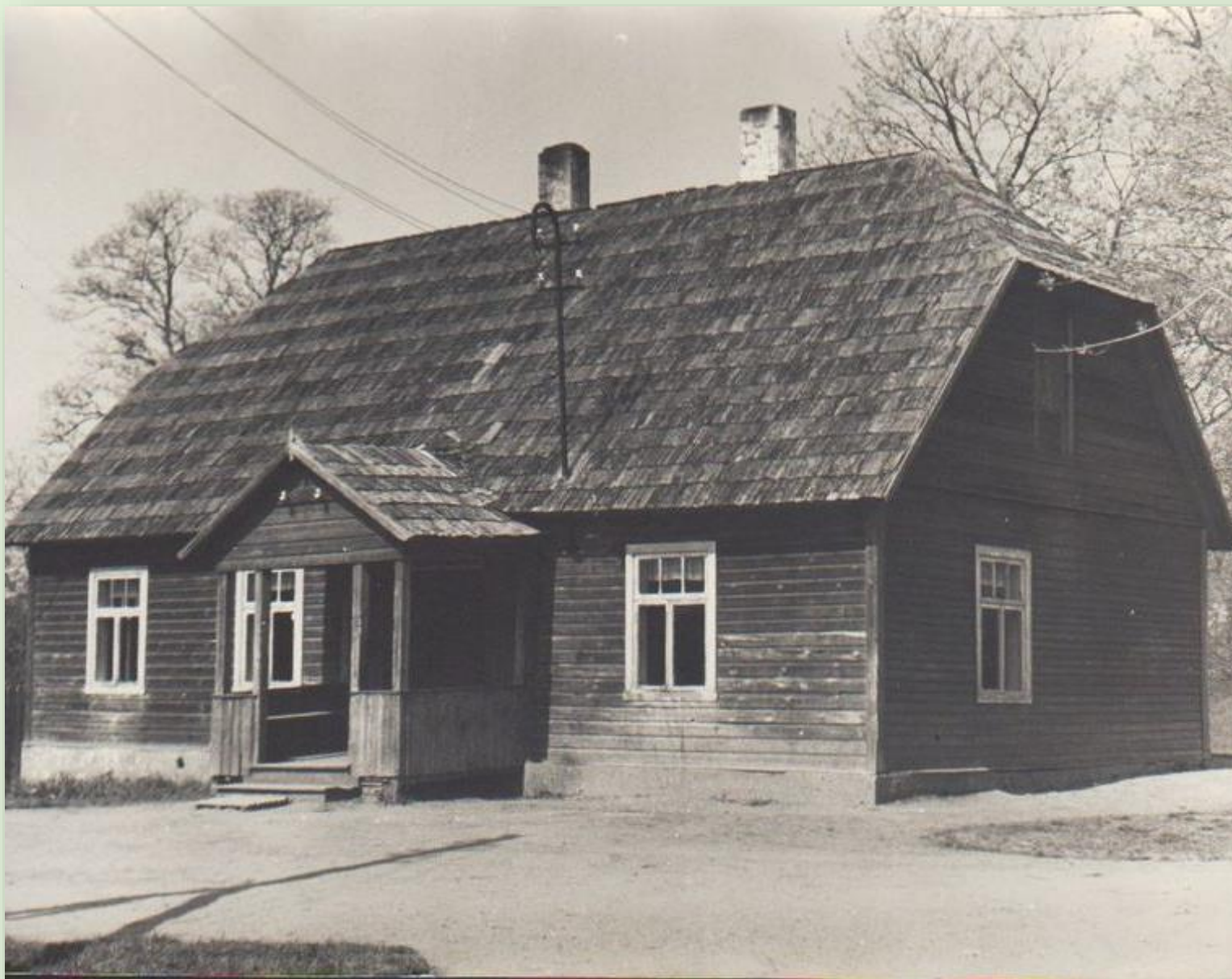
Vana-Koiola koolimaja 1966. a.

Kool alustas tööd 1826. aastal endises Vana-Koiola rendimõisa hoones. Alguses töötas kool 1 komplektilise 4-klassilise algkoolina. Hiljem oli kool 6-klassiline algkool, siis 7-klassiline mittetäielik keskkool ja seejärel taas 6-klassiline algkool. Kool suleti 2010. aastal.