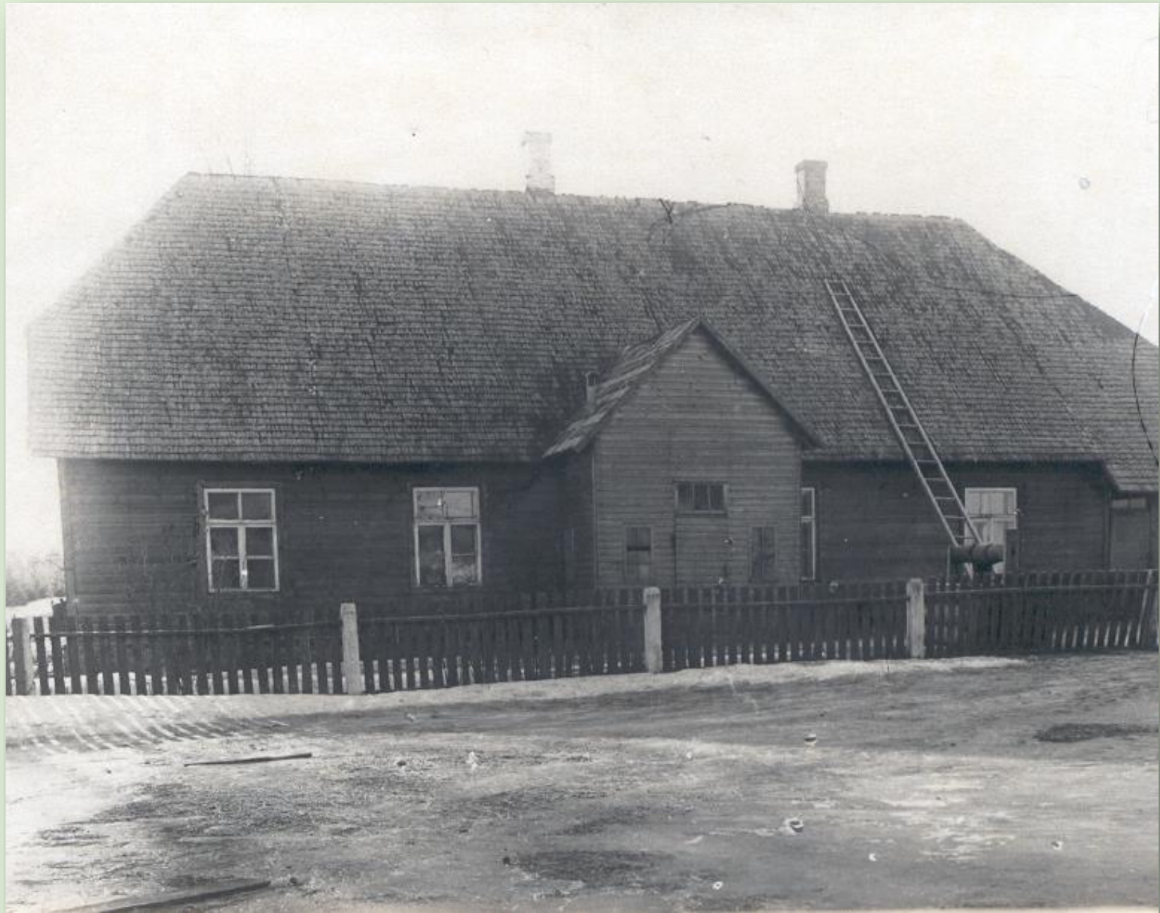
Vanaküla algkool 1948. a.