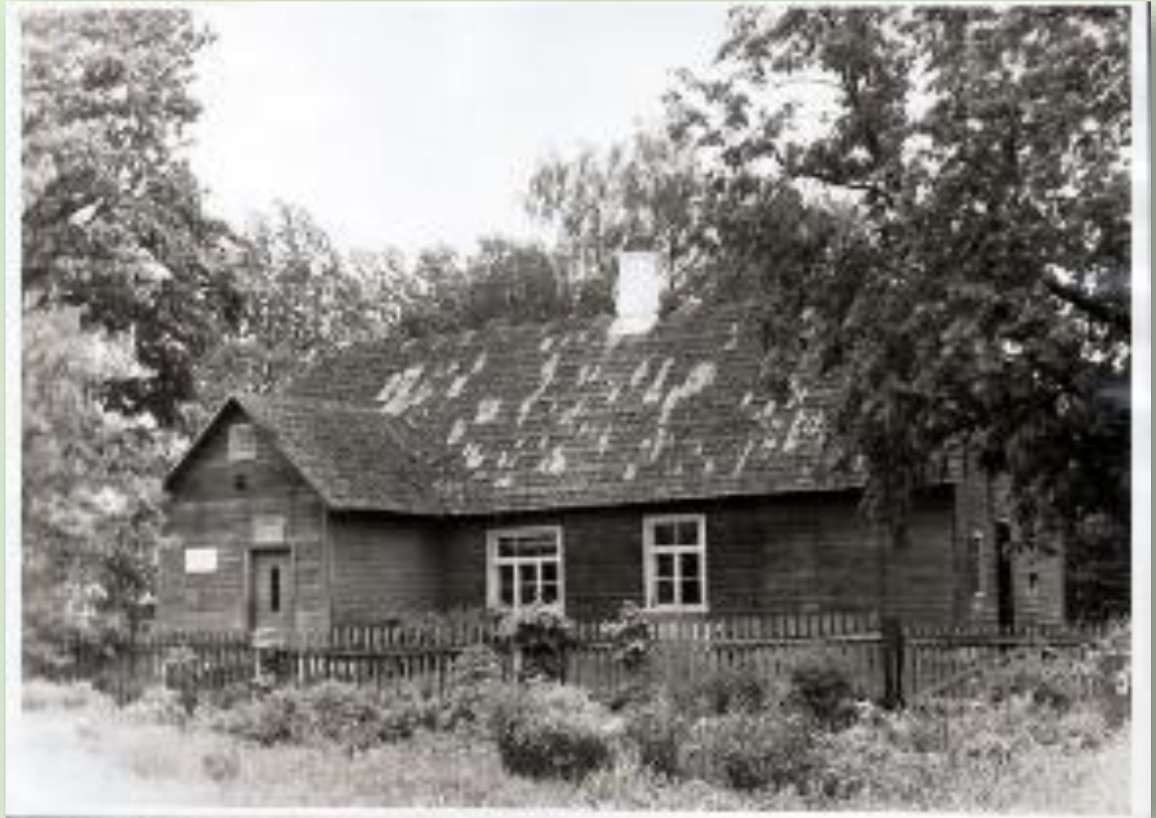
Krootuse vana koolimaja

Krootuse vana koolimaja põles maha 8. veebruaril 1880 suure tormi ajal. Osade allikate andmetel ehitati uus koolimaja üles veel samal, teistel andmetel aga 1887. aastal. Tõenäolisem on siiski esimene daatum, sest Krootuse valla maksujaotuse protokollidesse on 1886-1887 kantud 92 rbl kulutusi koolimaja ümbertegemise, mitte ehitamise eest. Krootuse algkool suleti 1974. aastal. Hiljem on hoonet kasutatud peamiselt elamuna.