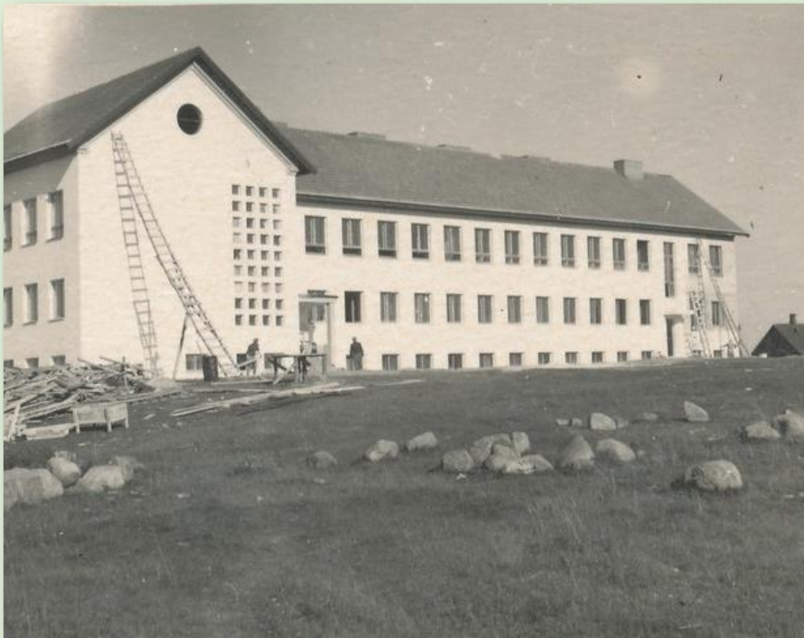
Loosi koolimaja 1949. a.