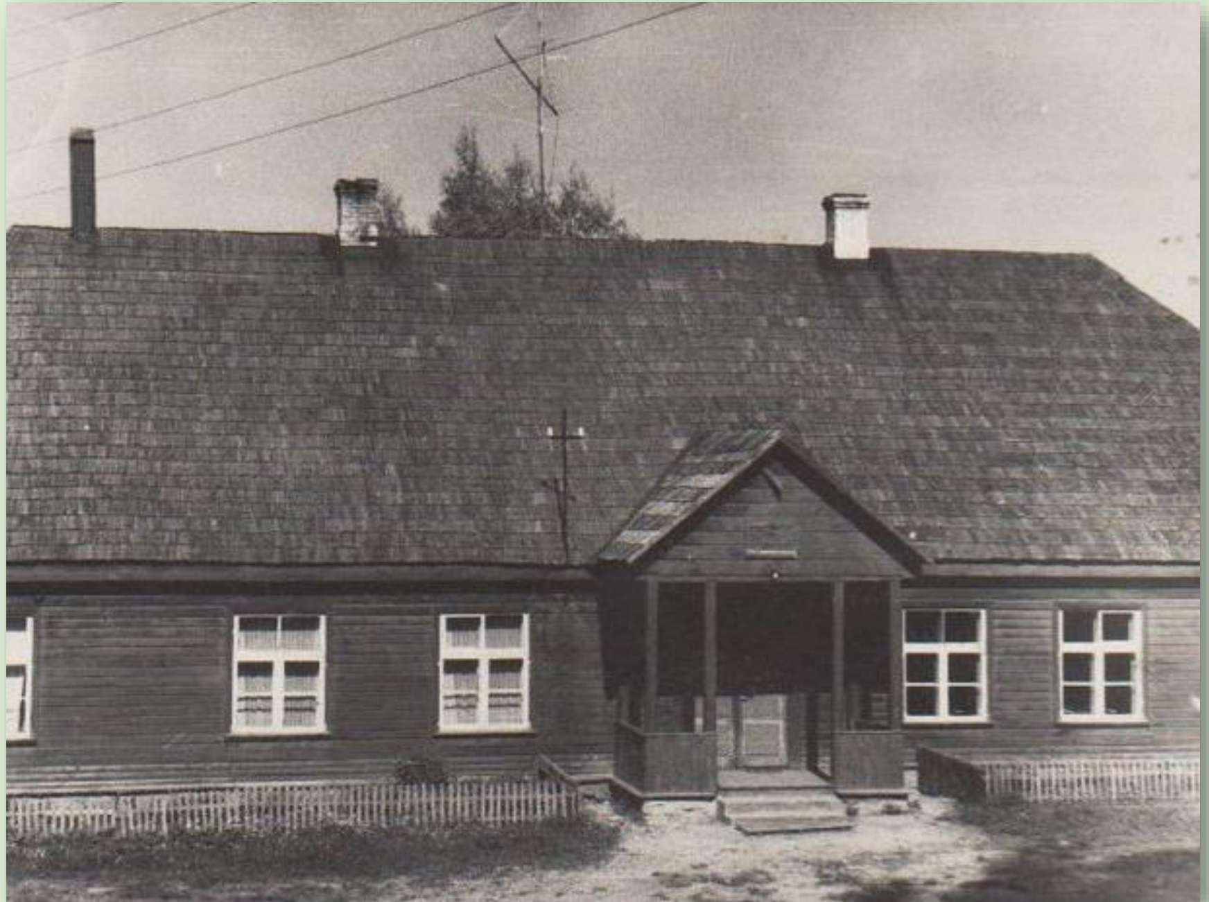
Himmaste koolimaja 1966. a.

Himmaste kool suleti 2013. aasta kevadel. 2014. aastast haldab koolihoonet MTÜ Rosma Haridusselts.