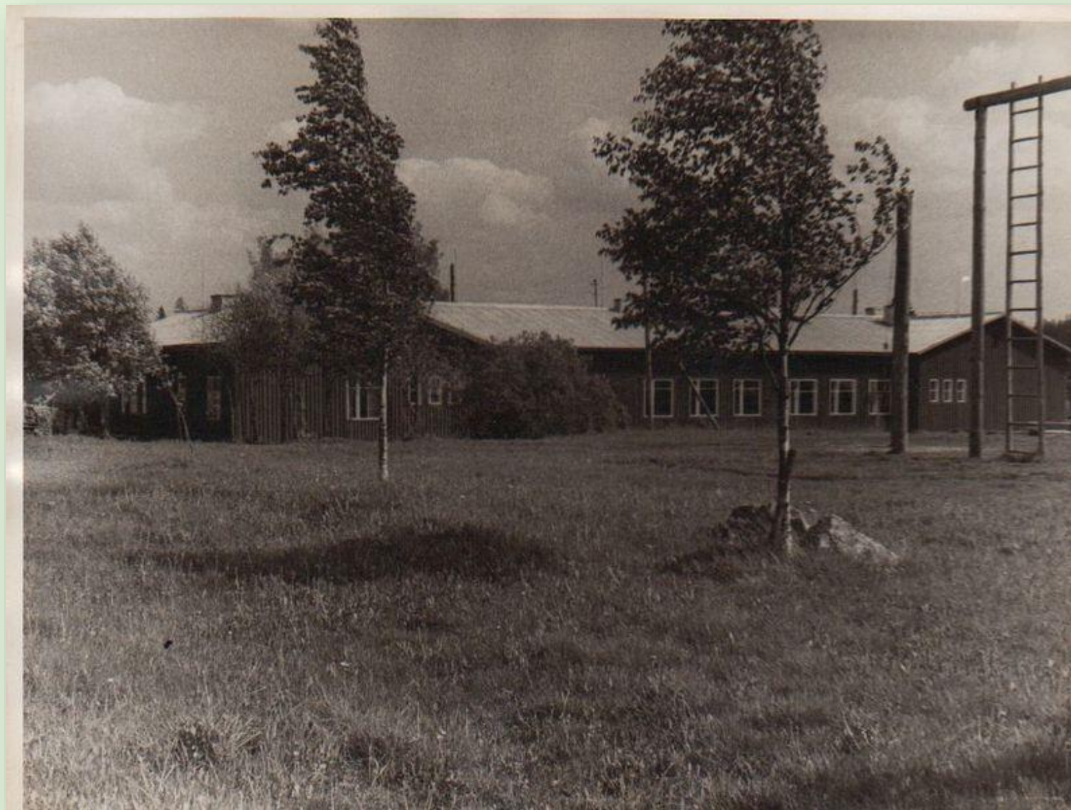
Kauksi koolimaja 1966. a.

Kauksi kooli uueks asupaigaks sai endine Orava talu, mille ümber ehitatud elumajas töötab kool tänaseni.