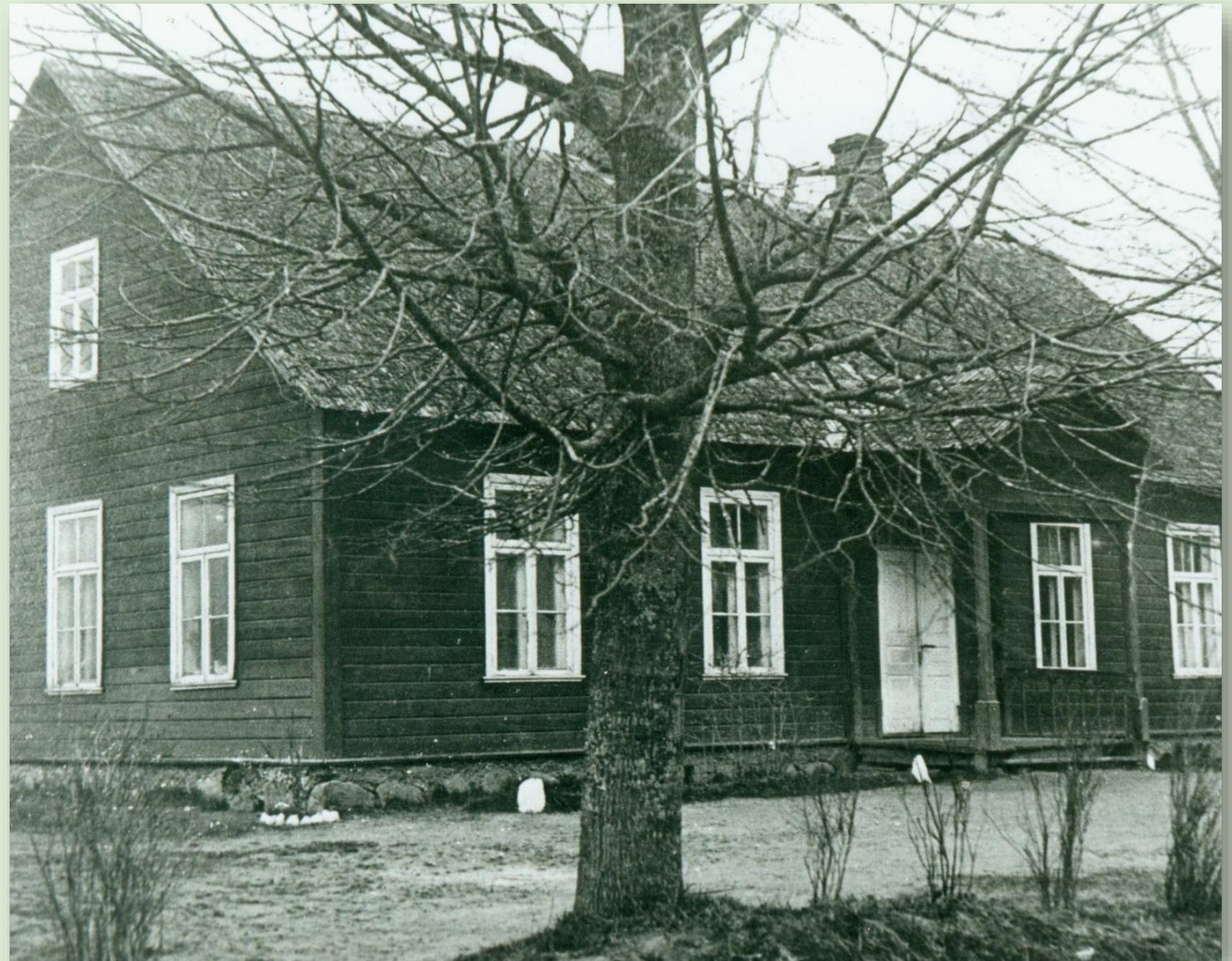
Väike Veerksu algkooli koolimaja 1989.a.

Kooli asutamise ajaks loetakse 1859. aastat, kui Kirmsi kooli üleminekut vene-õigeusklike laste õppeasutuseks. Pärast 1945. aastat suurenes õpilaste arv kuni 120ni. Edaspidi hakkas õpilaste arv langema ning kool suleti 1972. aastal.