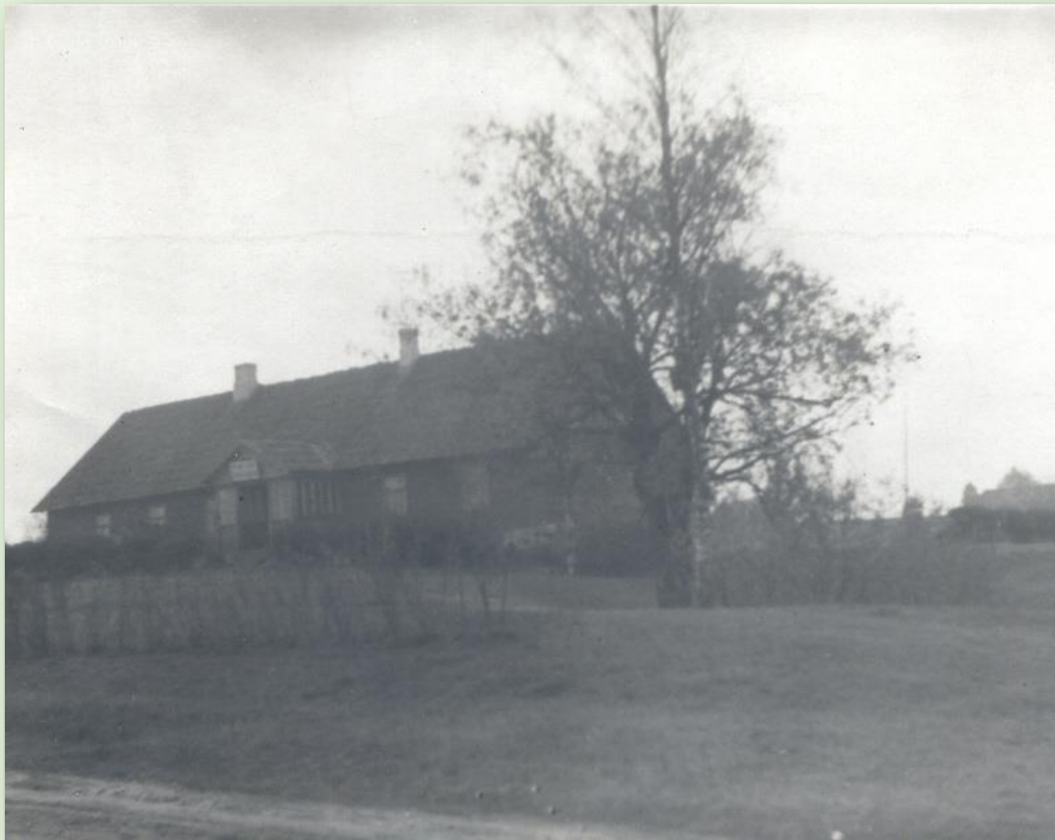
Sänna algkool 1948. a.

Kool asus Sänna külas Rõuge vallas. Selles koolimajas töötas kool alates aastast 1880. Kool suleti 1971. aastal.