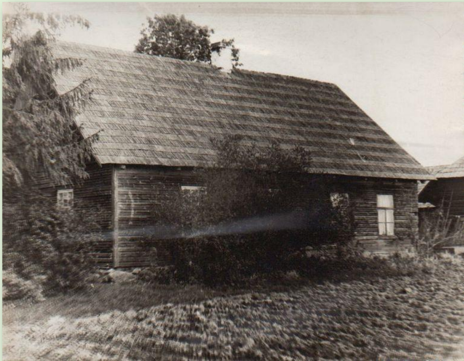
Kureküla koolimaja 1966. a.

Kureküla algkooli (Räpina vald) hoone alates 1950/51. õppeaastast. Laastukatuse ja laudvoodriga endine talumaja.