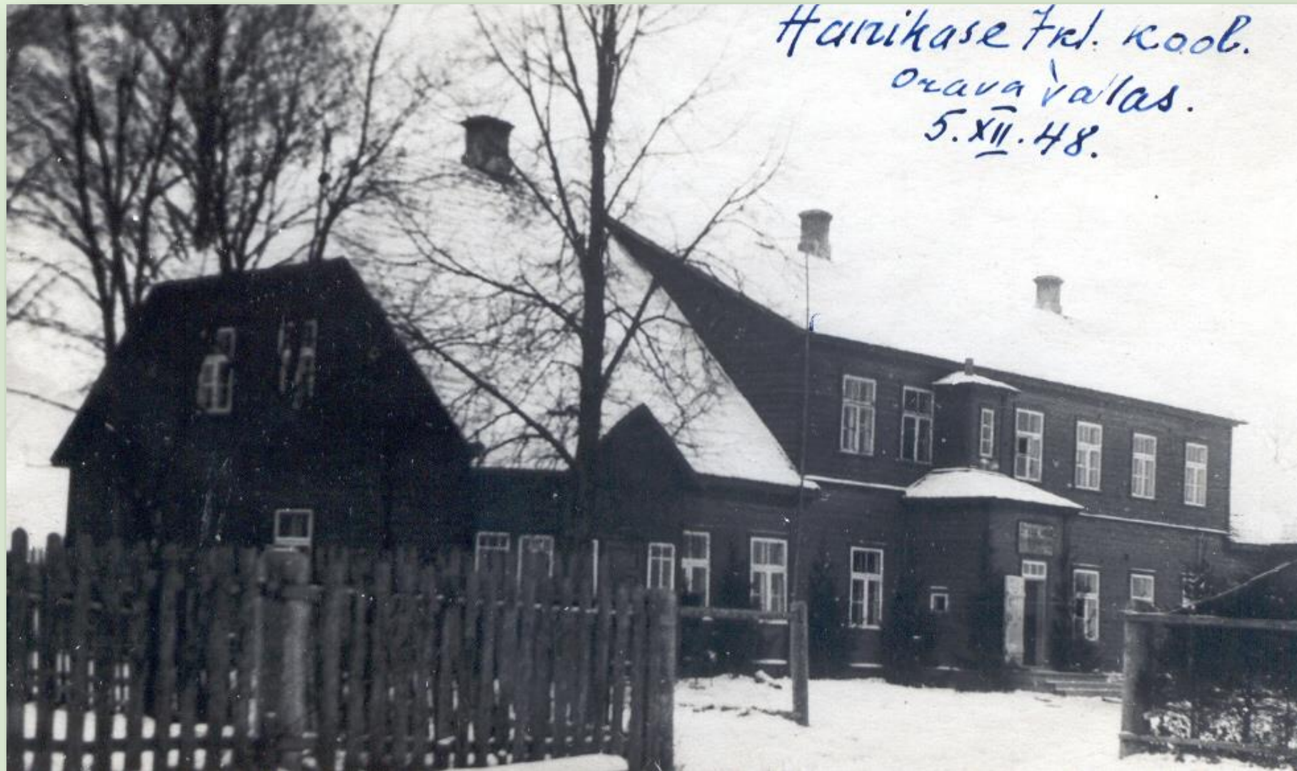
Hanikase 7-kl. Kool 1948. a.

Hanikase kool alustas tööd 1873. aastal. 1874 ostis Orava vald Hanikase külast Koke talu ja ehitas samal aastal koolimajaks. Hanikase külakool muudeti 1899. aastal Orava ministeeriumikooliks. Koolile ehitati ruume juurde. 1919 muudeti kool Hanikase 6-klassiliseks algkooliks. Kool töötas 1991. aastani Hanikase Põhikoolina, nimetati 1997. aastal ümber Orava Põhikooliks ja töötab alates 2014. aastast kuni tänaseni Orava koolina.