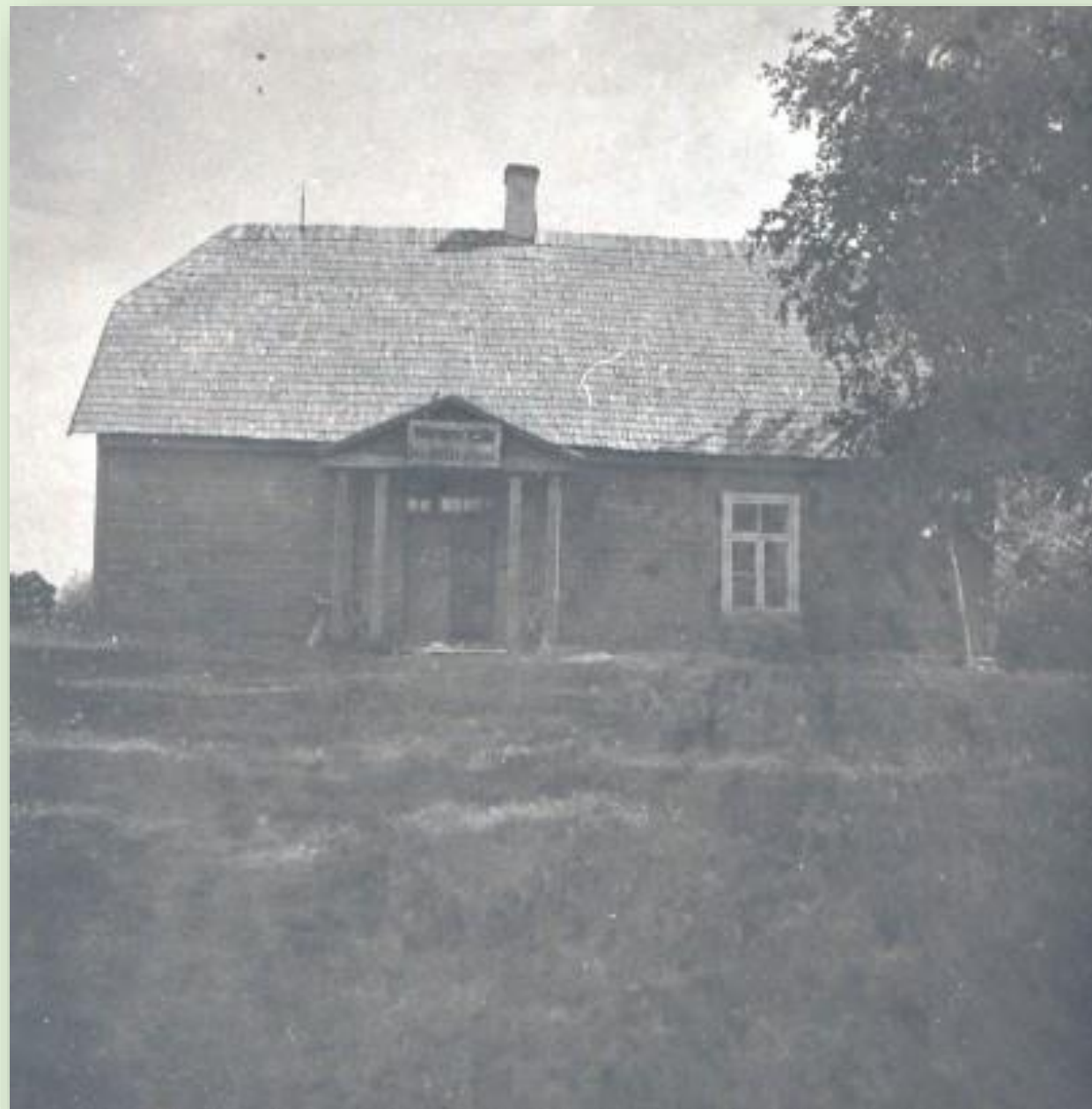
Süvahavva algkool 1948. a.

Kool asus Palomõisa vallas ja asutati umbes 1815. Kool oli 3-klassiline algkool. Peale sõda oli see 6-klassiline algkool, hiljem 7-klassiline mittetäielik keskkool ja siis taas 4-klassiline algkool. Kool suleti 1968. aastal.