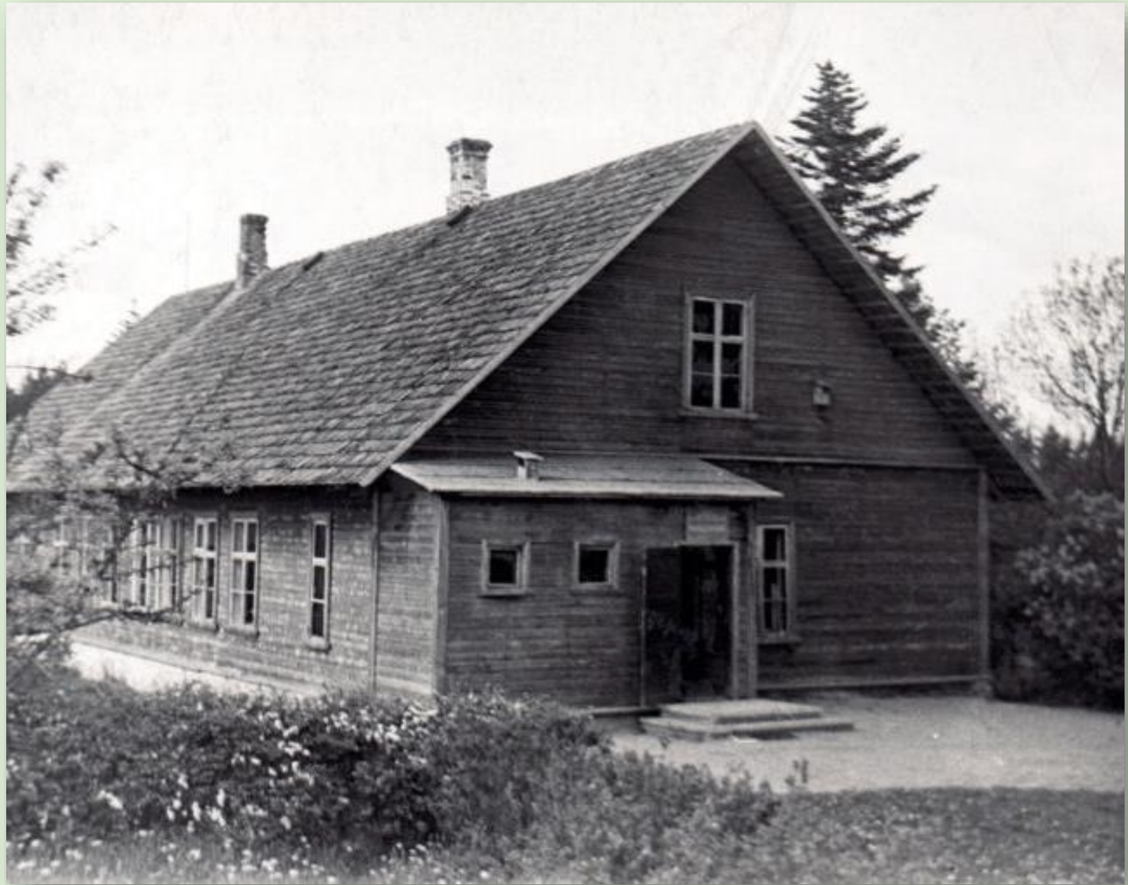
Prangli koolimaja 1966. a.

Prangli kool asutati 1735. aastal Veski vallas Tartumaal. Koolitalu suurus oli 9 ha. Kool oli alguses 2-klassiline algkool, hiljem 6-klassiline. 1945. aastast oli kool 7-klassiline mittetäielik keskkool, hiljem jälle algkool. Kool suleti 1970. aastal.