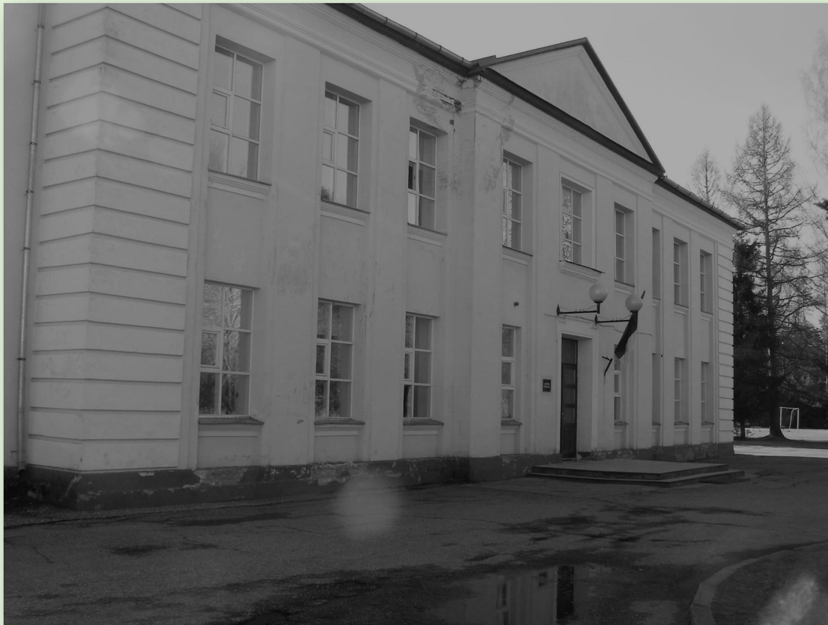
Saverna Põhikooli koolimaja 2010.

Alates 1. septembrist 1992 kannab kool Saverna Põhikooli nime ja töötab tänaseni.