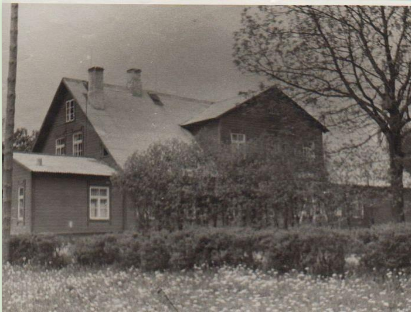
Valgjärve vana koolimaja