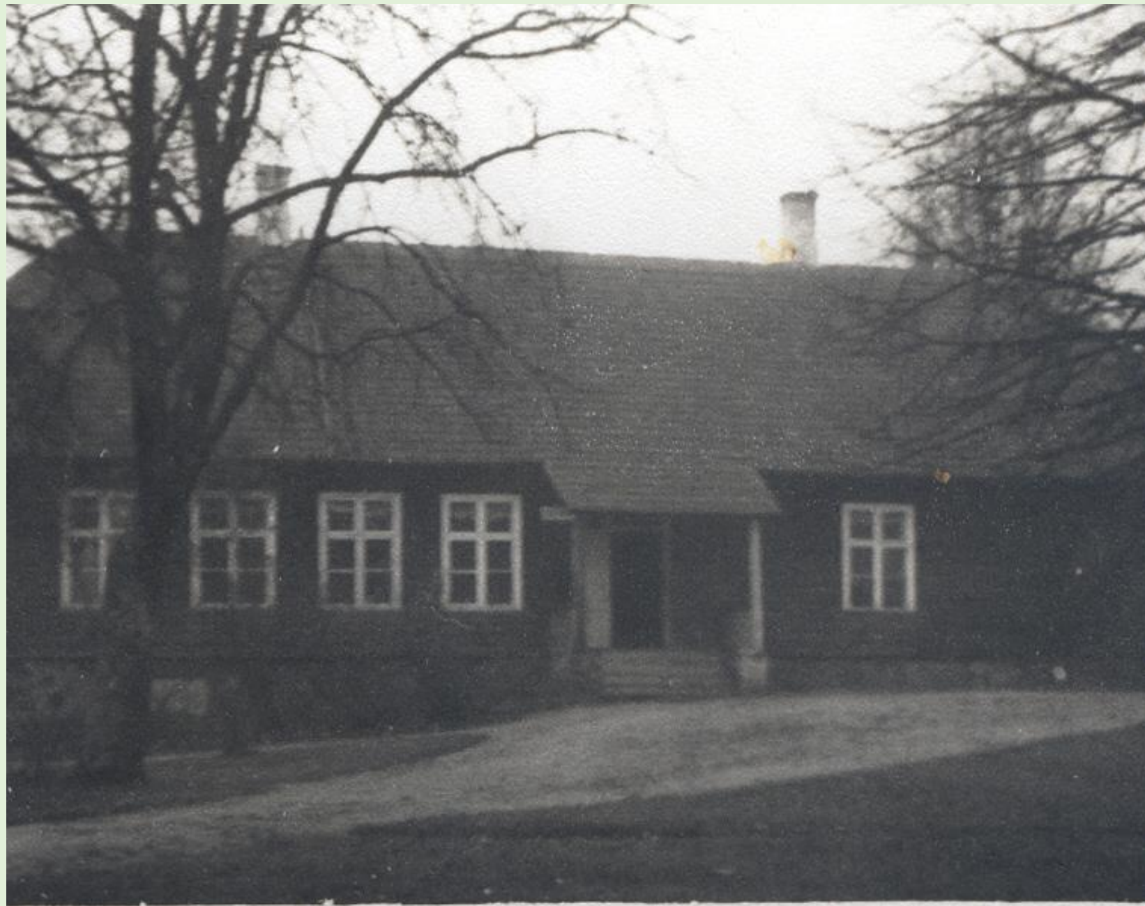
Karste Algkool 1948. a.

Kool asus Kooraste vallas. Aastal 1927 ühendati Kaagvere algkool Karste algkooliga. Kool suleti 1974. aastal.