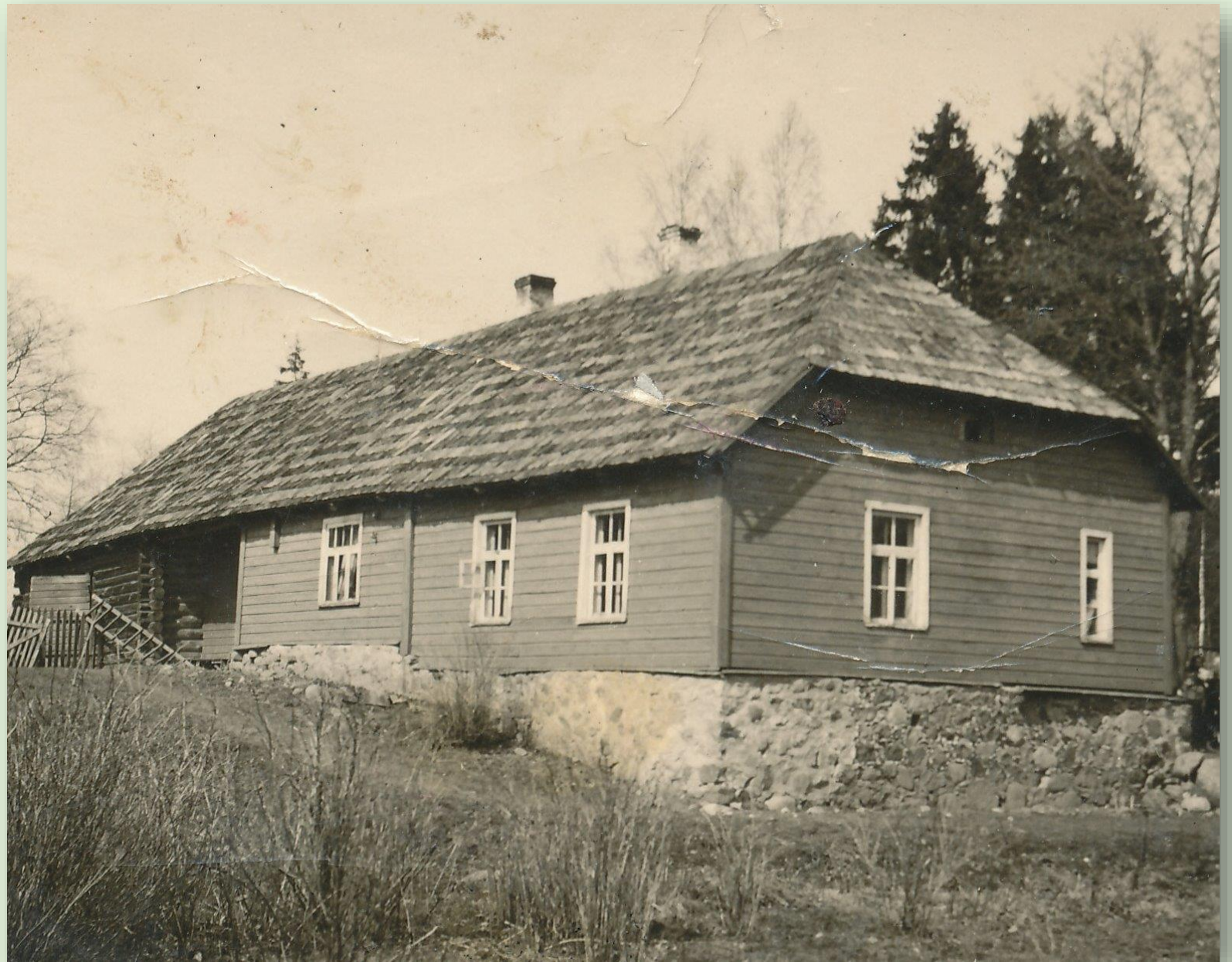
Poksi koolimaja 1948. a.

1866. aastal ehitatud maja asub praegu Vastseliina vallas Voki külas. 1890. aastate lõpul muudeti vallakoolid 3-klassilisteks, seetõttu vajati ka suuremaid ruume. Kui Siksalisse ehitati koolimaja, jäi Poksi koolimajja vaid kolm klassi. 1922 avati ka 4. klass ning see tuli Poksi koolimajja kolmele klassile paariliseks. 1930 kehtestati Eestis kohustuslik 6-klassiline haridus, millega seoses olid nüüd Siksali koolis 1.-3. klassid ja Poksi koolis 4.-6. klassid. 1950. aastal muudeti Siksali-Poksi algkool 4-klassiliseks ning kogu koolipere mahtus taas ära ühte hoonesse. Poksi algkool suleti 1950. aastal.