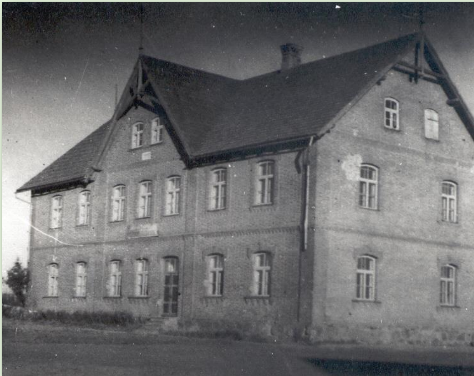
Kuldre koolimaja 1948. a.

1989 nimetati kool Kuldre 9-klassiliseks kooliks ning 1990 Kuldre Põhikooliks. Kool töötab tänaseni.