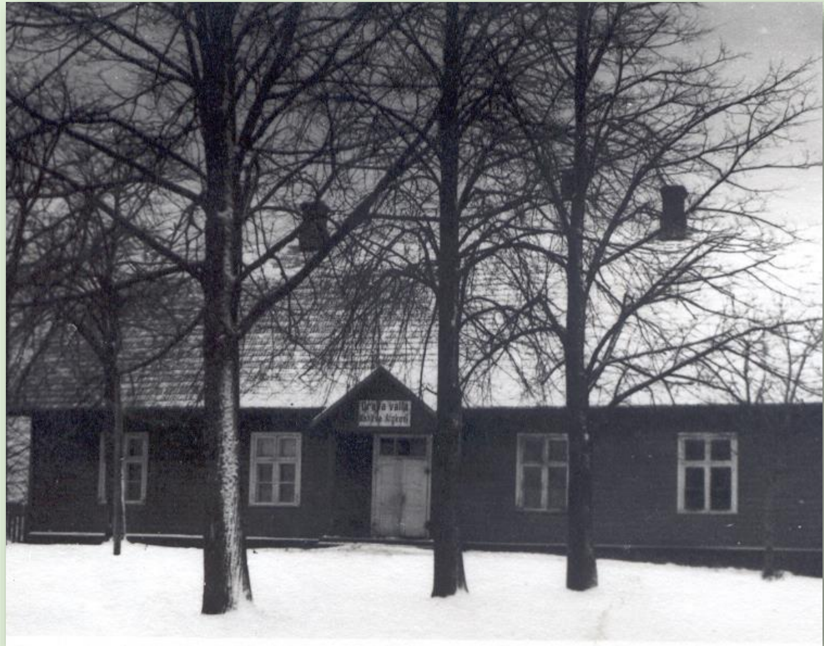
Kahkva koolimaja 1948