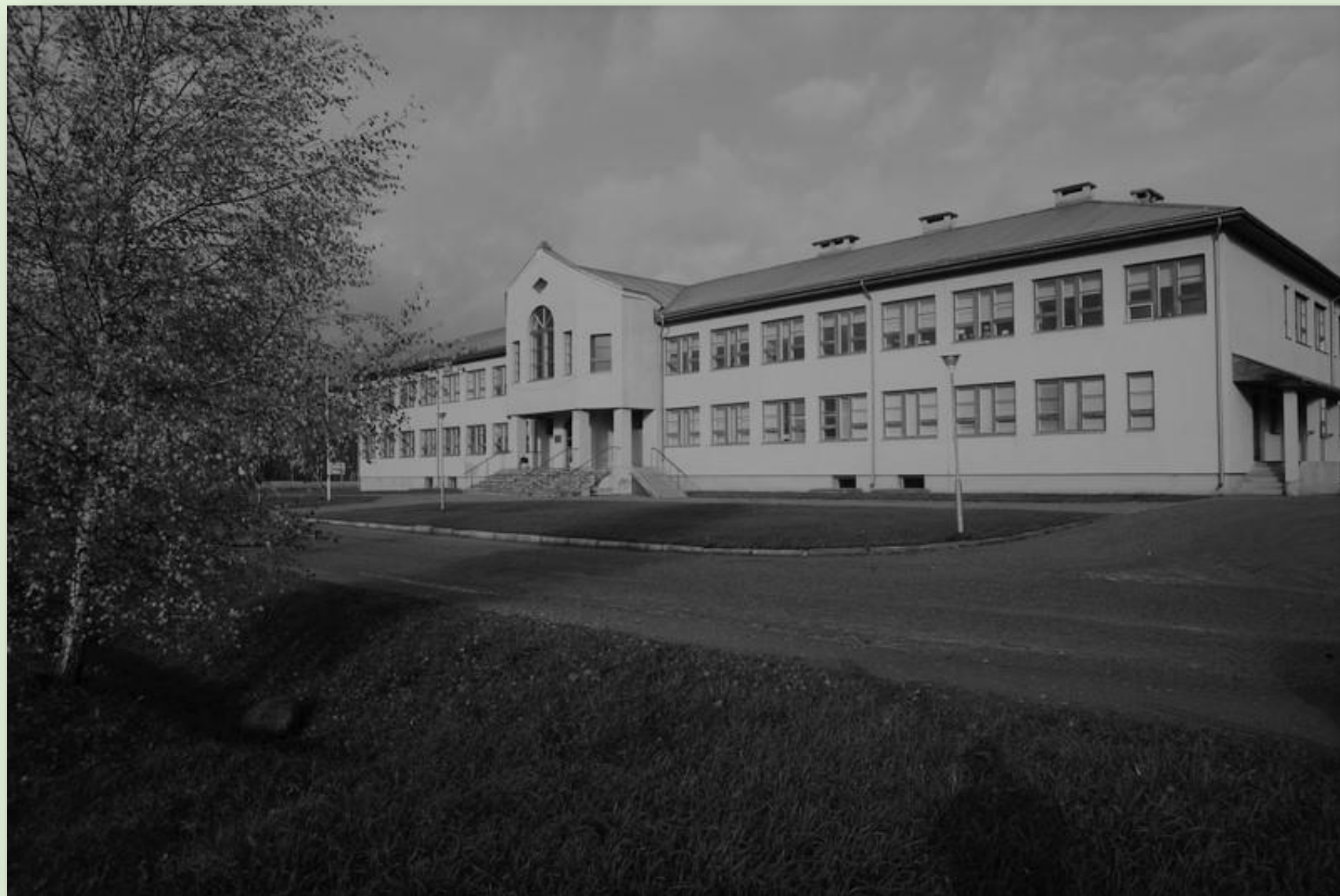
Valgjärve uus koolimaja. Foto: K. Kuusik Karilatsi Vabaõhumuuseumi kogust PTM F 208:338

Valgjärve Põhikooli uus maja valmis 1992. aastal. Kool suleti 2011. aastal.