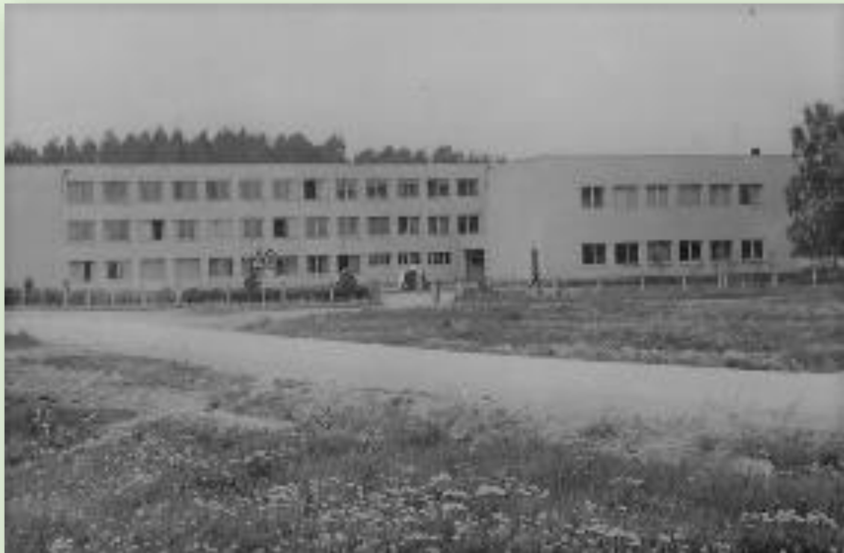
Põlva 8-kl kool 1989. a.

2017. aastal lõpetas kool oma tegevuse, õpilased jätkasid kooliteed samal aastal asutatud Põlva Koolis.