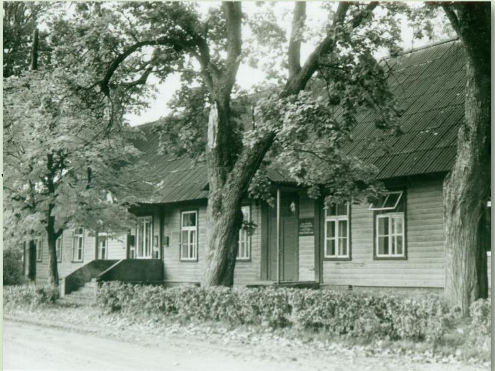
Peri koolimaja 1987. a.

Oma tegevust alustas Peri kool 1766. aastal Sika küla kõrtsis kõrtsmiku õpetamisel. Tänapäevani säilinud koolimaja ehitati aastal 1885. Läbi aegade on kool kandnud erinevaid nimesid: 1766 - Sika külakool, 1904-17 - Peri ministeeriumikool, 1917 - Sika algkool, 1937 - Peri algkool, 1944 - Peri 7-klassiline mittetäielik keskkool, 1962 - Peri 8-klassiline kool, 1988 - Peri 9-klassiline kool, 1991 - Peri põhikool. Kool suleti 2004. aastal.