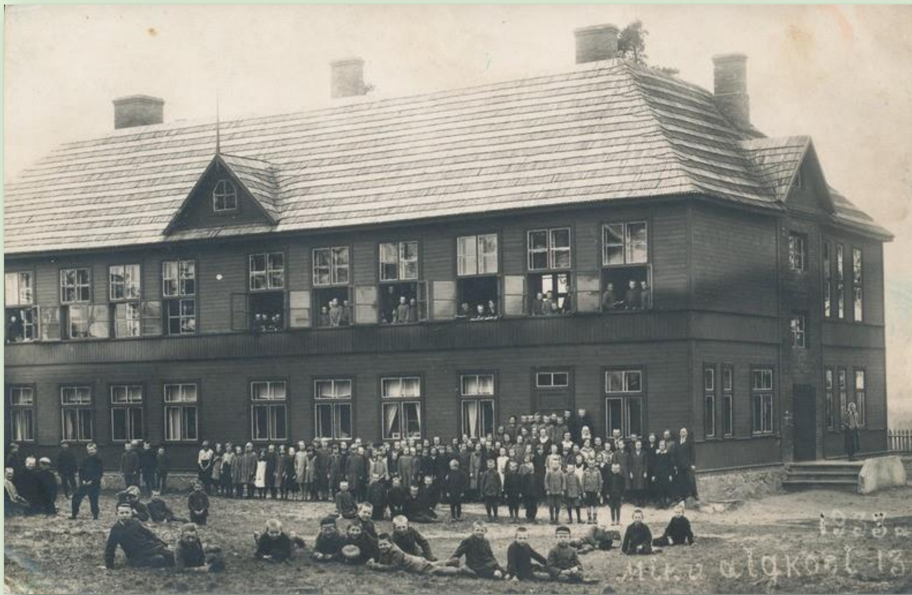
Miku Algkool 29. mail 1933. a.

Varstu koolihariduse alguseks loetakse 1863. aastat, mil valmis koolimaja Krigulis. 1869. aastal rajati selle asemele Miku kool, mis sai nime talukoha järgi. Vana vallakoolimaja müüdi 1920. aastate alguses oksjonil ja kool seati sisse ajutistes ruumides - endises õigeusu algkoolimajas ning vanas kõrtsihoones. Kui 1922. aastal kõrtsihoones lagi alla kukkus, kiirendas see uue koolimaja ehitamist. 1924-1925 valmis uus koolimaja, mida kasutati kuni 2006. aastani, mil viidi uude hoonesse üle ka algklassid.