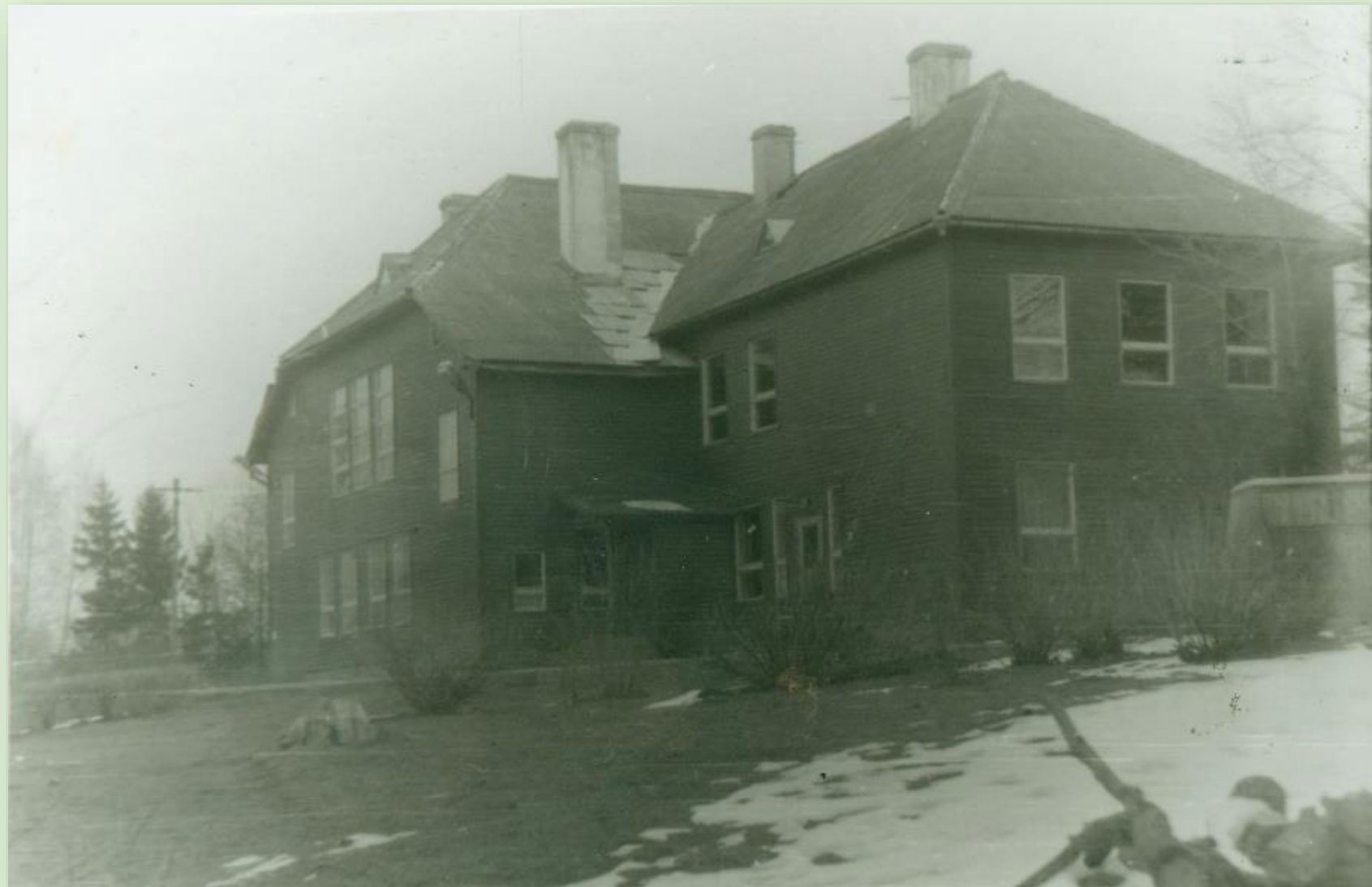
Karaski koolimaja Karaskis. Foto: J. Nopri 1983.

Karaski kool tegutses aastani 1989, mil Krootusel valmis uus koolimaja. Asulasse uude majja kolimisega sai kooli nimeks Krootuse Põhikool.