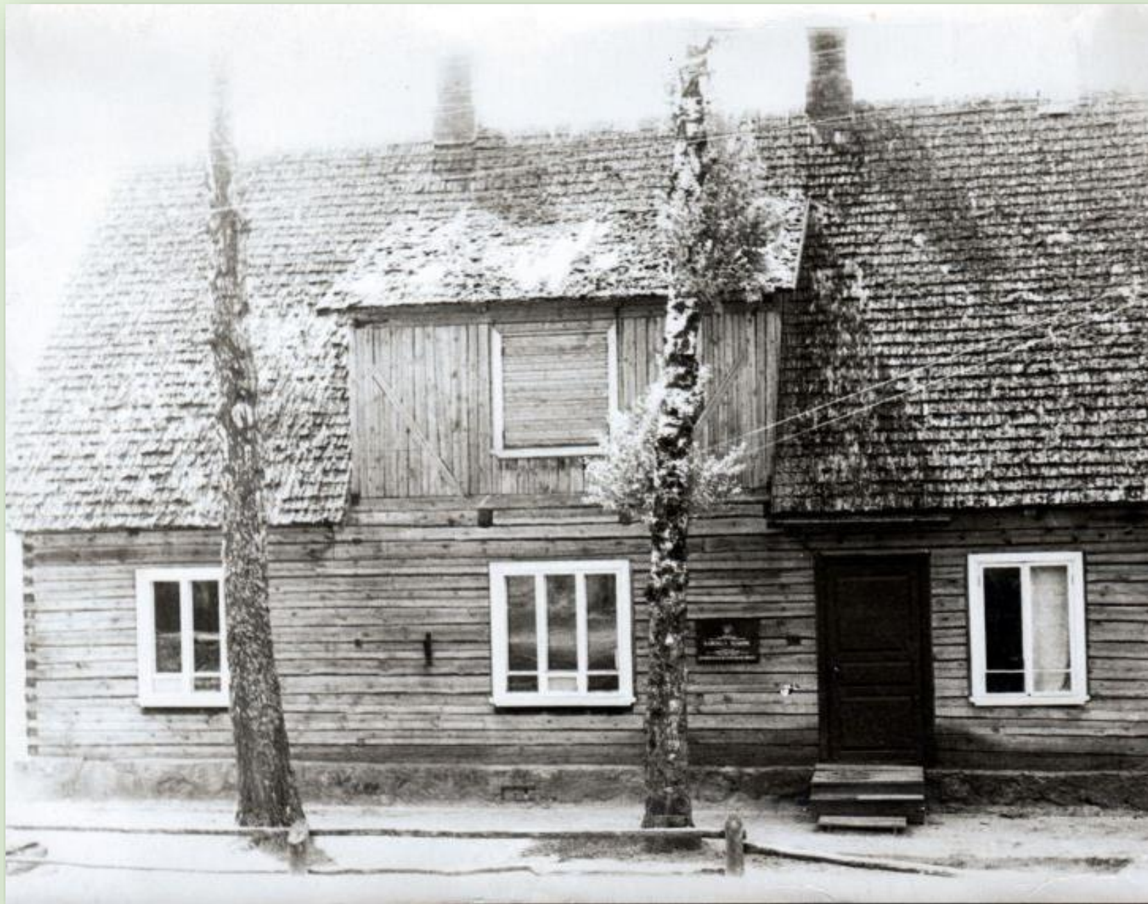
Karisilla koolimaja 1966. a.