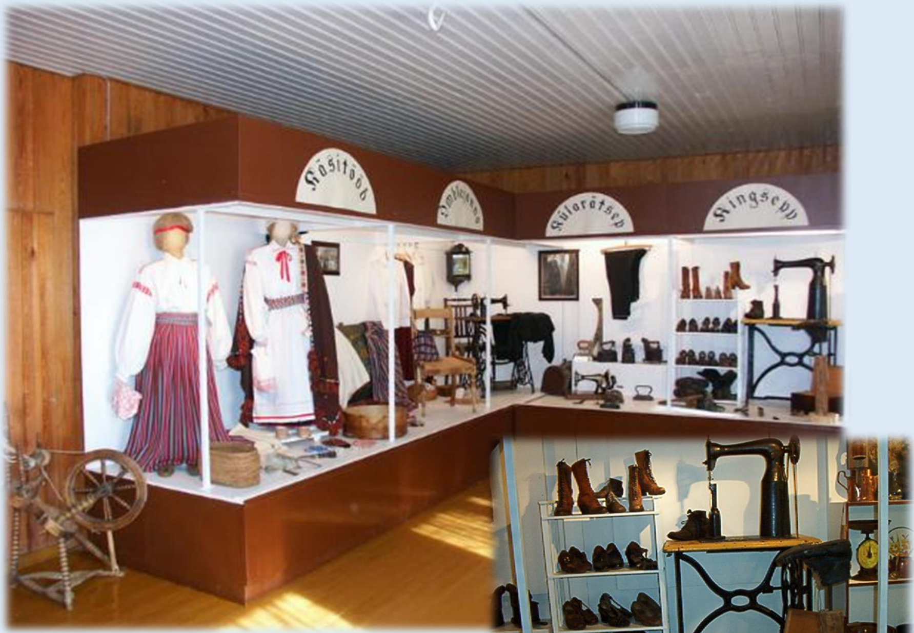
Endine Karilatsi koolimaja on muuseumi peamaja. Püsinäitus koolimajas kuni aastani 2001.