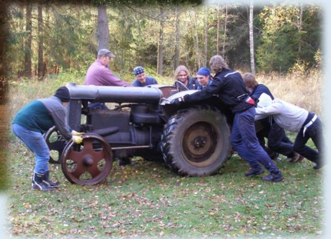
Renoveeritud magasiit avati külastajatele 2009. aastal. Huvilistele vaatamiseks paigutati siia suured põllutöomasinad.