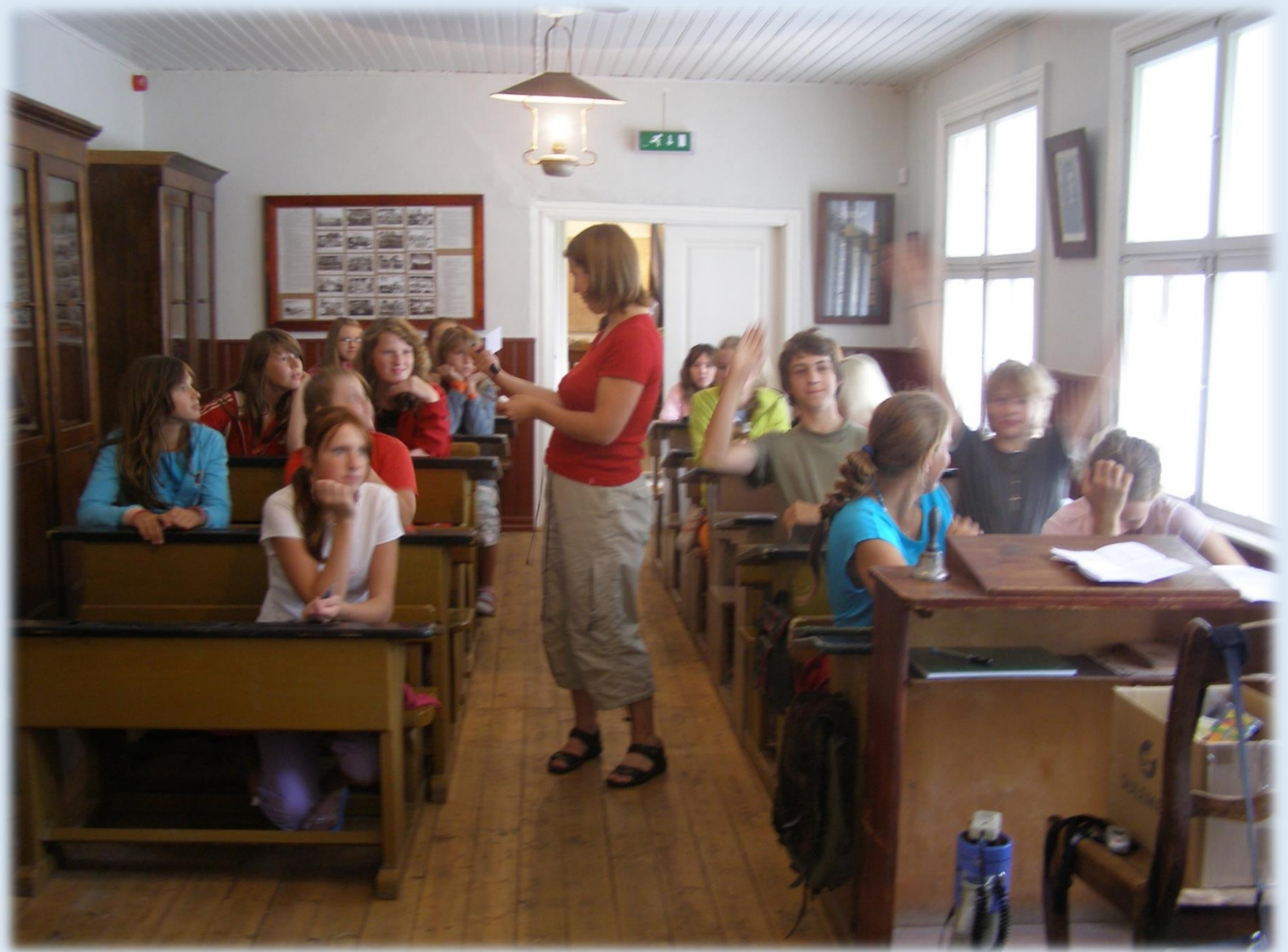
2006 toimus esimene võru keele laager Karilatsis. Keelelaagreid korraldatakse muuseumis tänaseni.