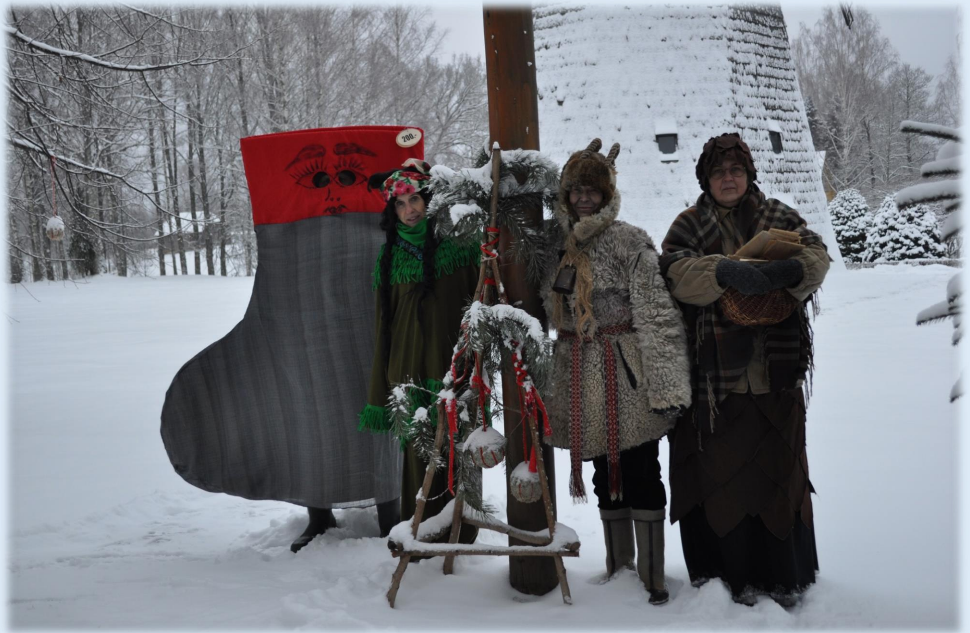
Jõuluprogrammi on Karilatsis pakutud juba rohkem kui 20 aastat. Pildil 2019. aasta jõulumaa tegelased: jõulusokk, Nõia-Gerda, jõulusokk ja Käbiemand.