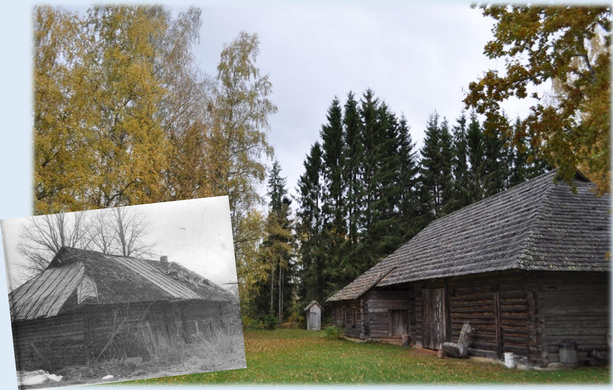
Kähri külast Põlva külje all osteti ja toodi 1986. aastal muuseumisse rehielamu. Rehetare enne lahti võtmist Kähris ja uues asukohas muuseumis.