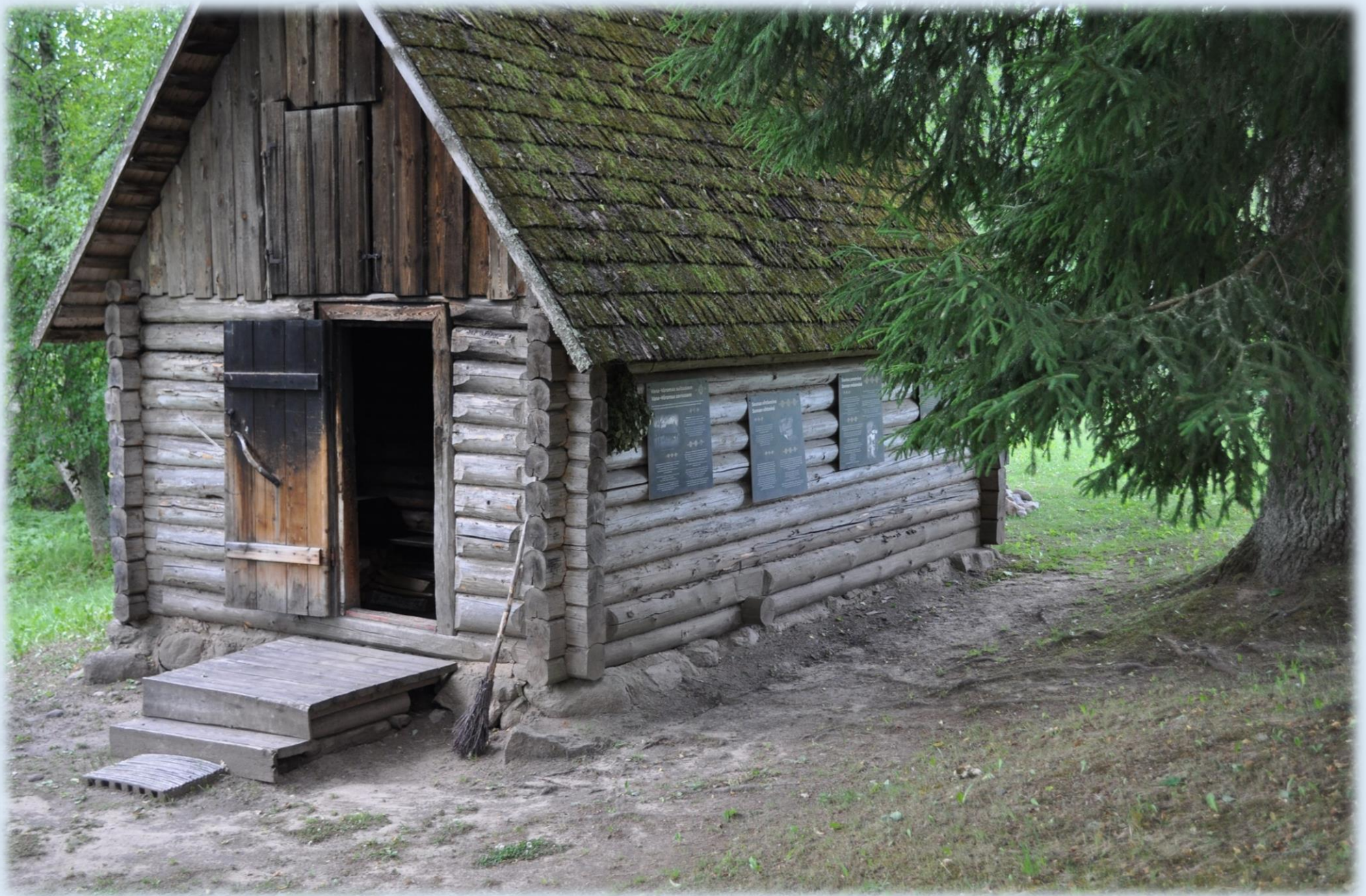
1992. taastati maha põlenud saun. Uus saun on eelmise koopia.