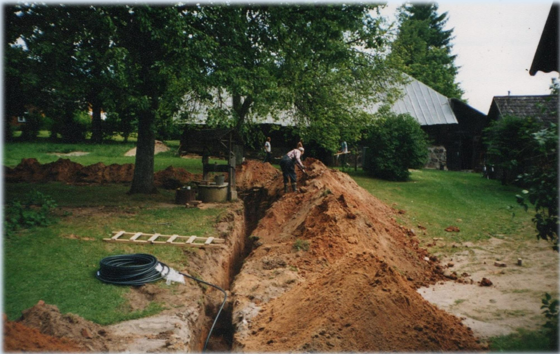
2001. aastal paigaldati kanalisatsioonitrassid ja puhastusseade, remonditi õpetajate maja II korrus. Muuseum sai interneti püsiühenduse.