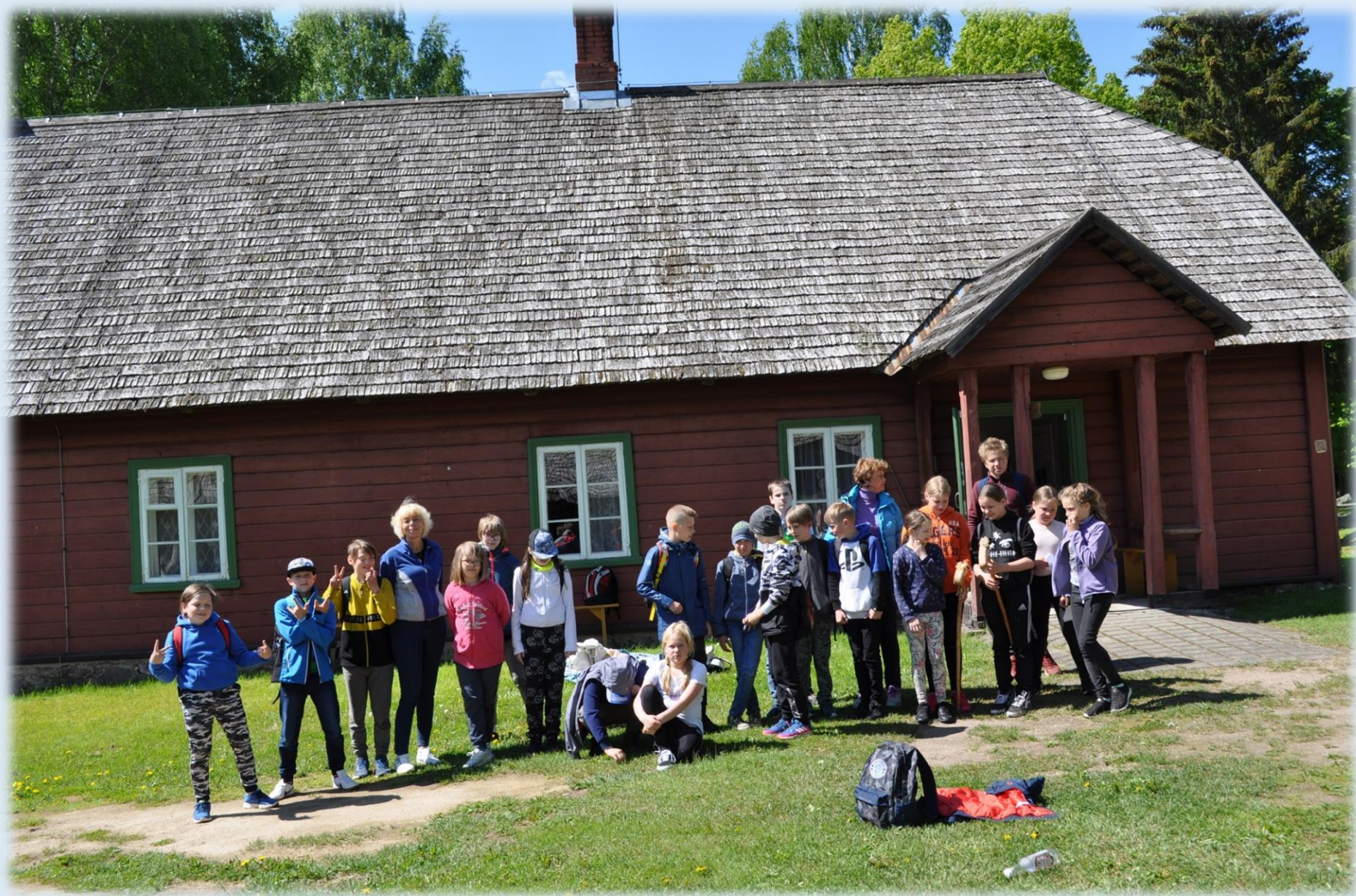
Õpilasgruppide hulgas on muuseum igakevadine armastatud väljasõidukoht. Kevadine kooliekskursioon 2019. a.