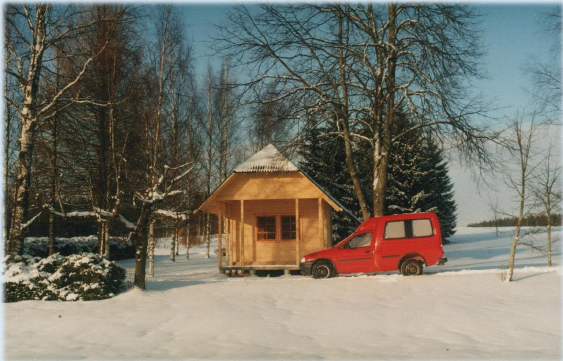
Aastal 1998 asendati tormiga murdunud veskitiivad ja valmis piletimüügi paviljon.