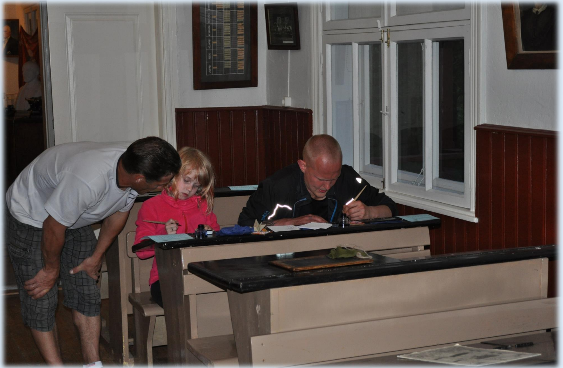
Tindi-sulega kirjutamine pakub tänaseni põnevust nii suurtele kui väikestele.