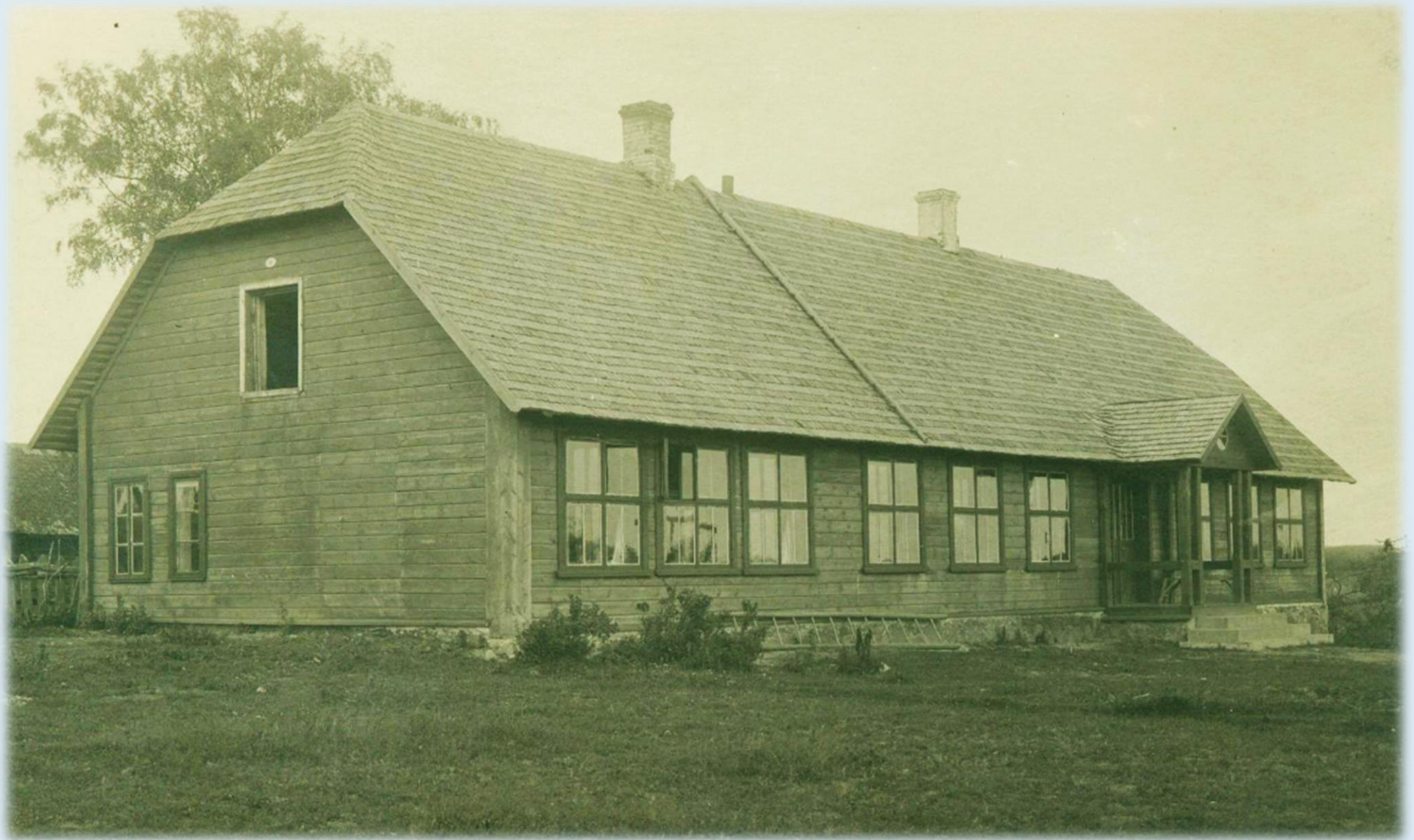
Kõik sai alguse koolist, Karilatsi Algkoolist. 1926.