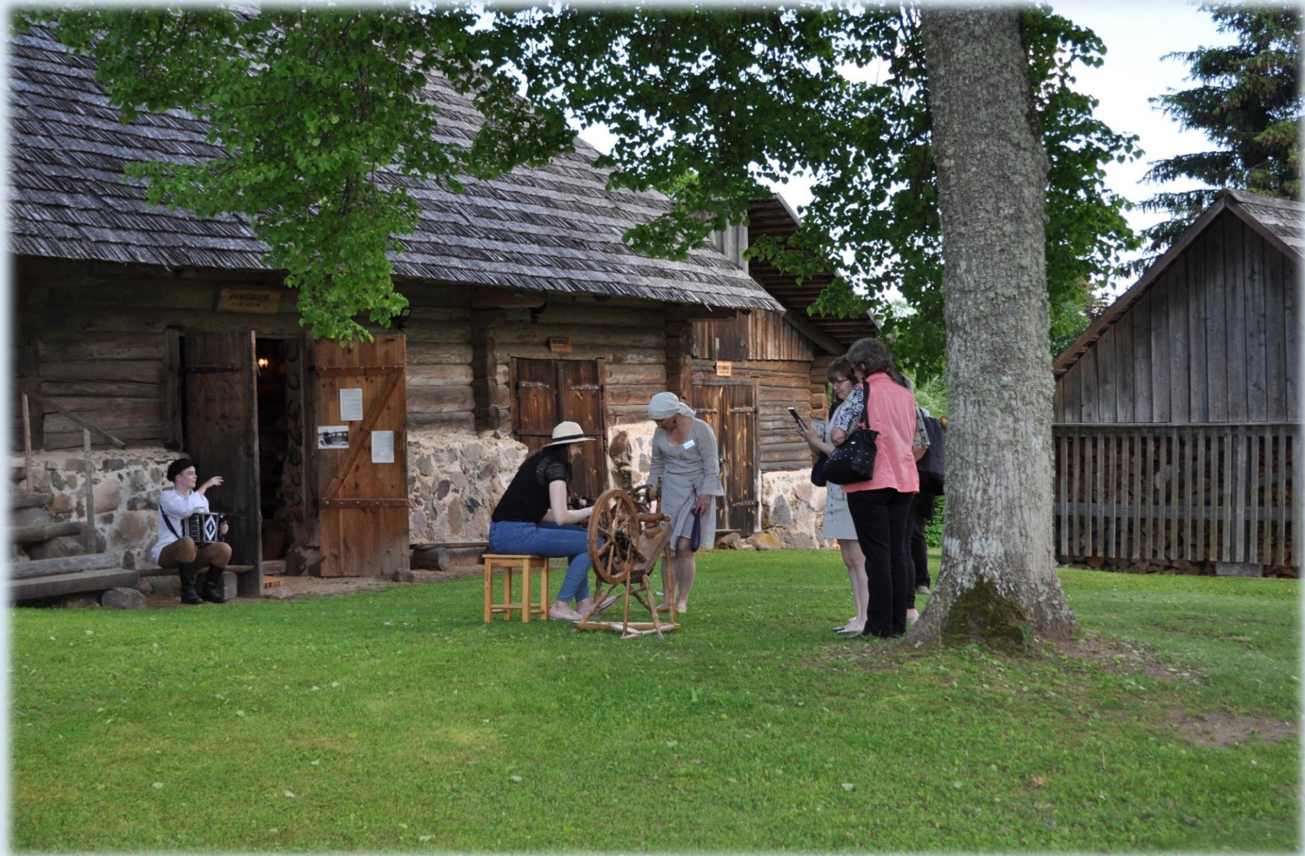
Traditsiooniline Postitee Pillerkaar 2022. aastal.