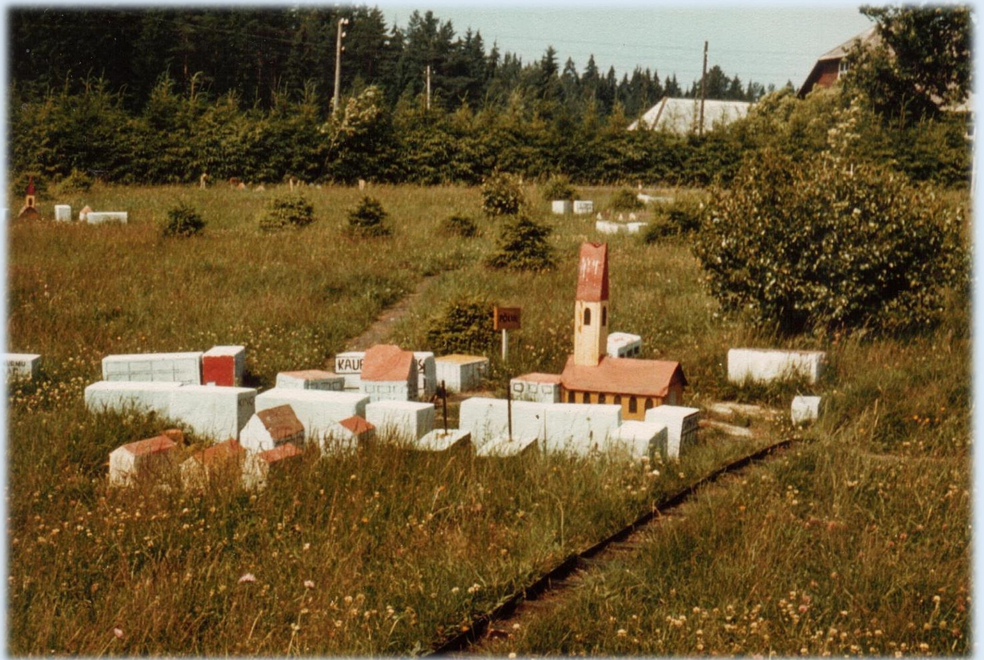
Ühiskondlikus korras valminud Põlva rajooni makett. Esiplaanil Põlva, 1978.