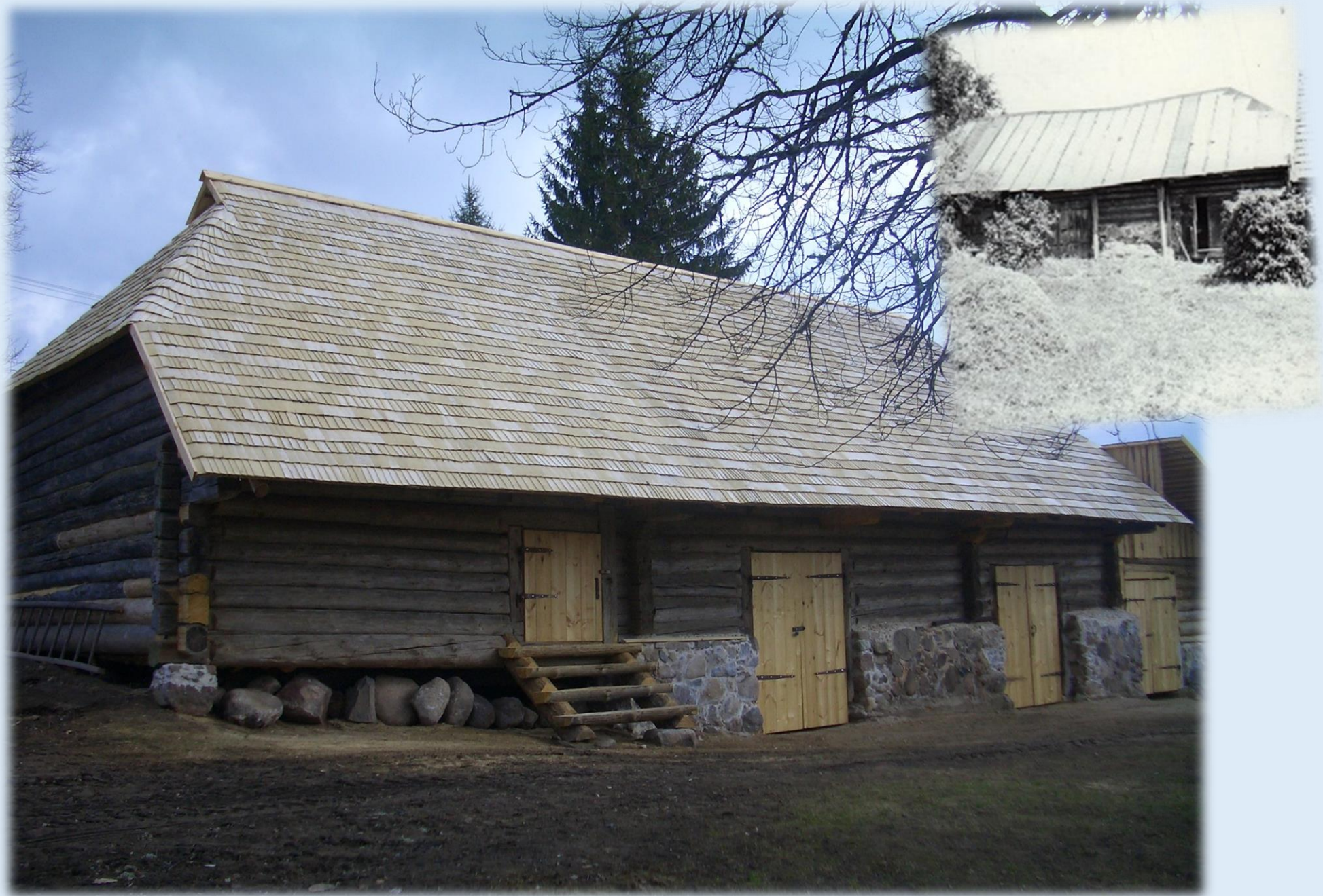
2004 avati vastrenoveeritud käsitöötare ja vankrikuur.