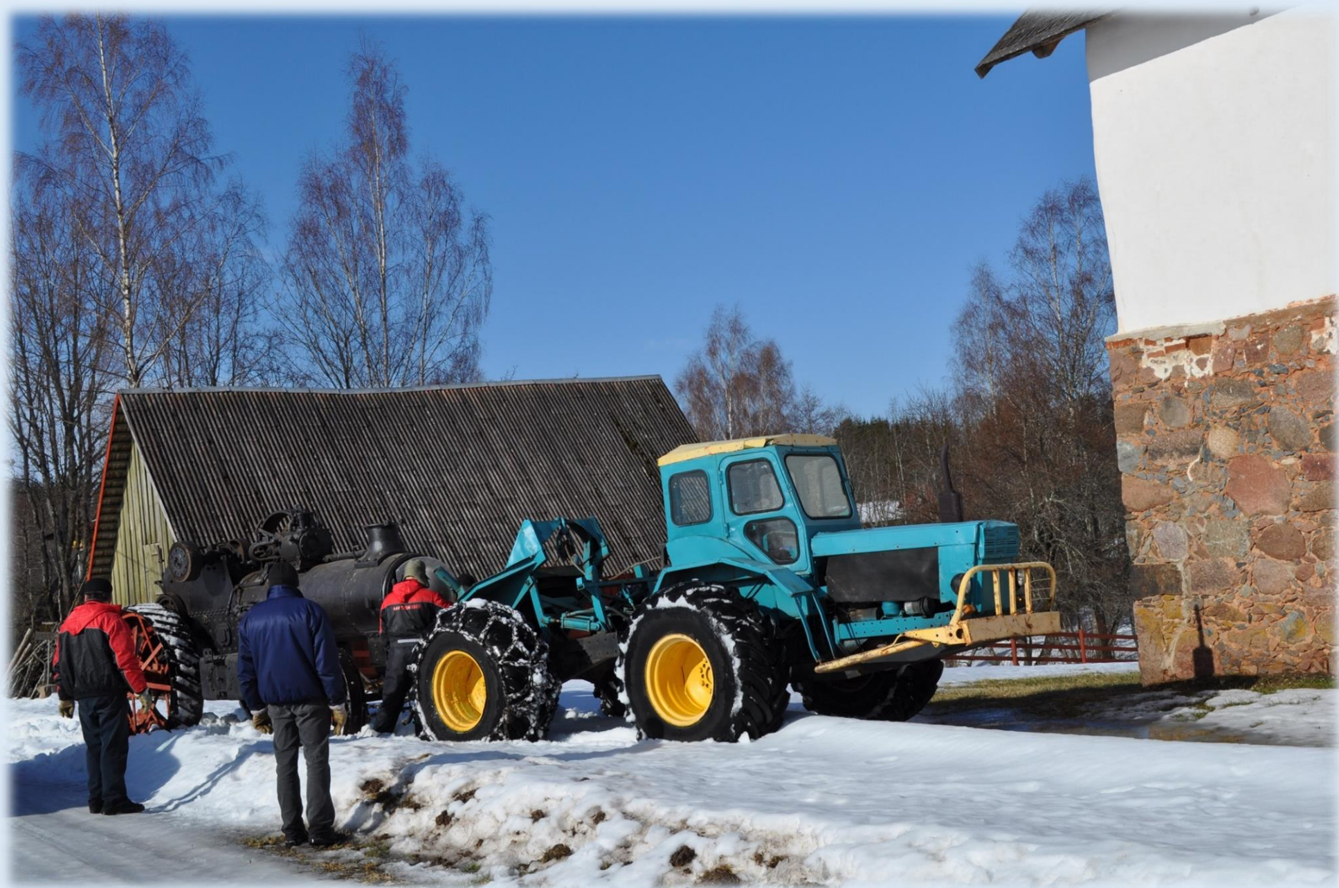
Aurumasin sõidab „uude koju“. 2012. märtsis toodi kõige suurem aurumasin magasiada ekspositsiooni.