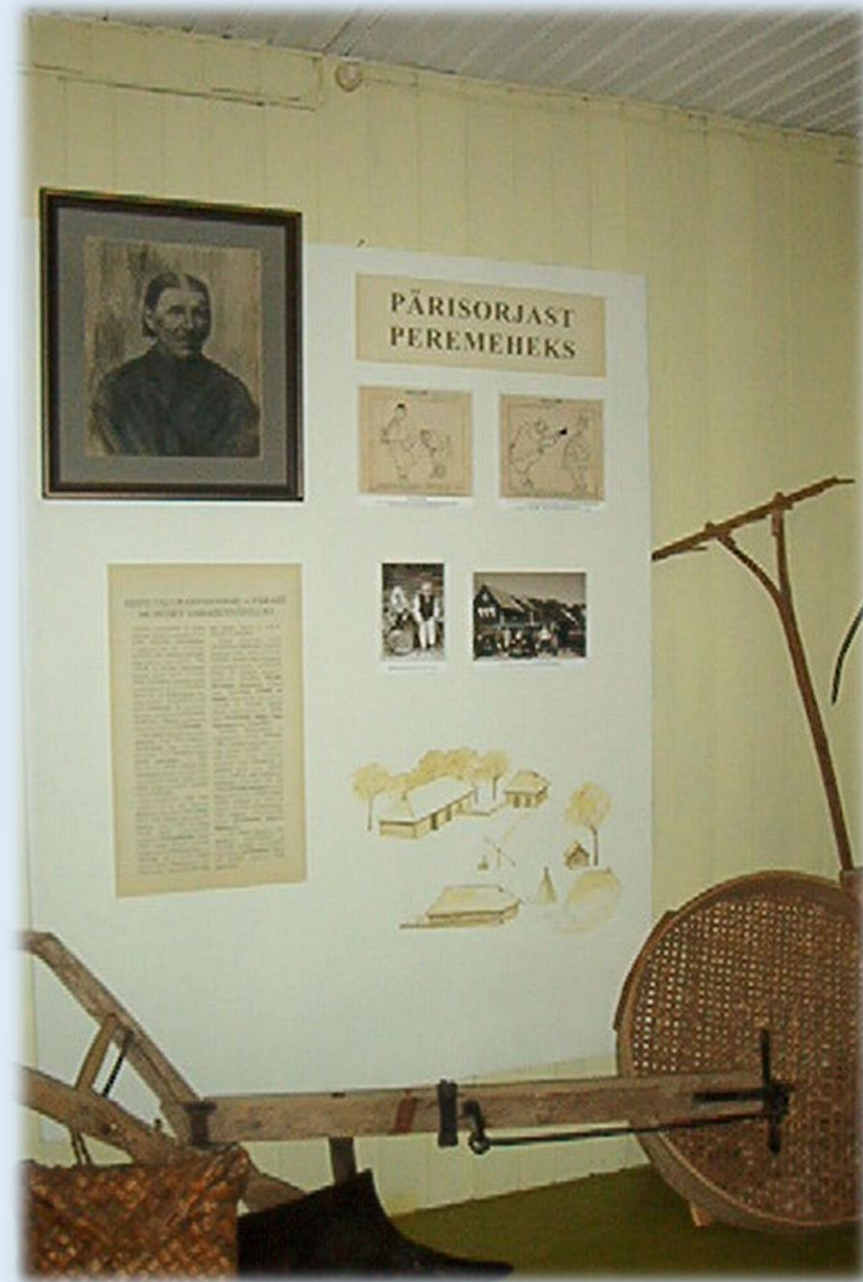
Aastatel 2001-2016 oli koolimajas eksponeeritud püsinäitus „Pärisorjast peremeheks“.