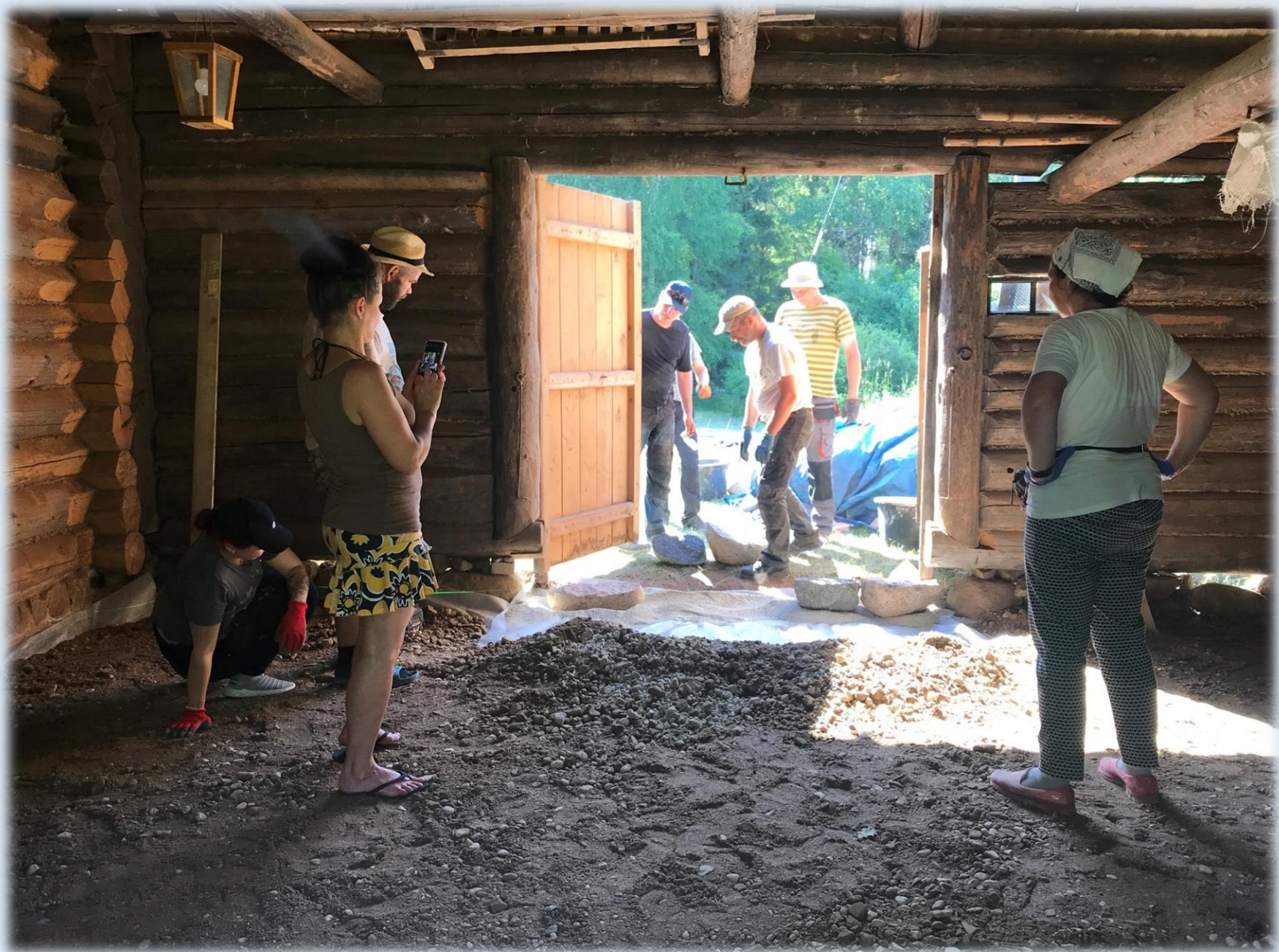
2021. aasta suvel uuendati rehetare ja Punaku talu savipõrandaid.